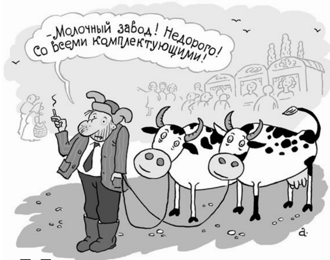
Рис. Василия АЛЕКСАНДРОВА

Тогда эти манипуляции были представлены как ребрендинг — маркетинговая операция по изменению лица компании в связи с изменением стратегии. Были ли глубокие и существенные эти изменения, нам, к сожалению, неизвестно: руководство предприятия не слишком охотно взаимодействовало со СМИ. Для