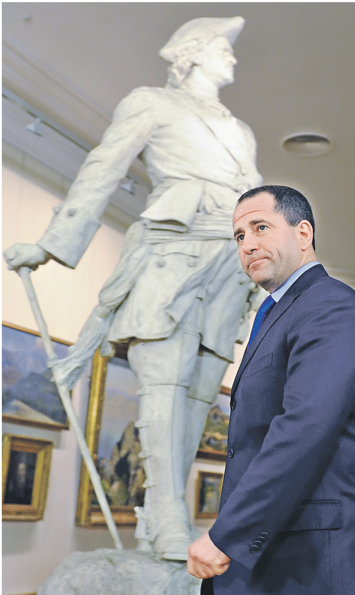
На данный момент Михаил Бабич является единственным кандидатом на пост российского посла на Украине

В последнее время стороны конфликта на юго-востоке Украины и наблюдатели фиксируют рост напряженности, учатившиеся обстрелы. По опубликованным в среду данным управления ООН по правам человека, в июне и июле число жертв среди мирного насе-