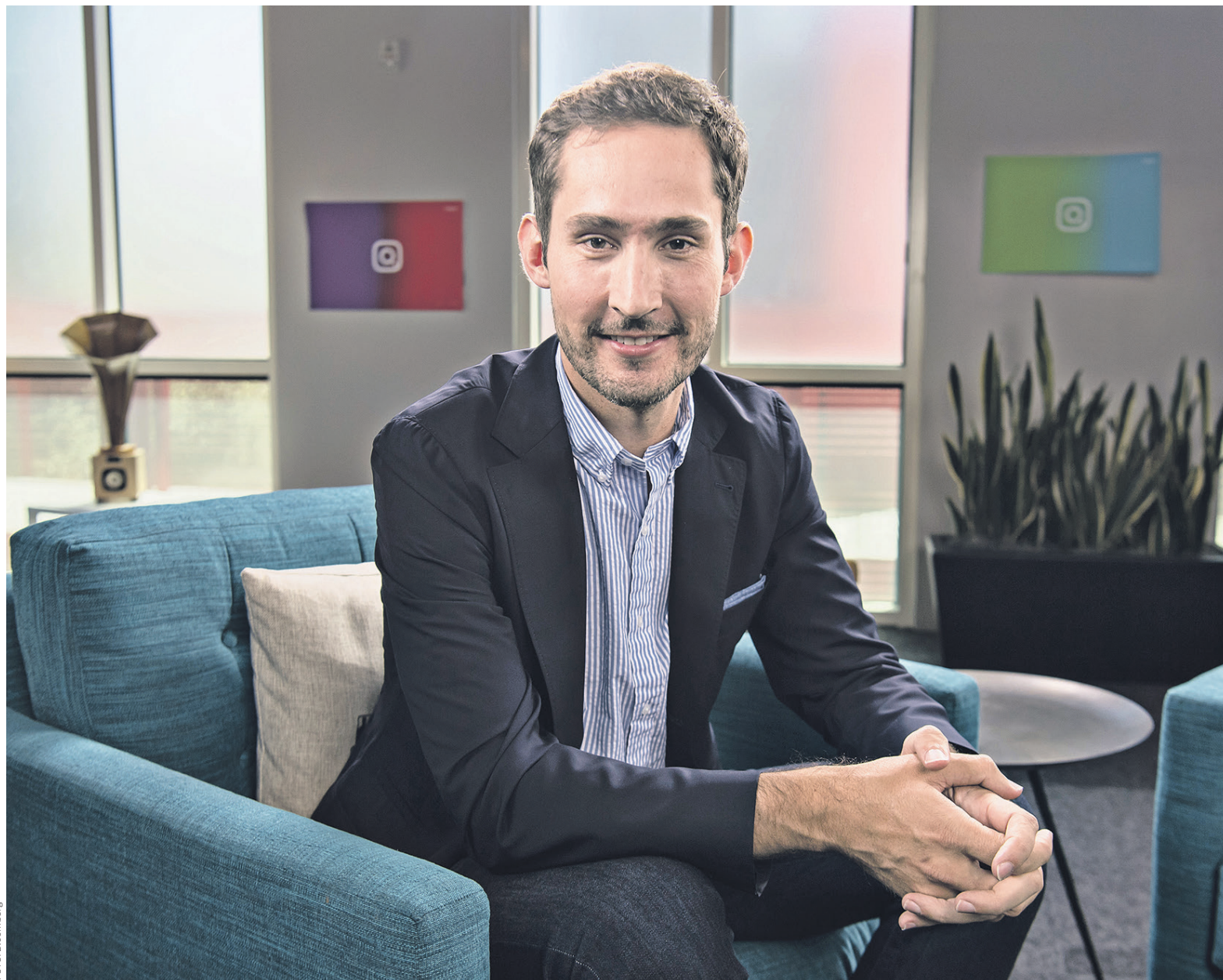
Сооснователь и гендиректор Instagram Кевин Систром задумывается о развитии соцсети. Миллиардер делает ставку на более широкое использование видео в приложении, а в перспективе — на внедрение дополненной реальности