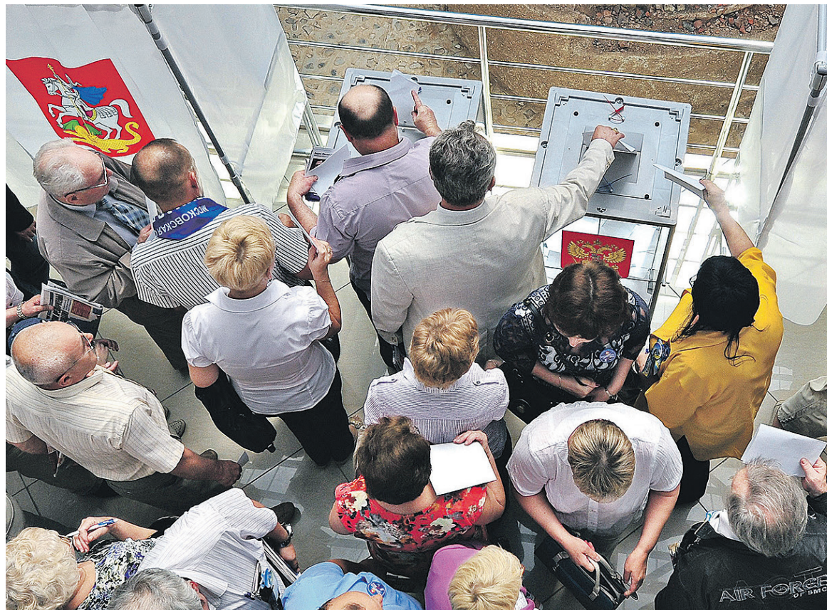
За 7,8 млн руб. должен был быть разработан механизм учета факторов, влияющих на доверие к выборам, оценить степень общественного доверия к их итогам и дать ЦИКу рекомендации по управлению рисками

После этого избирательная комиссия включила заказ мониторинга в план основных мероприятий Российского центра обучения избирательным технологиям (РЦОИТ) при Центризбиркоме. РЦОИТ организовал конкурс, по его итогам победу одержало некоммерческое партнерство «Фонд содействия реформам местного самоуправления», следует из опубликованного в конце июля на портале госзакупок протокола. За 7,8 млн руб. исполнитель должен был разработать механизм учета факторов, влияющих на доверие к выборам, оценить степень общественного доверия к их итогам и дать ЦИКу рекомендации по управлению рисками делегитимации вы-