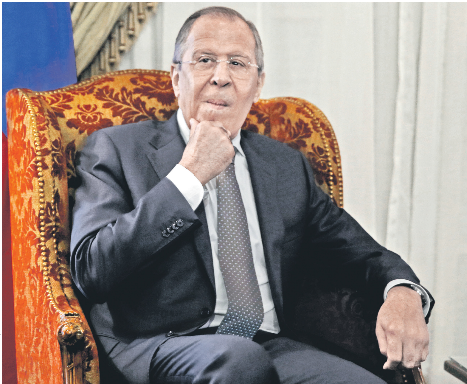
Решение о том, в какой суд подавать иск против правительства США, будет принимать МИД. На фото: министр иностранных дел России Сергей Лавров

ИВАН ТКАЧЁВ, ОЛЕГ МАКАРОВ, АНЖЕЛИКА БАСИСИНИ