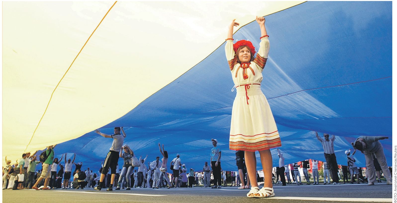
Целиком украиноязычным образованием на Украине станет с 2020 года

За реформу проголосовали чуть больше половины депутатов — 255. «Образование — это ключ к будущему Украины. Новая украинская школа открывает свои две-