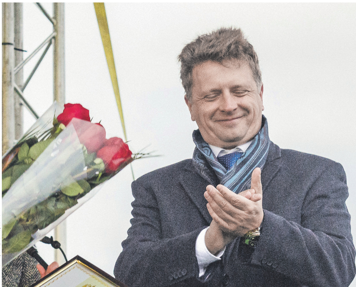
Минтранс, по информации РБК, предложил повысить акцизы на топливо на 1 руб. на литр в 2018 году. На фото: министр транспорта Максим Соколов

В августе Владимир Путин поручил врио губернатора Калининградской области Антону Алиханову завершить строительство. «Нам нужно достроить объездную кольцевую дорогу вокруг Калининграда. В 2008 году мы сдали первую очередь, но работа так и не завершена; до Балтийска планировалось достроить трассу, и ее нужно сделать», — сказал тогда президент. После этого Алиханов заявил, что регион не потянет даже софинансирование дороги и не сможет завершить строительство «ни за три, ни за четыре, ни за десять лет». Поэтому руководитель региона передал проект на феде-