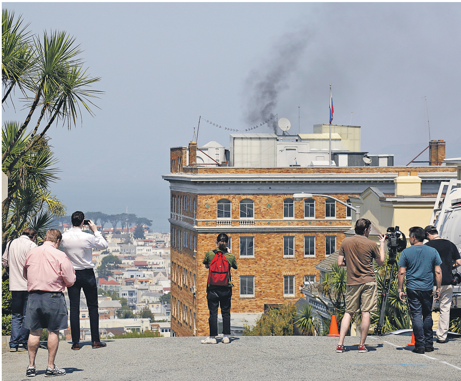
Дипломатический иммунитет с российского генконсульства в Сан-Франциско был снят 2 сентября