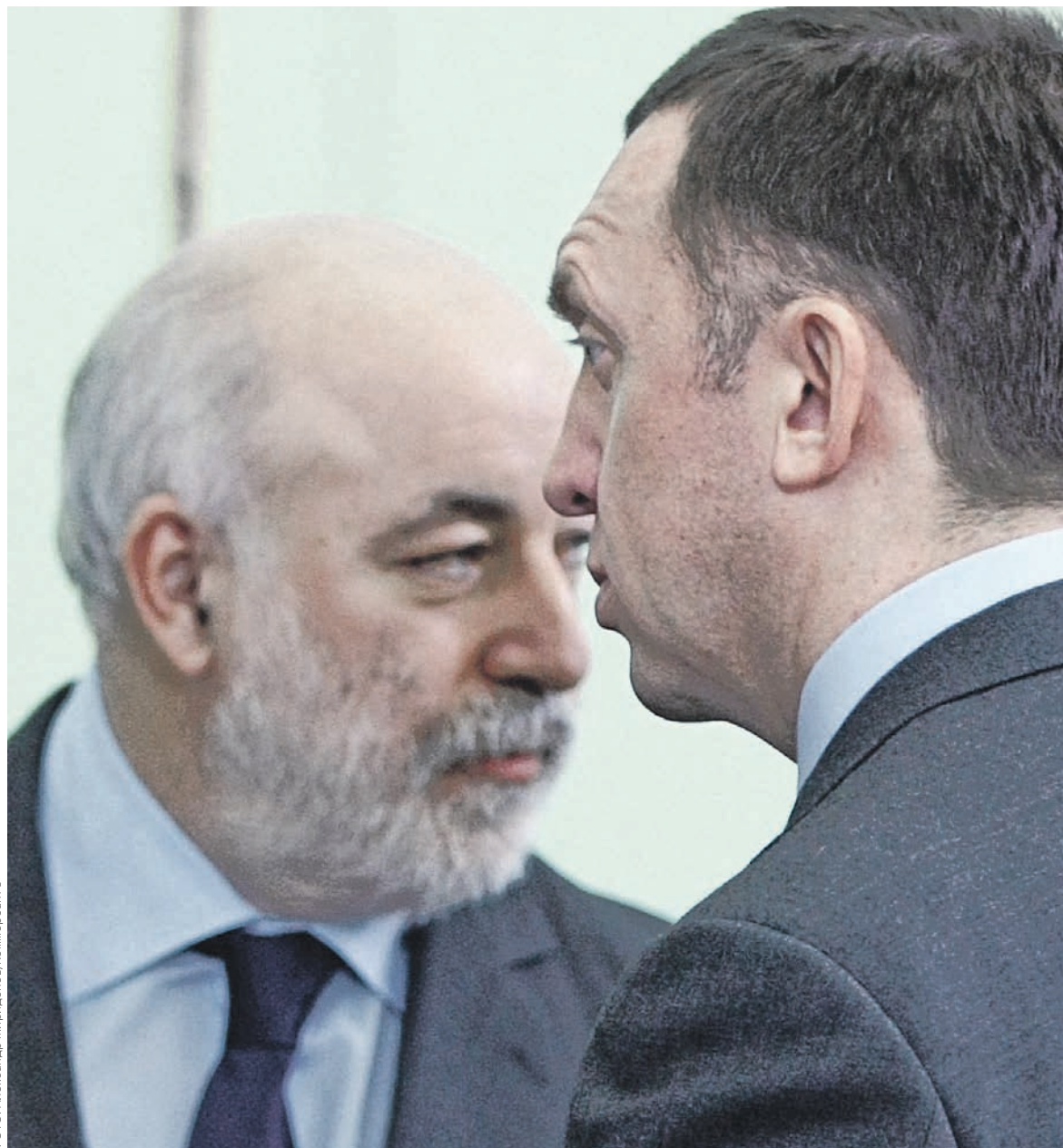
Основной владелец и президент UC Rusal Олег Дерипаска (на фото справа) опасался, что влияние Sual Partners Виктора Вексельберга (на фото слева) в компании значительно увеличится