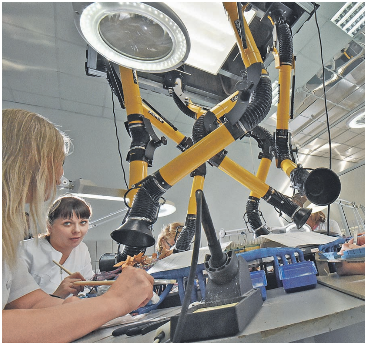
По оценкам экспертов, ориентировочный объем суммарных инвестиций РФПИ в строительство «Ростех-Сити» может достичь 30–35 млрд руб.

Как утверждает один из собеседников РБК, возврат инвести-