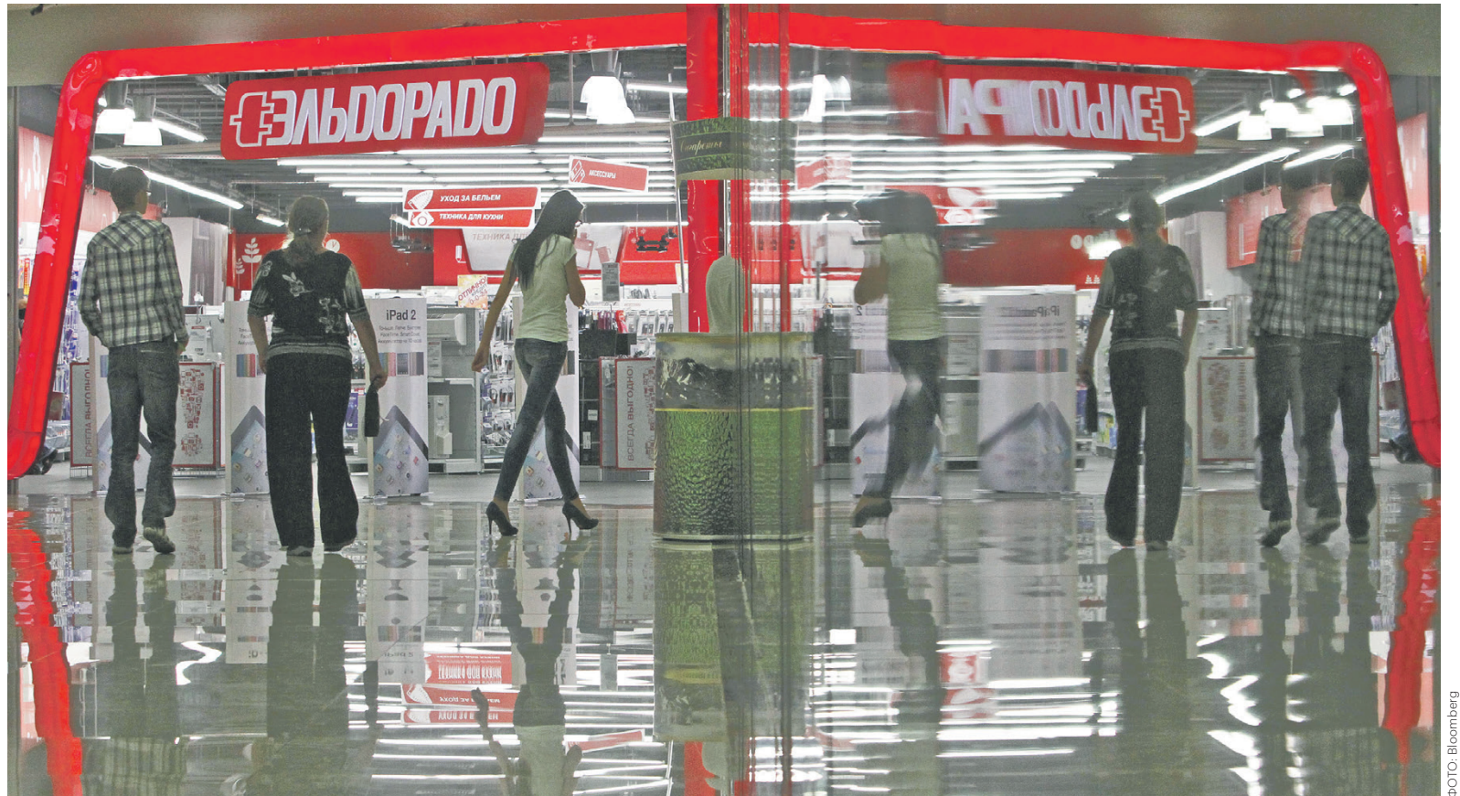
Продажи «Эльдорадо» в 2016 году увеличились на 11% и достигли 130 млрд руб., при этом наиболее динамичным каналом продаж оказался интернет-магазин

В декабре 2016 года стало известно, что группа инвесторов,