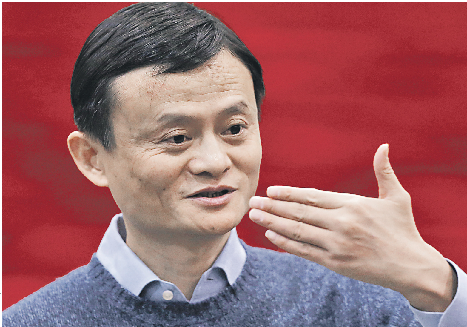
План Alipay — в течение ближайших десяти лет увеличить количество пользователей до 2 млрд человек и довести долю иностранных пользователей до 60%. На фото: основатель Alibaba Group Джек Ма (состояние, по оценке Forbes, — $28,2 млрд)