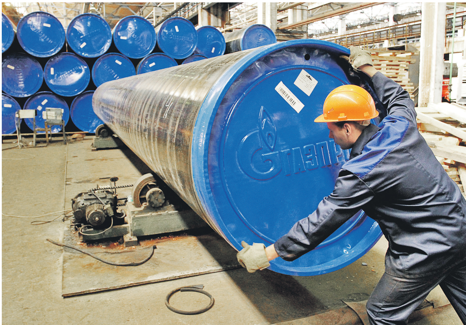
По оценке топ-менеджера компании, участвующей в поставках трубной продукции для проектов «Газпрома», экономия на услугах посредников в стоимости контрактов на поставку труб может составить 1–2,5% от объема контракта