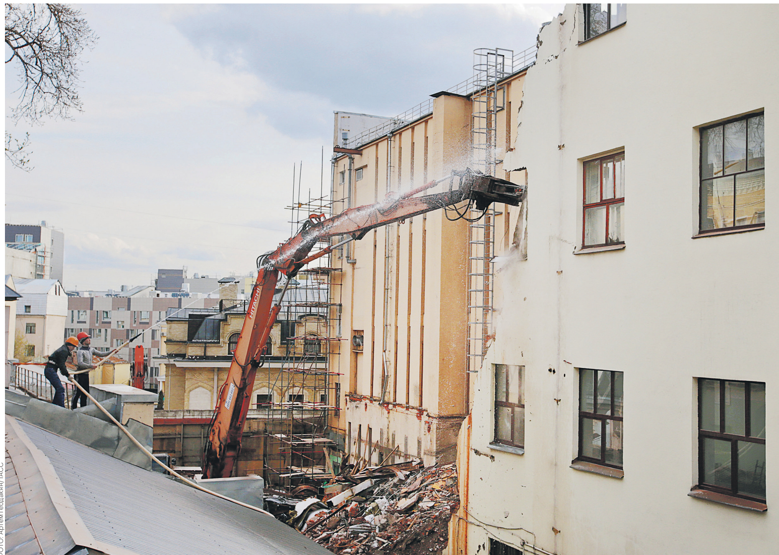
В 2016 году активисты движения «Архнадзор» выступили против уничтожения принадлежащей АФК «Система» Таганской АТС на Покровском бульваре, утверждая, что здание, построенное в стиле конструктивизма, должно быть признано памятником архитектуры, однако оно все же было снесено

Принадлежащие АФК здания АТС в Москве были построены в 1960–1970-х годах и перестали использоваться после того, как в начале 2010-х принадлежащая АФК компания МГТС перешла на технологию GPON. АФК рассма-