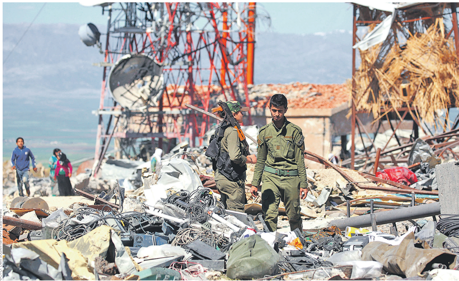
Турецкие военные утверждают, что в результате авиаударов 25 апреля были убиты 70 «террористов» РПК: 40 человек в иракском Синджаре, еще 30 — на северо-востоке Сирии. Однако жертвы были и среди союзников международной коалиции

Днем ранее, 25 апреля, ВВС Турции атаковали позиции курдов в районе горы Синджар на севере Ирака и в районе горы Карачок на северо-востоке Сирии. По заявлениям турецкого Генштаба, в ходе операции были уничтожены объекты РПК, являющейся, по мнению Анкары, террористической организацией. РПК также запрещена в ЕС и США. Турецкий Генштаб объяснил цель проведения операции на сирийско-иракской границе тем, что «террористы сирийской и иракской ветвей РПК активно используют маршруты на севере Сирии и Ирака для переправки в Турцию боевиков, оружия, боеприпасов и взрывчат-