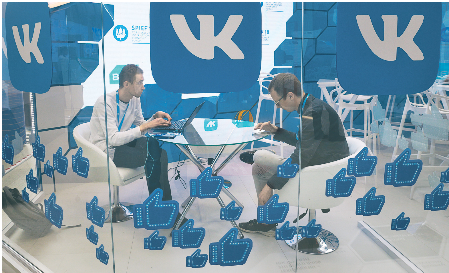
Покупатели и небольшие продавцы, реализующие товар с использованием VK Pay, пока не будут платить комиссию за ввод, вывод и перевод средств

В VK Pay действует ограничение на вывод наличных пользователями — максимум 200 тыс. руб. в месяц, а также на предель-