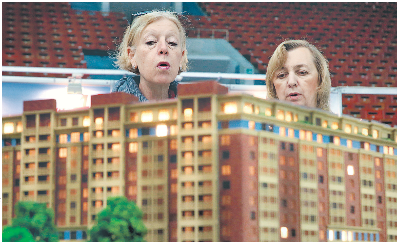
Для реализации программы помощи заемщикам на 2018 год и плановый период 2019–2020 годов предусмотрена докапитализация на 731,6 млн руб., сказал эксперт

Между тем поправками в бюджет на 2018 год и на плановый период 2019 и 2020 годов, принятыми Госдумой в третьем чтении 21 июня, предусмотрена докапитализация «Дом.РФ» на 731,6 млн руб. для реализации программы помощи заемщикам, заявил директор департамента по экспертно-аналитической и контрольной деятельности за работой ЦБ и со-