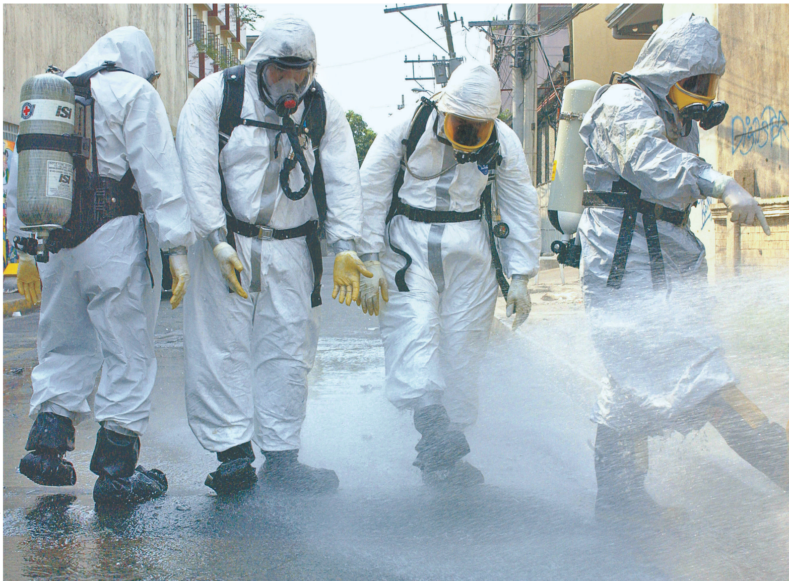
Расследования ОЗХО, по мнению эксперта, нельзя назвать объективными, а попытка расширения мандата организации — очень опасная инициатива

В своем выступлении во вторник Джонсон напомнил про инцидент в Солсбери, а также предполагаемую химическую атаку в сирийской Думе (в восточном пригороде Дамаска), ответственность за которую Запад возлагает на сирийское правительство.