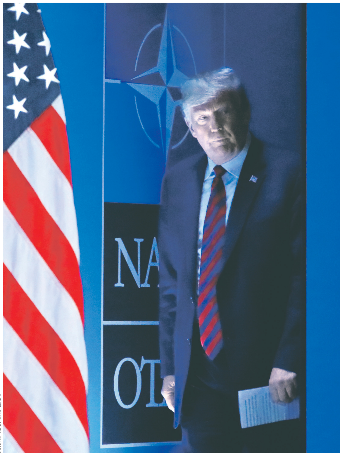
В первый день саммита Дональд Трамп подписал итоговое коммюнике, но не отказался от своего базового требования — увеличить оборонные расходы членов НАТО до 4% ВВП

итоговый документ или же вовсе заявит о намерении выйти из альянса. Тем не менее он подписал в первый день саммита итоговое коммюнике, в котором подтверждается приверженность всех стран альянса обязательству тратить 2% ВВП на оборону. Согласно заявлению увеличение расходов отдельных стран будет идти согласно установленному ранее плану, то есть постепенно, до конца 2024 года.