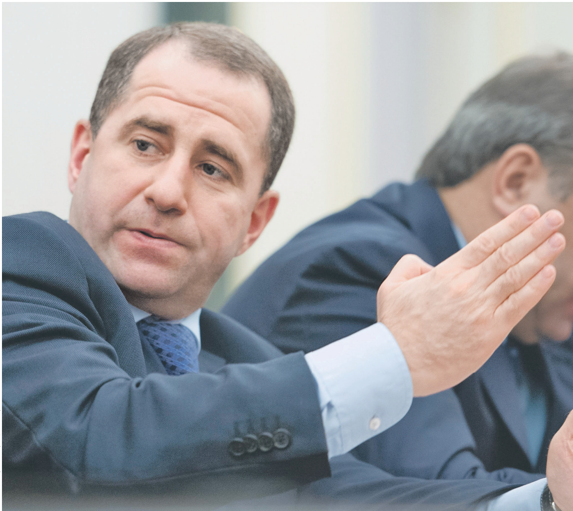
Полпреда президента в Приволжском федеральном округе Михаила Бабича знающие его чиновники характеризуют как жесткого управленца

«Роль посла России в Белоруссии достаточно велика, местный