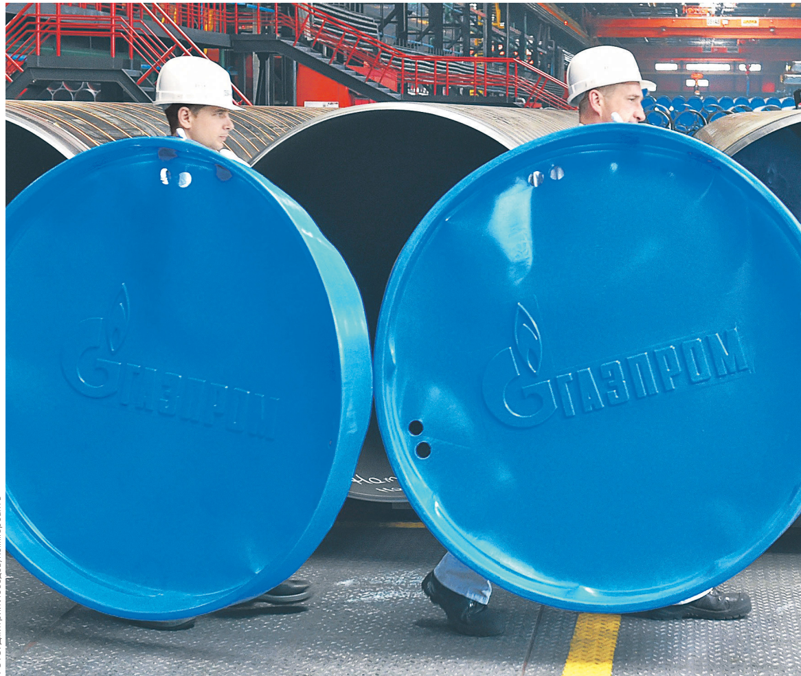
Заказы на промышленно-геофизические работы уходят сторонним компаниям, и, чтобы остаться на плаву, «Газпром георесурс» отказывается от всего, что является обузой, считает эксперт

В приказе отдельно оговаривается, что отмена корпоративных пенсий не коснется действующих и бывших сотрудников компании, за которых к концу июня 2018 года были перечислены пенсионные взносы или «возникли основания для их перечисления». Такие работники будут получать начисления в соответствии с пенсион-