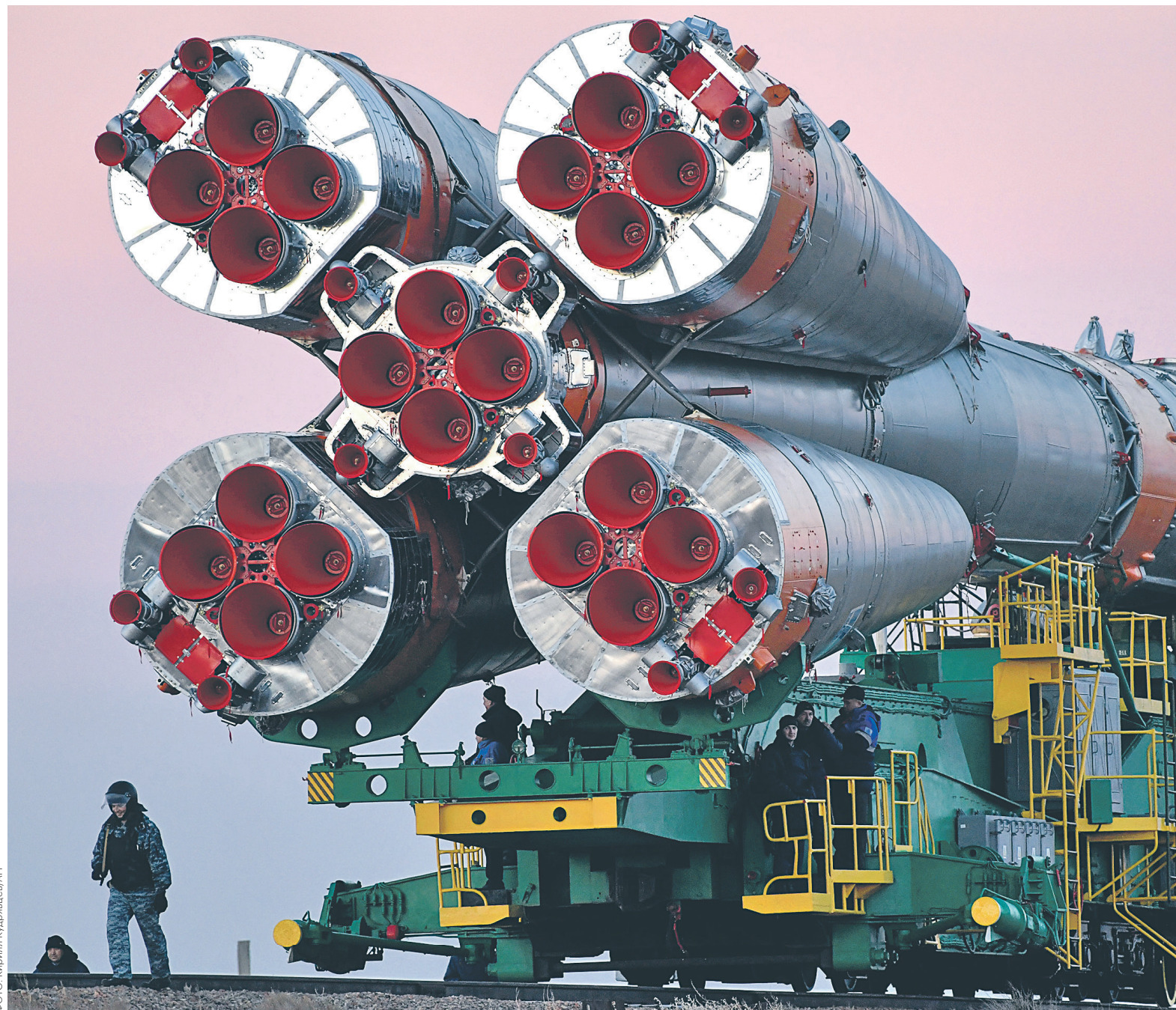
В российской космической отрасли Счетная палата обнаружила самые масштабные в 2017 году нарушения