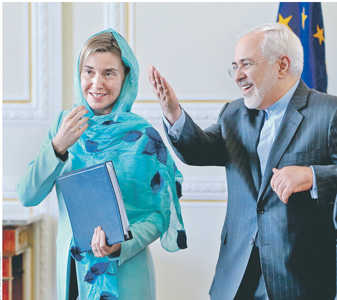
Глава Европейской службы внешних связей Федерика Могерини обсудила с министром иностранных дел Ирана Мохаммадом Джавадом Зарифом направления дальнейшего сотрудничества

Внутри ЕС Могерини пообещала скорое обсуждение дальнейших шагов на разных уровнях. Помимо саммита в Софии через неделю в Вене состоится встреча на уровне замминистров иностранных дел стран Евросоюза, а затем и на встрече глав МИД стран ЕС в Брюсселе 28 мая.