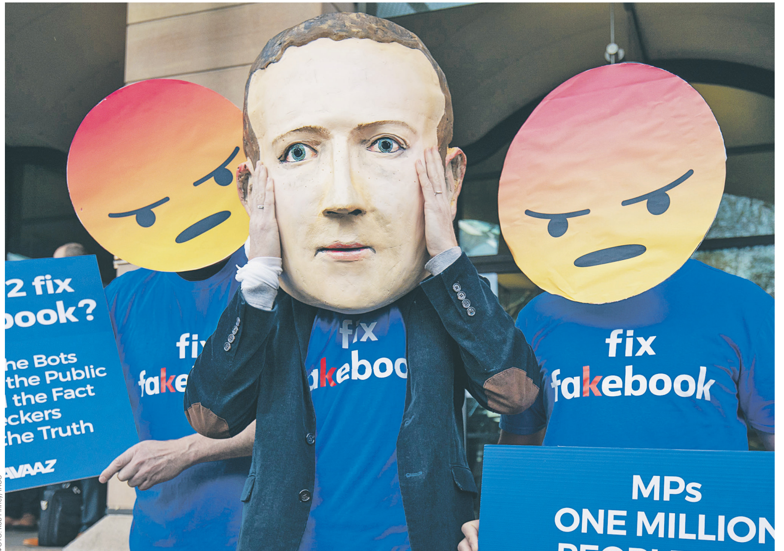
Проблема защиты персональных данных активно обсуждалась в этом году в связи со скандалом вокруг Facebook. На фото: акция протеста в Лондоне из-за утечки информации о пользователях соцсети

Опрошенные РБК эксперты считают, что публичный отказ от предоставления доступа к данным пользователей связан с желанием Mail.Ru Group избежать репутационных рисков. «Последние месяцы цифровая индустрия активно обсуждает законы, связанные с защитой персональных данных. В ближайшие дни в Европе всту-