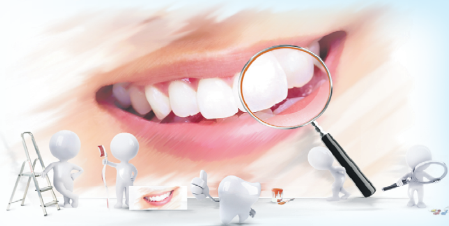
График работы с 9 до 21 ч.