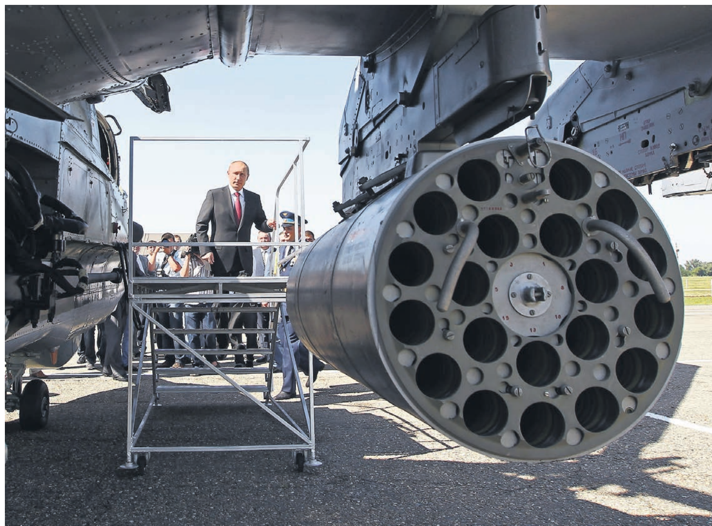
Рекордные $14 млрд, полученные Россией в 2012 году за реализацию экспортных контрактов, позволяют еще несколько лет не выпасть из обоймы мировых лидеров рынка вооружений.

В целом, по признанию источников «Ъ», работающих в российской системе ВТС, по сравнению с прошлым годом ситуация сильно не изменилась: общий портфель заказов по-прежнему составляет около