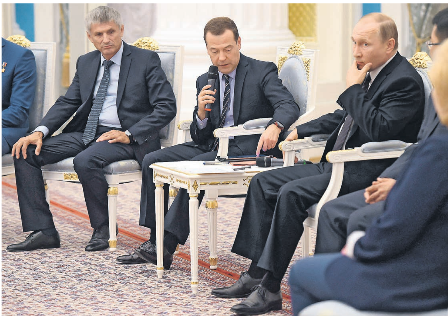
Владимир Путин и Дмитрий Медведев встретились с кандидатами в депутаты от «Единой России», которым надо на всякий случай помочь