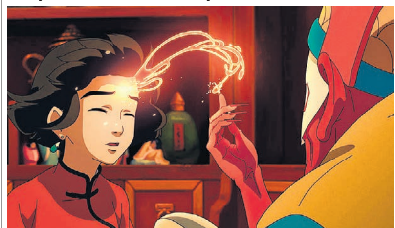
При всей своеобычности китайских мультипликаторов «По ту сторону океана» отчетливо напоминает фильмы Хаяо Миядзаки

Однако картина настолько красива, а фантазия авторов так безгранична, что потеряться в ее извивах — отдельное удовольствие. Придуманная ими фантастический мир очень яркий, подробный и населен множеством удивительных — и при этом совершенно индивидуальных — созданий. И хотя сравнения с фильмами Хаяо Миядзаки напрашиваются сами собой, у китайских аниматоров, безусловно, есть свое, ни на кого не похожее лицо. Их особенность проявляется и в отсутствии привычной нам в голливудских мультфильмах прямолинейной морали. «По ту сторону океана» — не столько сказка, сколько притча, сад расходящихся тропок. Нравительная история, прославляющая безграничное самопожертвование, оборачивается рассказом о красоте окружающего мира и умении ценить каждое прожитое мгновение, которое стоит того, чтобы хоть ненадолго забыть о западном рационализме.