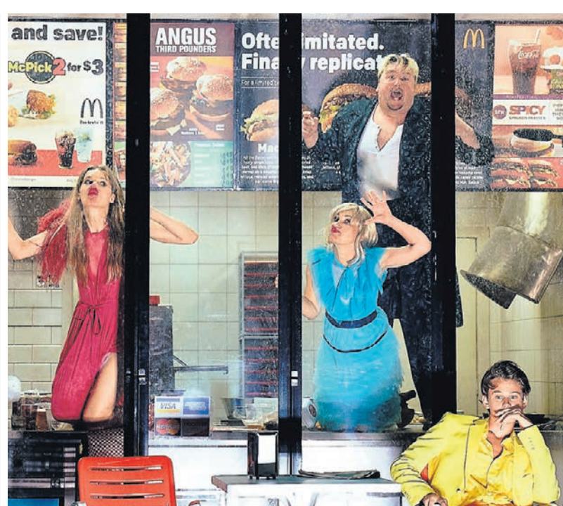
Мечты о насыщении получают в спектакле самое прямое и наглядное воплощение

Театральная программа Зальцбурга-2018 включает не только постановки, но и параллельную программу из докладов-исследований, кинопоказов и многочасовых чтений с участием таких звезд, как Бруно Ганц и Петер Симонишек. Но главным все же остаются спектакли, объединяющие пространство от античности до наших дней. Здесь и классики — «Перс» Эсхила и «Пентесilea» Клейста, и визитная карточка фестиваля «Имярек» Гофманстала (на этот раз с новой музыкой), и сценическая версия букероносного романа Давида Гроссмана «Заходит лошадь в бар». «Лошадь» покажут в бывшем кинотеатре, а вот для самой монументальной работы этого года, «Голода» в постановке Франка Касторфа, потребовались просторы бывшей солеварины в Халлаине.