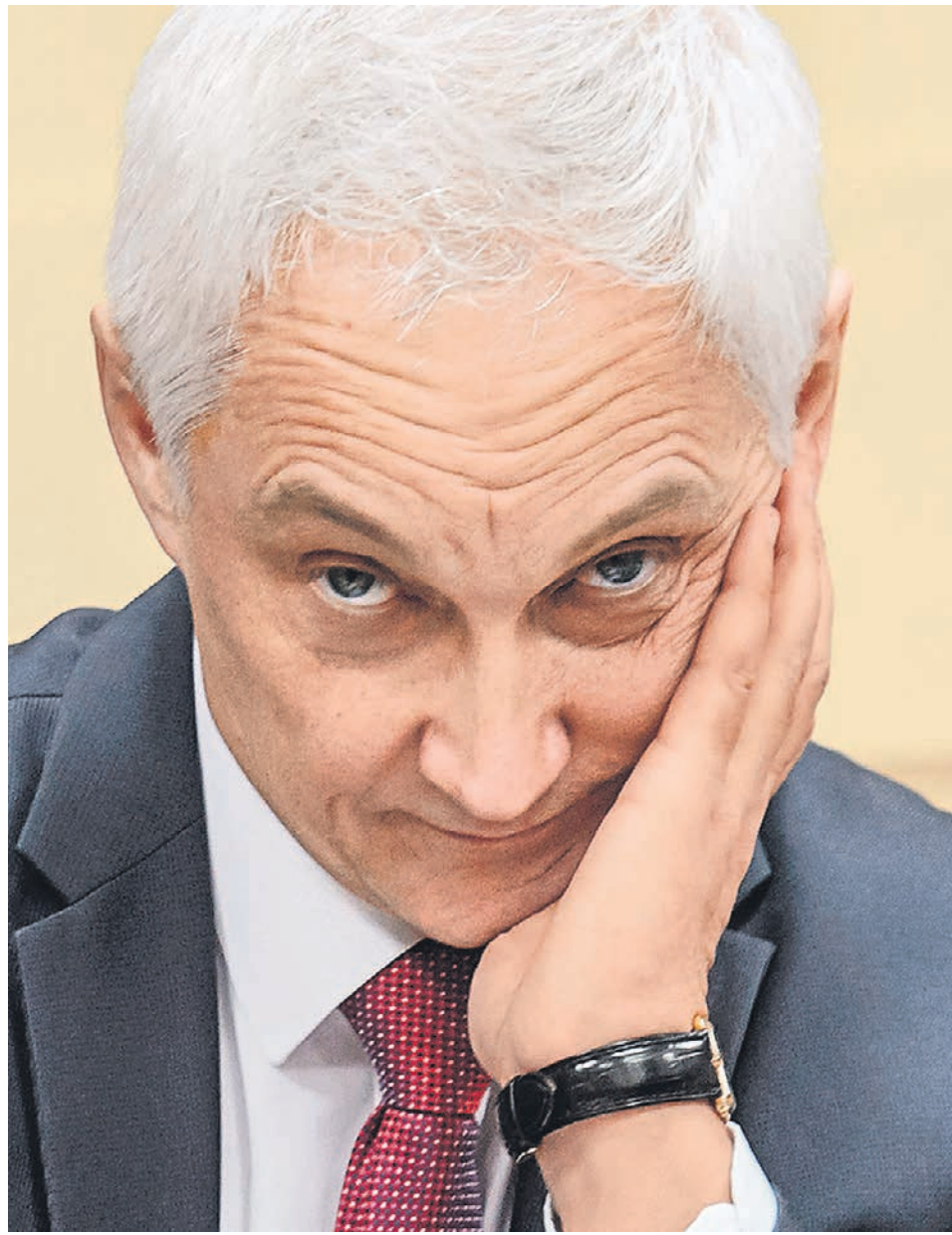
Помощник президента Андрей Белоусов смотрит на прибыли частного бизнеса как на удобный источник дополнительных доходов для бюджета

Андрей Белоусов ссылается на потребность бюджета в средствах для исполнения новых майских указов президента и приводит в пример ситуацию 2016 года, когда для наполнения госказны было принято решение по изъятию додоходов у нефтегазовых компаний. Это принесло за два года бюджету около 600 млрд руб. Сейчас, по мнению чиновника, из-за рыночной конъюнктуры в 2017 году металлургия и химия РФ суммарно получили более 1,5 трлн руб. ЕВТДА. Но налоговая нагрузка на них (отношение налогов без НДС и социальных платежей к выручке) лишь 7%, тогда как для нефтянки — 28%. «Выравнивание рентабельности» до уровня нефтегазовой отрасли при «условии сохранения инвестиционных возможностей», пишет господин