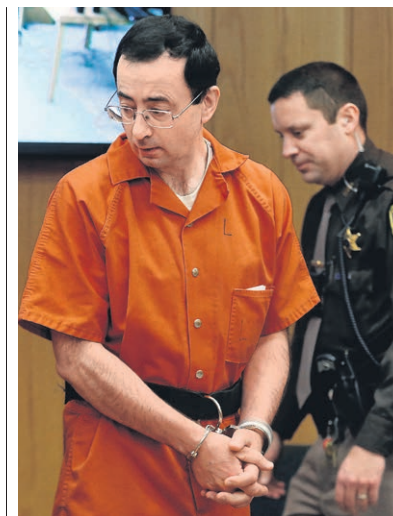
Через 40 лет Ларри Нассар, которому сейчас 55 лет, сможет подать прошение об условно-досрочном освобождении. Но даже если он и доживет до 95 лет, ему все равно придется досиживать 60-летний срок, назначенный ранее

Однако это было только начало расследования дела Нассара. Вскоре выяснилось, что за три десятка лет, в течение которых педофил имел отношение к спортивной медицине (с 1986 по 2016 год он работал одним из докторов Федерации гимнастики США), а также замещал должность остеопата в Университете Мичигана, он систематически совершал развратные действия в отношении гимнасток. Причем среди них были и настоящие звезды, такие как четырехкратная олимпийская чемпионка Симона Байлз. В общей слож-