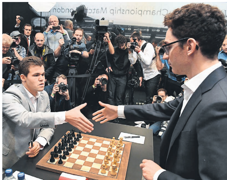
Совокупная аудитория матча между Магнусом Карлсеном и Фабиано Каруаной составила 1,9 млрд человек. Это примерно на 30% больше, чем в предыдущем поединке за титул чемпиона мира

Основные коммерческие показатели очередного матча за титул чемпиона мира по шахматам, который прошел в ноябре в Лондоне, довольно существенно превзошли показатели предыдущего поединка, а высокий спрос на премиальные трансляции позволил выплатить его участникам — норвежцу Магнусу Карлсену и американцу Фабиано Каруане — бонус в размере €60 тыс. в дополнение к гарантированным призовым. При этом в компании World Chess by Agon, организующей мероприятия в рамках чемпионского цикла, сообщили, что, учитывая вторую подряд всплеск интереса публики к тай-брейку, который закончился оба последних матча, в следующем сезоне будет проведено экспериментальное соревнование: в нем шахматисты будут играть в «телегеничном» формате с более жестким контролем времени.