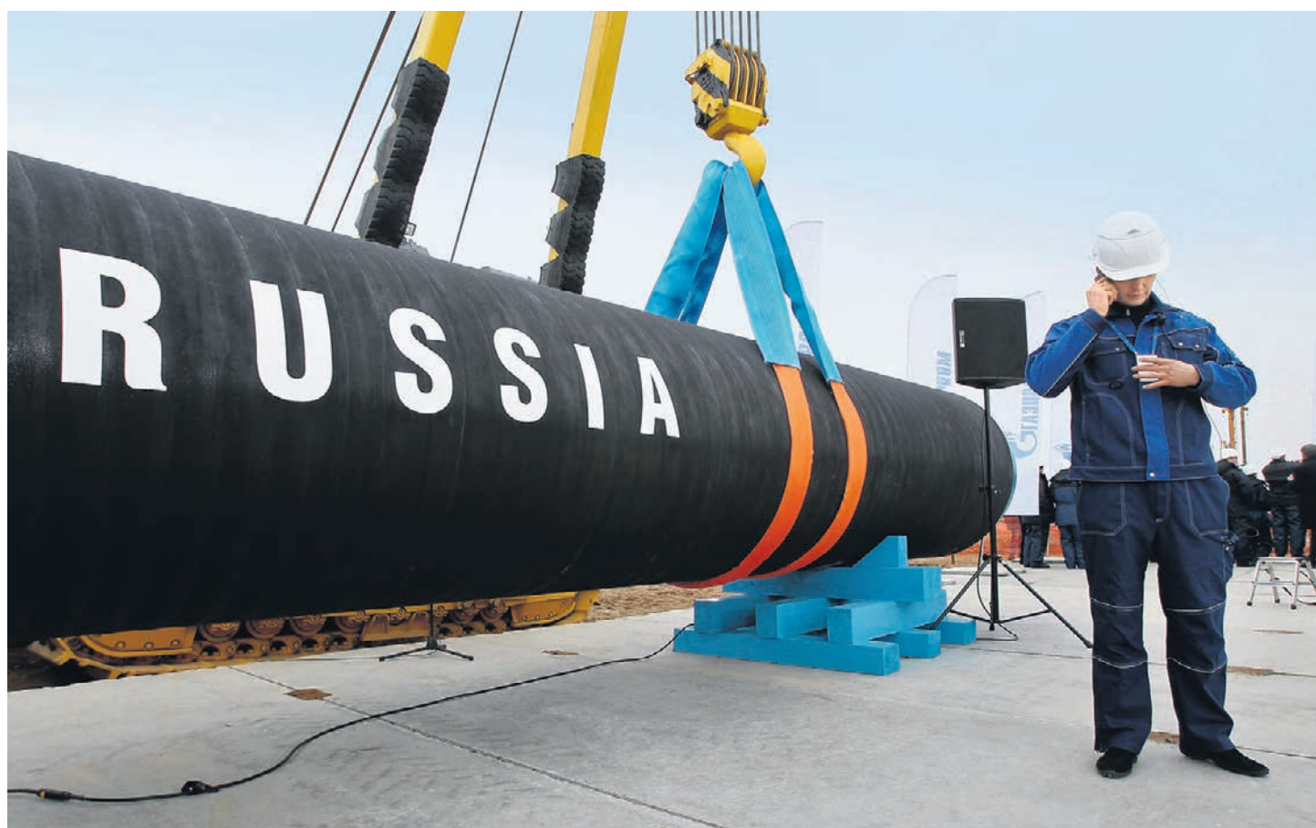
«Нафтогаз Украины» начал охоту за активами «Газпрома» в Европе. Первый удар нанесен по экспортным газопроводам