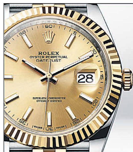
OYSTER PERPETUAL DATEJUST 41