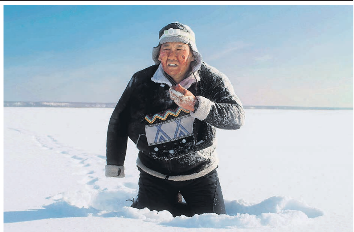
Якутские снежные просторы становятся в фильме победителем Степана Бурнашева сценой для черного, но нравочительного хоррора

Кроме того, «Черный снег» — это бескомпромиссно жанровое кино, причем в этой формулировке одинаково важны обе составляющие. Если то же «Пугало» называлось хоррором скорее формально, то картина Бурнашева — чистый образец жанра, причем той его разновидности, которая не предназначена для обла-