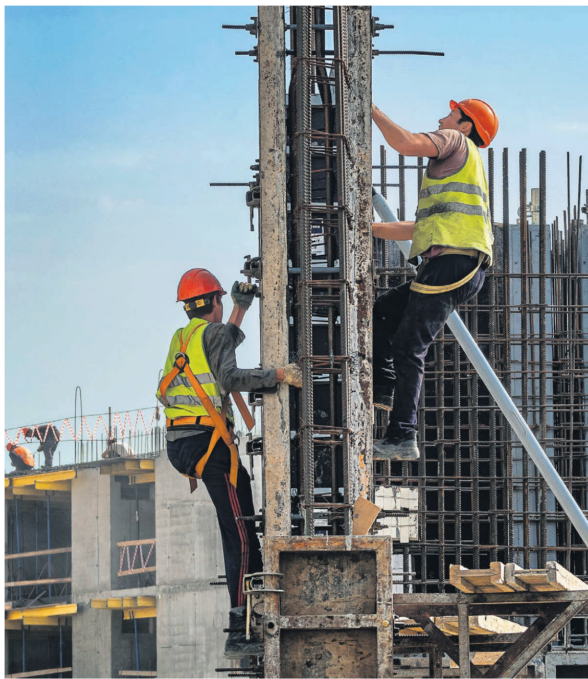
Повышение зарплат на российском строительном рынке не решило проблему дефицита рабочих рук из-за отъезда мигрантов из России.

Ранее Минстрой уже сообщал о желании наладить точечный въезд иностранных работников для больших компаний из крупных городов. Необходимость этого объясняется тем, что строительная