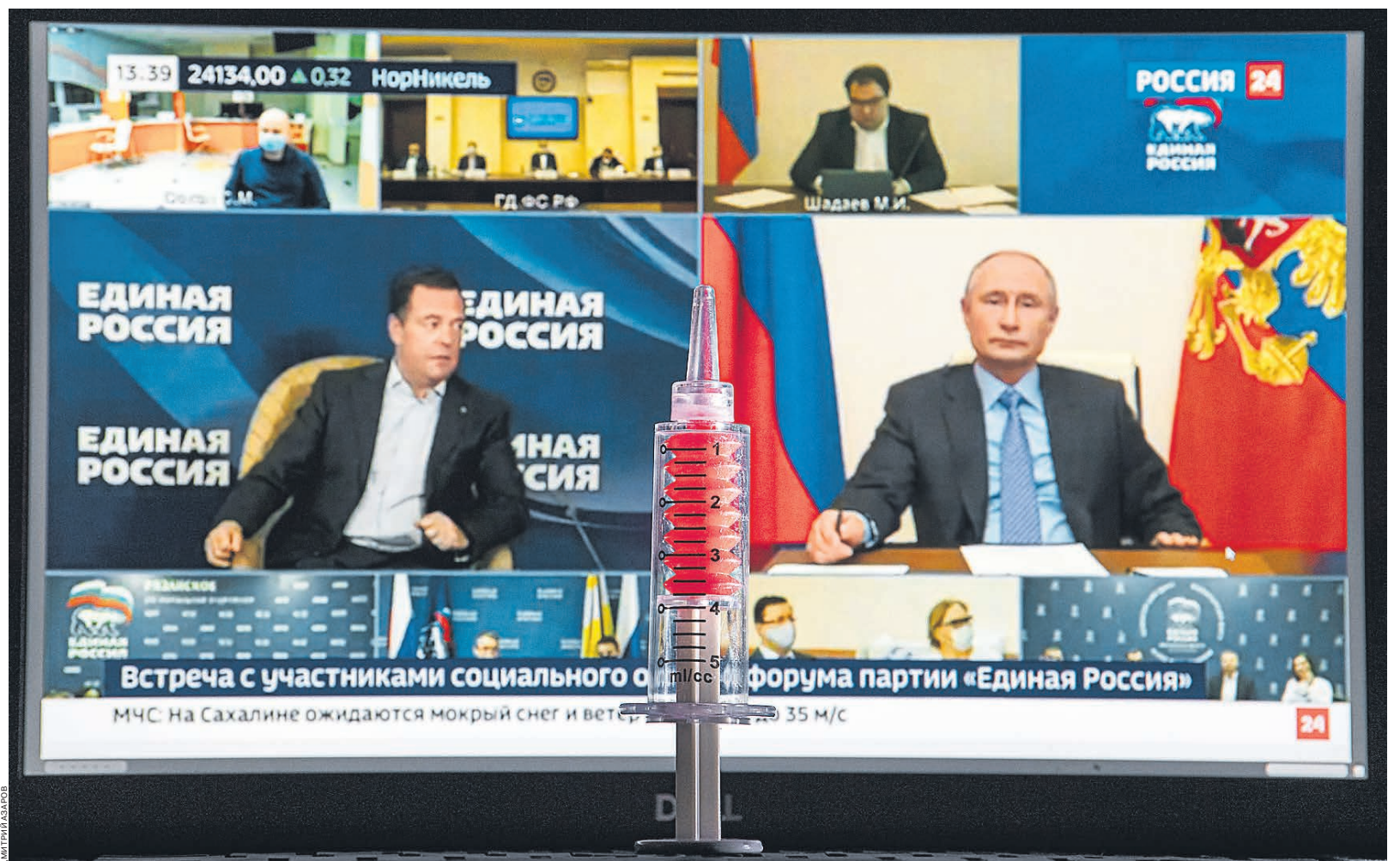
Встреча с волонтерами «Единой России» проходила под знаком борьбы с коронавирусом

Он выслушал еще двух волонтеров, и теперь никто, видимо, не сможет