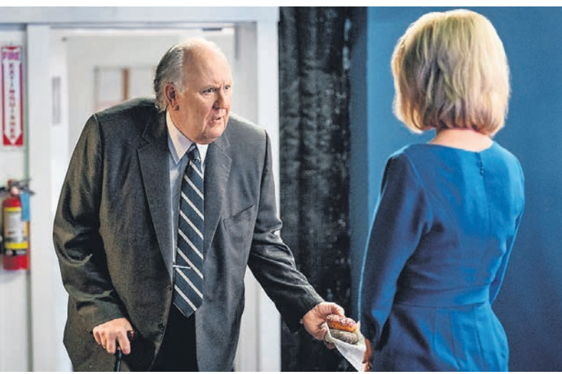
Никаких новых красок к негодяйскому образу медиамагната Роджера Айлза (Джон Литгоу) фильм добавить не в состоянии

В отличие от его истории события на Fox News не были присыпаны голливудской пылью и казались только американскими медийных персон, поэтому международного резонанса они не получили, хотя на родине прозвучали громко, а когда в 2019 году настало время рефлексии на тему #MeToo, вдохновили сразу нескольких творцов. На телеканале Showtime вышел мини-сериал «Самый громкий голос», в котором Айлза сыграл Рассел Кроу; потом видеосервис Apple TV+ представил сериал «Утреннее шоу» — историю вымышленную, но основанную на тех же событиях; и наконец, скандал на Fox News получил свое воплощение на большом экране силами оscarоносного сценариста Чарльза Рэндольфа и режиссера Джея Роуча, больше всего известного по фильмам про Остина Пауэрса и знакомств с Факерами.