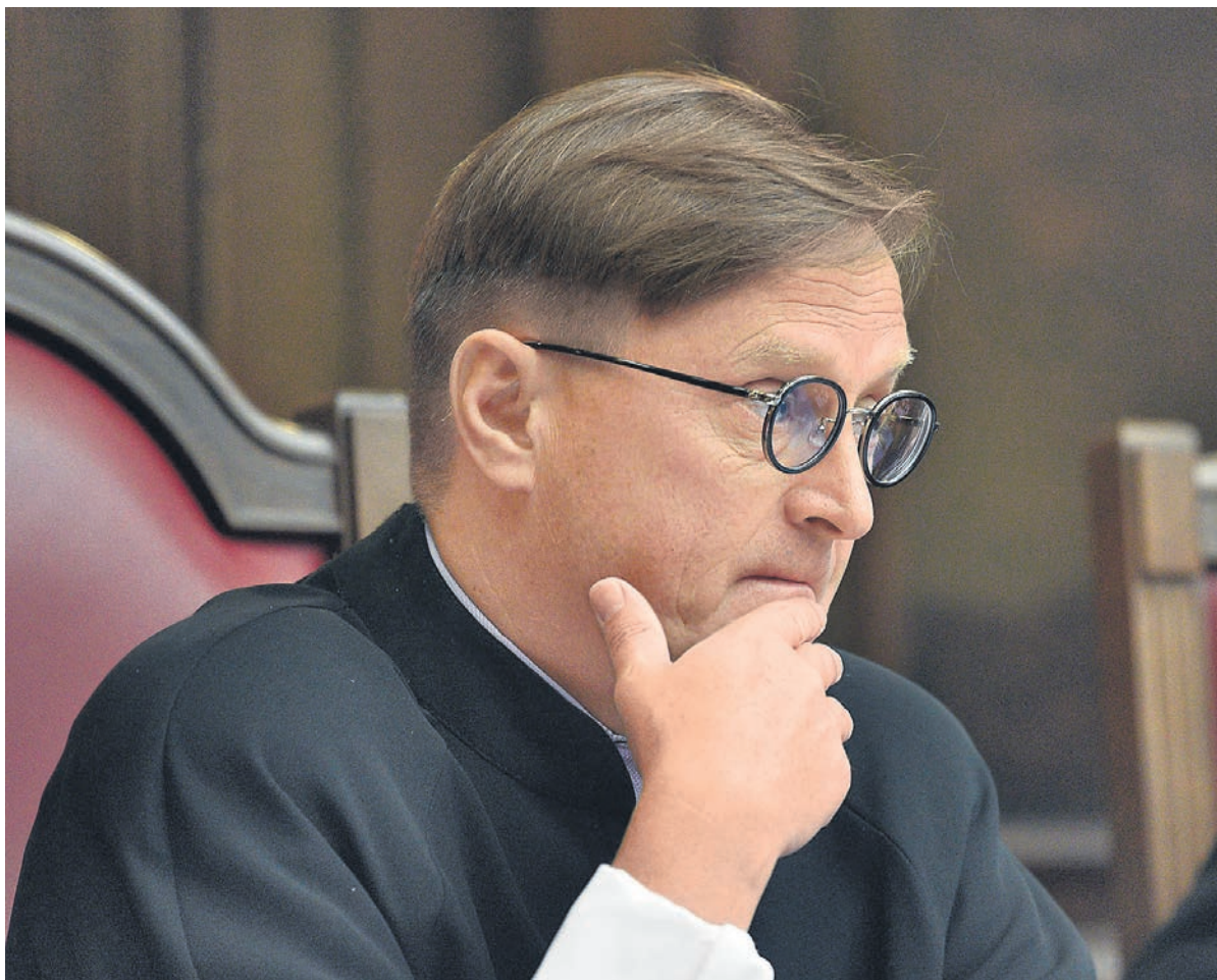
Судья КС Константин Арановский сравнил СССР с пироманом, а РФ — с пожарными

Судья Конституционного суда Константин Арановский назвал Советский Союз «незаконно созданным государством» и заявил, что Российская Федерация не должна считаться правопреемником «репрессивно-террористических деяний» советской власти. По его мнению, Россия должна обладать конституционным статусом государства, «непричастного к тоталитарным преступлениям».