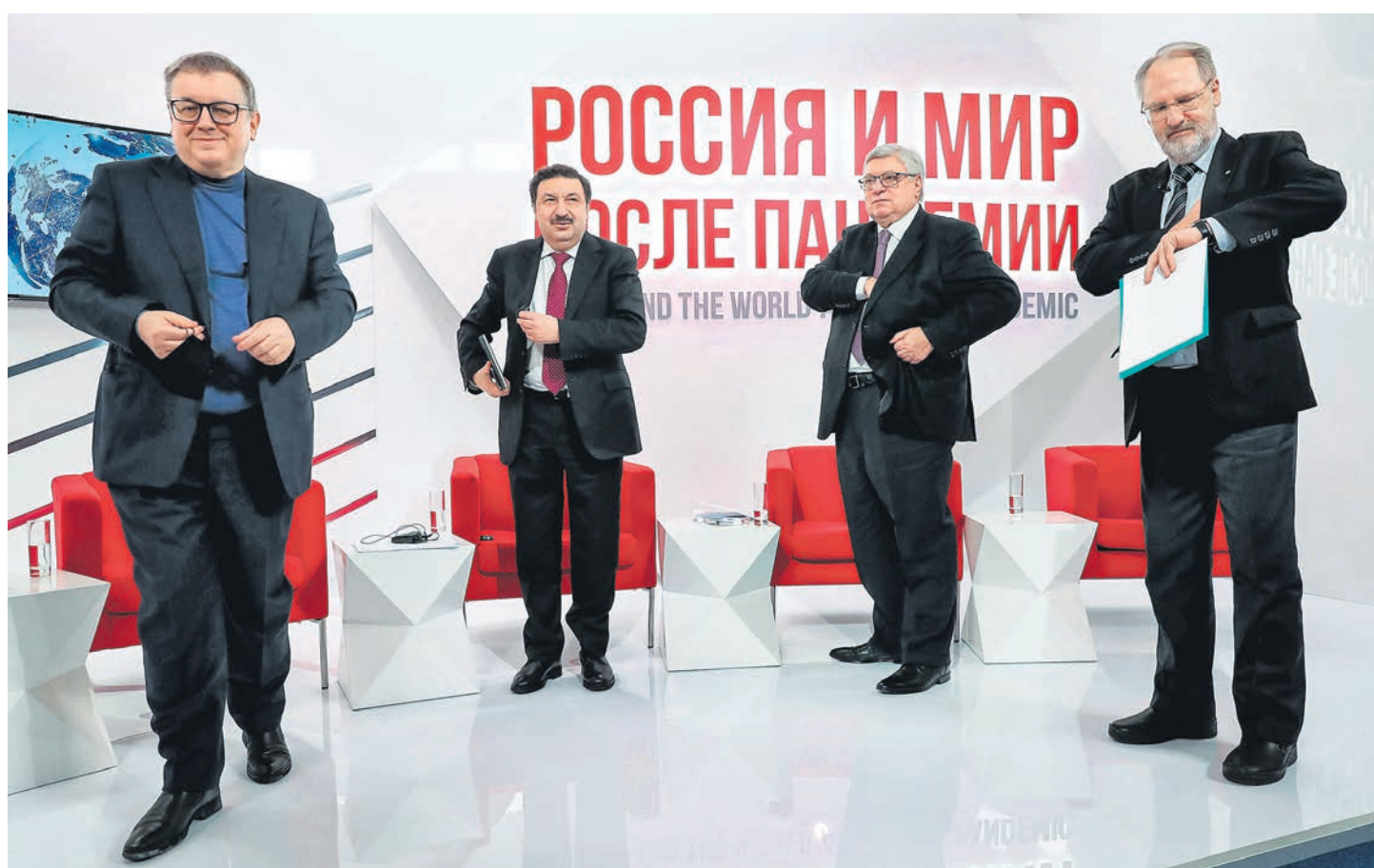
Ректоры трех университетов и директор института РАН на Гайдаровском форуме объявили о предоставлении социальным наукам в РФ статуса всемерно поддерживаемых государством

Форум открыл приветствиями президента Владимира Путина (кратко, письменно) и премьер-министра Михаила Мишустина (подробно, в видеозаписи). Глава правительства обратился к форуму с подробным сообщением о том, что с марта по декабрь 2020 года удалось сделать Белому дому: помимо борьбы с коронавирусом наиболее важное — широко представленная на форуме «цифровая трансформация» госвласти (см. стр. 2), в которой «цифровая» форма по существу вторична по отношению к консолидации государственного управления, его технологизации и способам администрирования, используемым в современном корпоративном управ-