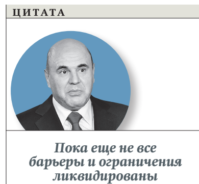
Пока еще не все барьеры и ограничения ликвидированы — Михаил Мишустин, премьер-министр РФ о кооперации в ЕАЭС, «Прайм», 30 апреля

В министерстве согласны, что возникшая ситуация «вступает в противоречие с правом ЕАЭС», поэтому, как сообщили там, «Ъ», совместно с Минфином РФ ведут переговоры с ЕЭК, властями Казахстана и Белоруссии о недопустимости двойного налогообложения. В правительстве РФ, Минфине Белоруссии и Минфине Казахстана, а также в ЕЭК на запросы, «Ъ» не ответили.