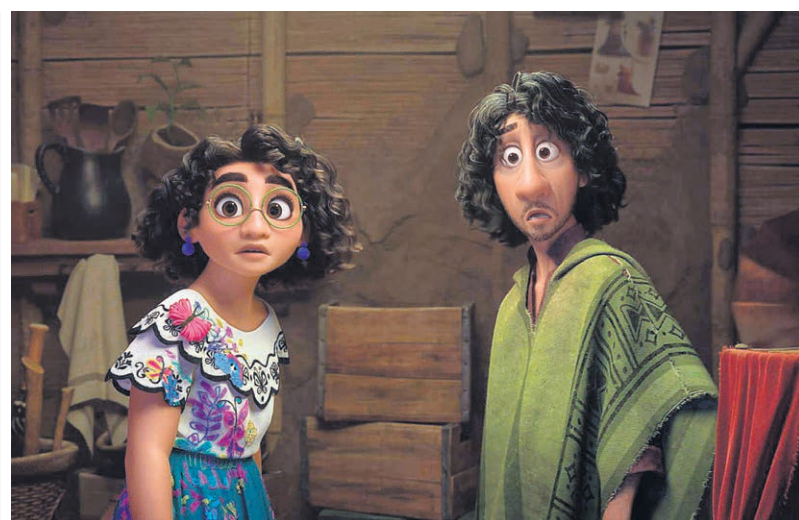
«Энканто» и его героям есть чем удивить зрителей.

Говорим «Колумбия» и «магия» — подразумеваем Габриэля Гарсиа Маркеса и его магический реализм. Переключка с произведениями колумбийского писателя очевидна, но «Энканто» — все же детский фильм. И еще это мюзикл. Автор песен Лин-Мануэль Миранда взялся за «Энканто» сразу после предыдущей работы в анимации — «Моаны». Параллельно композитор переживал феноменальный успех мюзикла «Гамльтон». В итоге в «Энканто» от мюзикла не только песни, но и сама форма повествования.