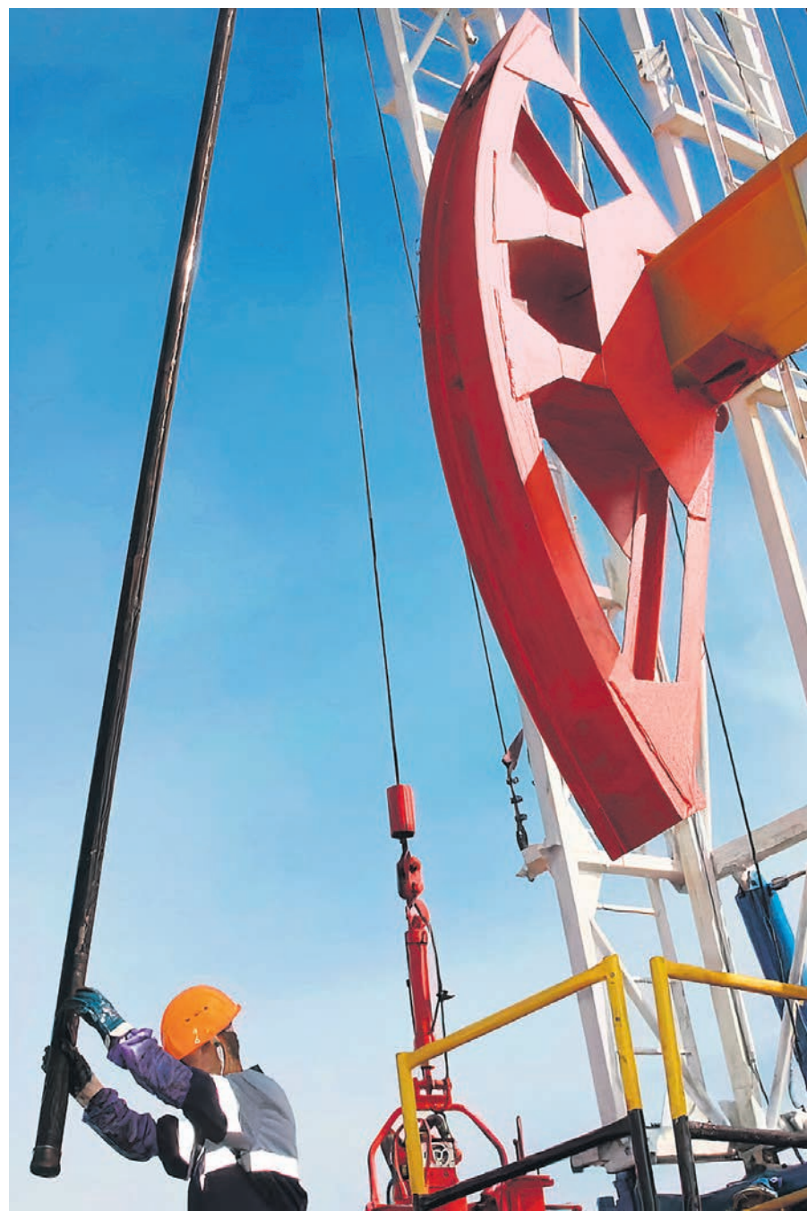
Российским нефтекомпаниям придется потрудиться, чтобы увеличить добычу в соответствии с ростом квоты по соглашению ОПЕК+

Сделка ОПЕК+ была возобновлена в мае 2020 года и подразумевала суммарное сокращение добычи ее участниками на 9,7 млн б/с. К настоящему моменту квота сократилась уже до 4 млн б/с. Участники сделки, согласно текущему графику, должны ежемесячно увеличивать производство на 400 тыс. б/с, чтобы в сентябре 2022 года полностью отказаться от сокращения добычи. При этом Россия и Сау-