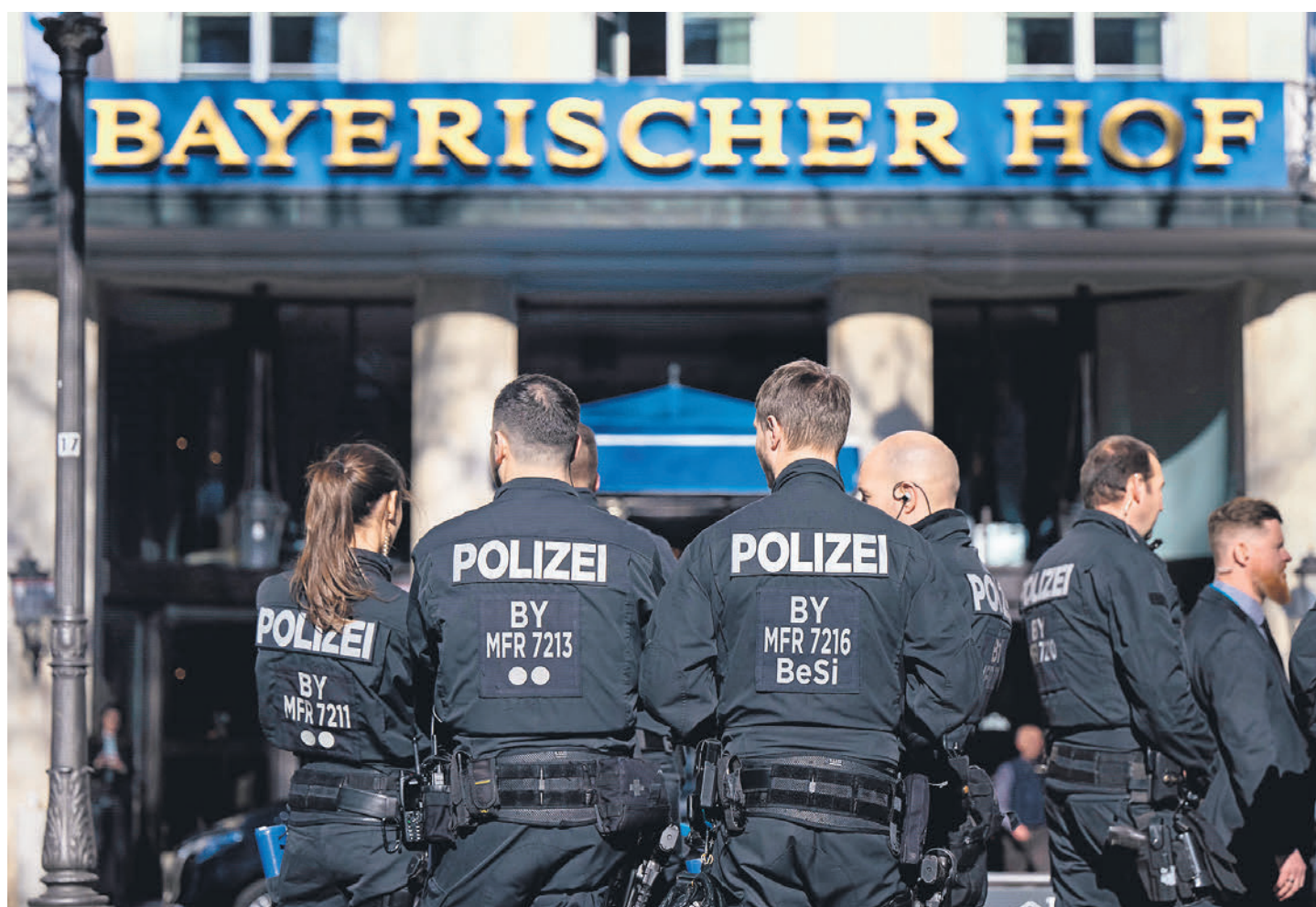
Мюнхенская конференция по безопасности, открывающаяся в пятницу в фешенебельном отеле Bayerischer Hof, пройдет без участия официальной делегации из России.

Российской официальной делегации в Мюнхене на сей раз не будет — ее не пригласили. По словам Кристофа Хойсгена, организаторы решили не предоставлять российским чиновникам «площадку для распространения пропаганды». Вместо это-