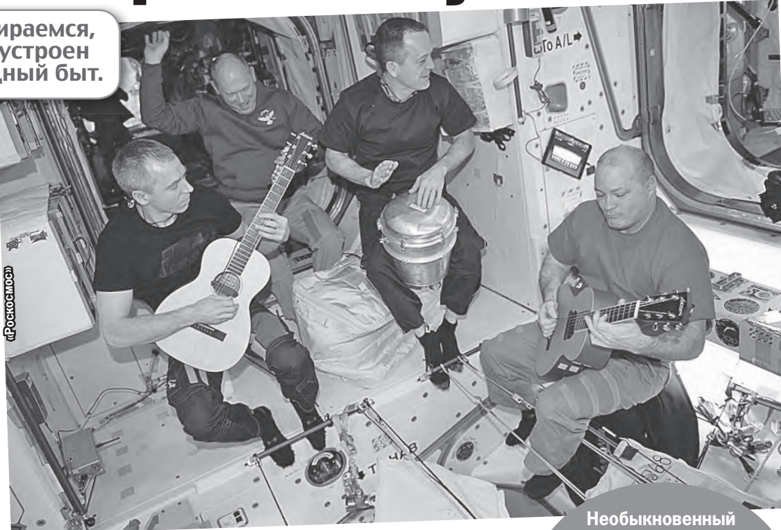
Необыкновенный концерт: на орбите выступают (слева направо) Дрю Фьюстел, Олег Артемьев, Рики Арнольд и Скотт Тингл.

Представьте - вы решили перекусить печенькой. Печенье хрустит, от него отделяется множество крошек. На Земле это не было бы проблемой - подмет - и порядок. А вот в космосе крошки могут попасть в дыхательные пути, в приборы, замкнуть какое-то реле или забиться в воздухопровод. Мелкие частицы на кораблях и станциях - большая беда. И все, что может их породить, находится под строжайшим запретом.