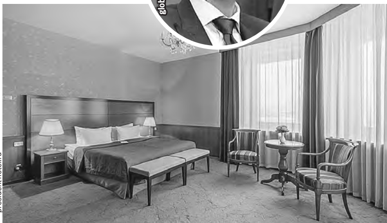
Башар Асад был одним из известных постояльцев «Президент-Отеля».