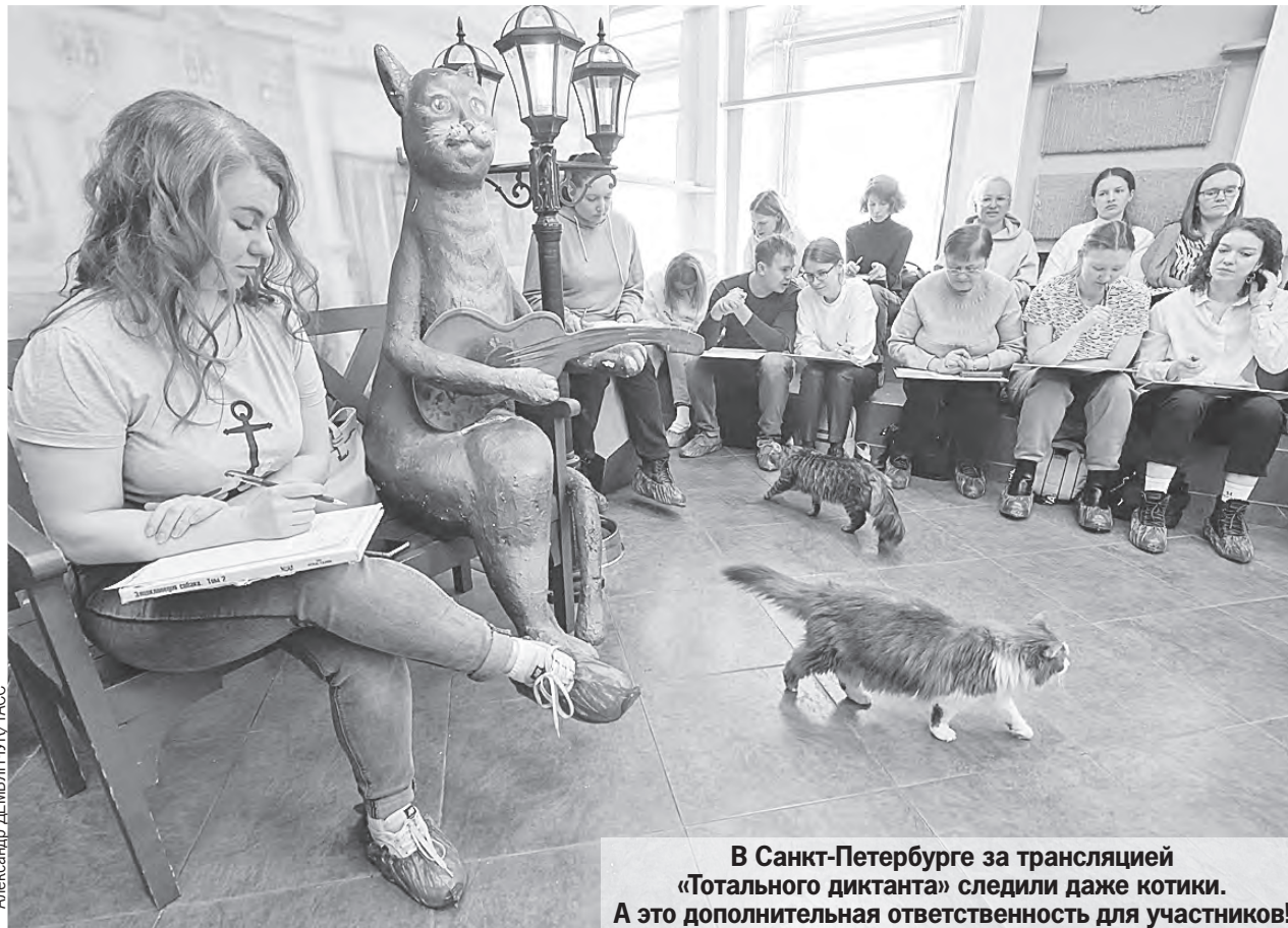
В Санкт-Петербурге за трансляцией «Тотального диктанта» следили даже коты. А это дополнительная ответственность для участников!