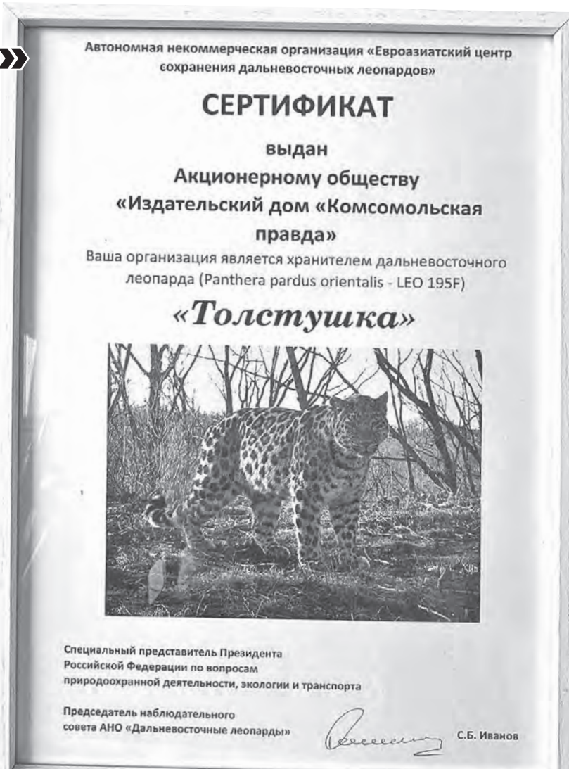
Официальный сертификат о том, что «КП» стала хранителем леопарда. На фото - та самая Толстушка.

«Комсомольская правда» будет внимательно следить за дальнейшей судьбой своей Толстушки и подробно рассказывать о ней в рубрике «Окно в природу», которое еженедельно выходит где? Ну естественно, в «толстушке»!