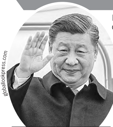
Си Цзиньпин жил в номере за 1 млн рублей в сутки.

Новострой у «Ботанического сада» открылся в прошлом году. Принадлежит бизнесу из Поднебесной. Все тут построено по фэн-шуй. В отеле жил председатель КНР Си Цзиньпин во время недавнего визита в Россию. Президентский люкс называется «Хуамин» (можно перевести как «символ Китая»).