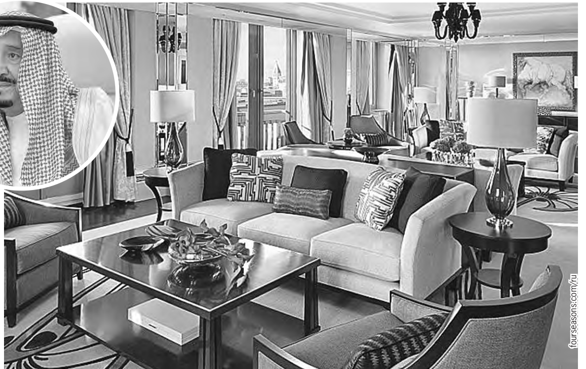
Ночь в люксе, где останавливался король Саудовской Аравии, стоит 1,9 млн рублей (на фото слева мраморное джакузи глубокого погружения).