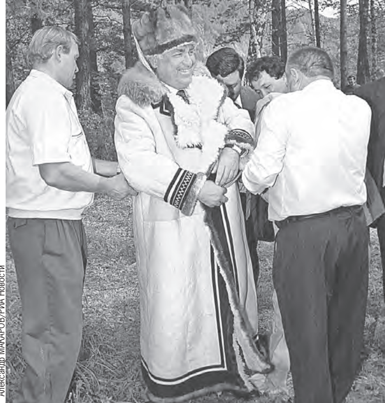
Александр МАКАРОВ/РИА Новости

- Нашлось бы много ненавистников, которые раскрутили бы это совершенно в другую сторону. Вот насколько вспоминаю, ни разговоров, ни мыслей таких у нас в семье не было. В кулуарах, в правительстве - не знаю. Но знаю из его же слов, что подходили, намекали: а почему бы и не воспользоваться. Да и страна была в таком хаосе - бери и иди дальше. Но тут - нет.