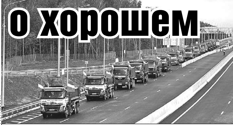
Названия у новой скоростной автомагистрали М-12 пока нет. Озвучивались различные варианты, например «Евразия», «Восток», «Казань».