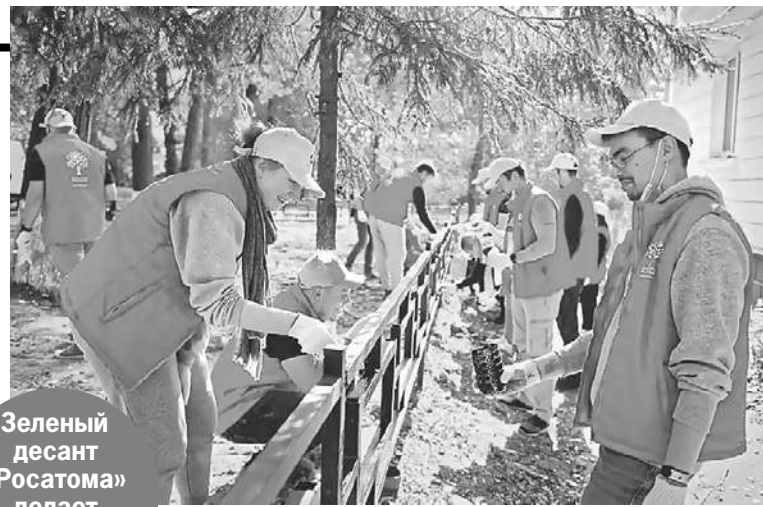
Зеленый десант «Росатома» делает природу чище.

«Росатом» реализует проекты в городах присутствия. В этом году к ним присоединился Энергодар, в котором располагается самая крупная в Европе атомная электростанция - Запорожская АЭС. Жители Энергодара переживают непростые времена, и семья «Росатом» решила их поддержать проведением марафона «Росатом вместе с Энергодаром». Так сотрудники Госкорпорации оказывают поддержку жителям