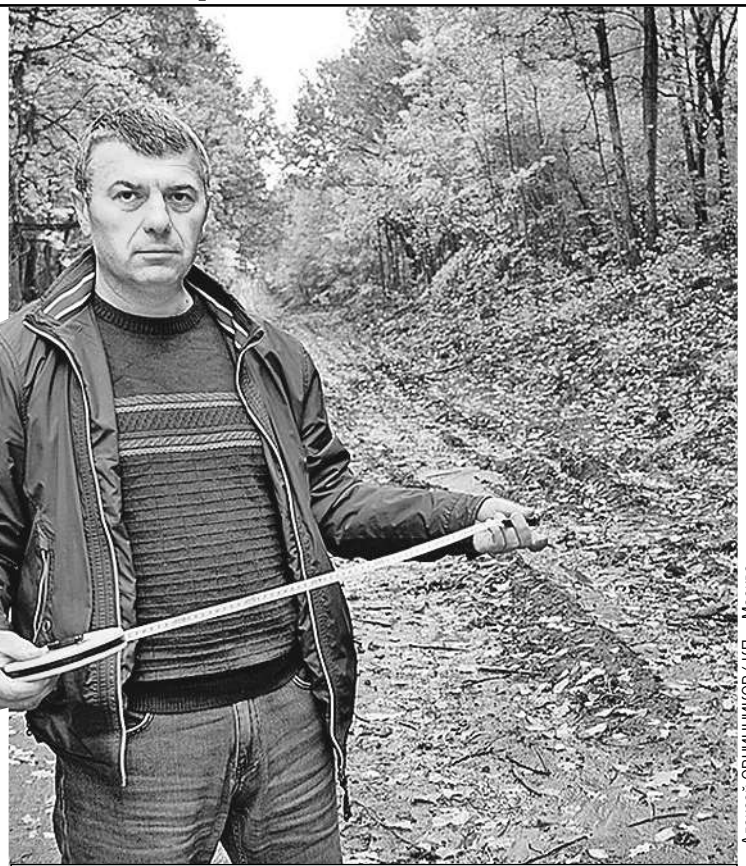
Алексей ОВЧИННИКОВ/«КП» - Москва

Дальше вообще интересно: спустя полгода после возбуждения дела следователи выяснили (даже съездив для этого в Москву) - несколько лет назад произошла какая-то техническая ошибка, ее исправили, и с ноября 2021-го это уже не дорога, а лесной квартал.