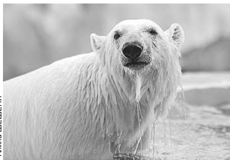
Медведицу Хатангу нашли на Северной Земле истощенным медвежонком. Теперь она живет в новом вольере в Екатеринбургском зоопарке.

будут проходить масштабные фестивали, выставочные проекты и театральные премьеры. А вот программу самого Дня города пока держат в секрете. Но без концертов, спектаклей и мультимедийных инсталляций точно не обойдется.