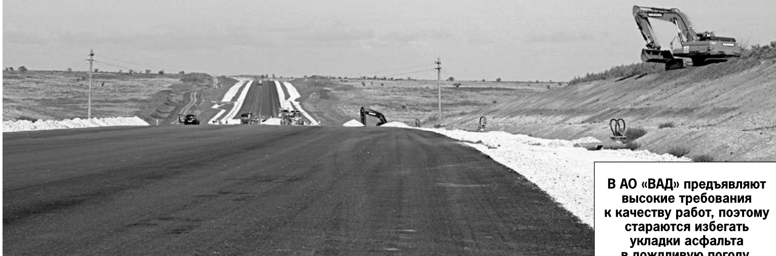
Пресс-служба АО «ВАД». На правах рекламы.

Проводить дорожные работы можно и в холодное время года. Но соблюдая определенные условия.