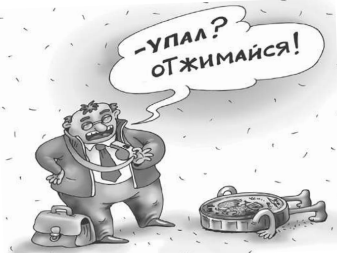
Катерина МАРТИНОВИЧУ «КП» - Москва

Иностранцами деньгами затариваются не только импортеры. На бирже выросла доля частных. Многие из них покупают валюту на бирже, переводят себе в российские банки, а оттуда - на свои заграничные счета. Финансовые власти нынче в хорошем настроении: простым россиянам Центробанк позволяет переводить на заграничные счета до $1 млн в месяц.