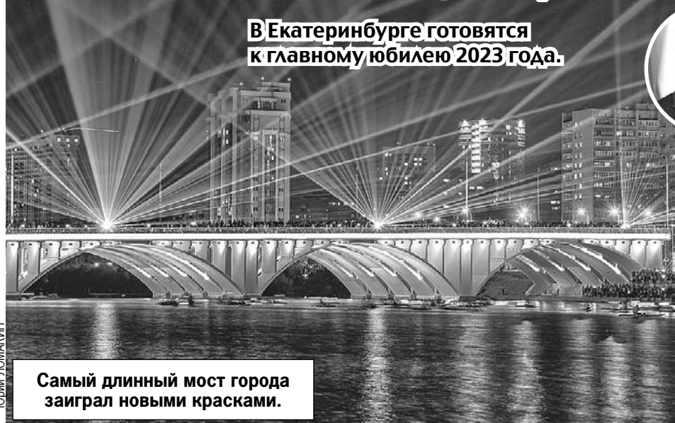
Самый длинный мост города заиграл новыми красками.

В Екатеринбурге готовятся к главному юбилею 2023 года.