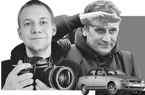
Владимир ВОРОБИН (текст)

Продолжение. Начало в предыдущих номерах «КП» и на сайте KP.RU.