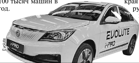
Седан Evolute i-PRO. Владельцы электрокаров в РФ получают право не платить за платные городские паркинги.

В Липецкой области начали сборку российских электрокаров Evolute. Первая модель - седан - называется i-PRO. В ней 163-сильный мотор и аккумулятор с запасом хода на 420 км. Запланирована сборка кроссоверов i-JOY и минивэнов i-VAN. Расчетная мощность завода свыше 100 тысяч машин в год.