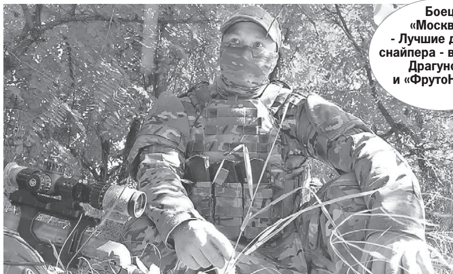
Дмитрий СТЕШИН/«КП» - Москва

Когда я подъехал, снайпер с позывным «Москва» уже был с ног до головы в «упаковке». Судя по СВД (снайперская винтовка Драгунова. - Ред.), он собирался не на охоту. Для охоты у него другое устройство калибра 12,7 и длиной метра три. Я угадал: