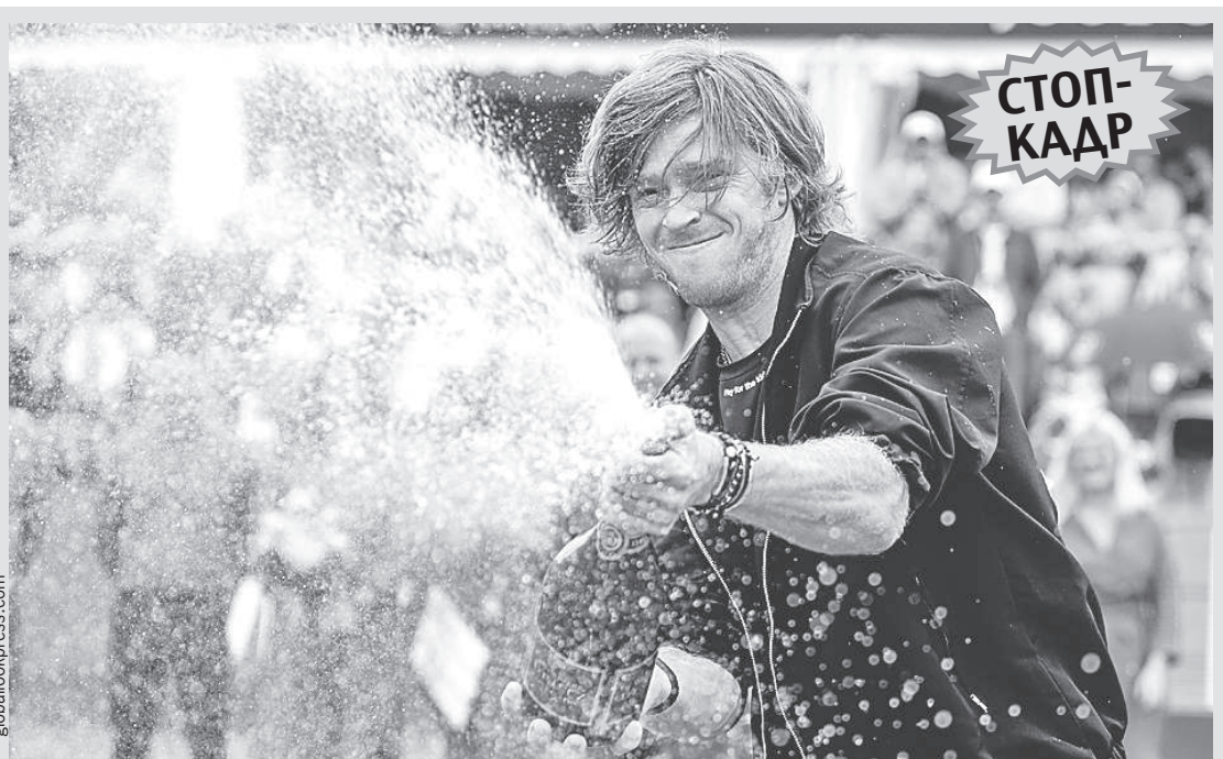
Уже привычная картина от Андрея Рублева . Российский теннисист победил на грунтовом турнире АТР-250 в шведском Бостаде и отпраздновал свой второй титул в сезоне (после «Мастерса» в Монте-Карло) и 14-й в карьере. В финале Рублев на этот раз переиграл 4-ю ракетку мира норвежца Каспера Рууда , но сам остался на 7-м месте в мировом рейтинге.