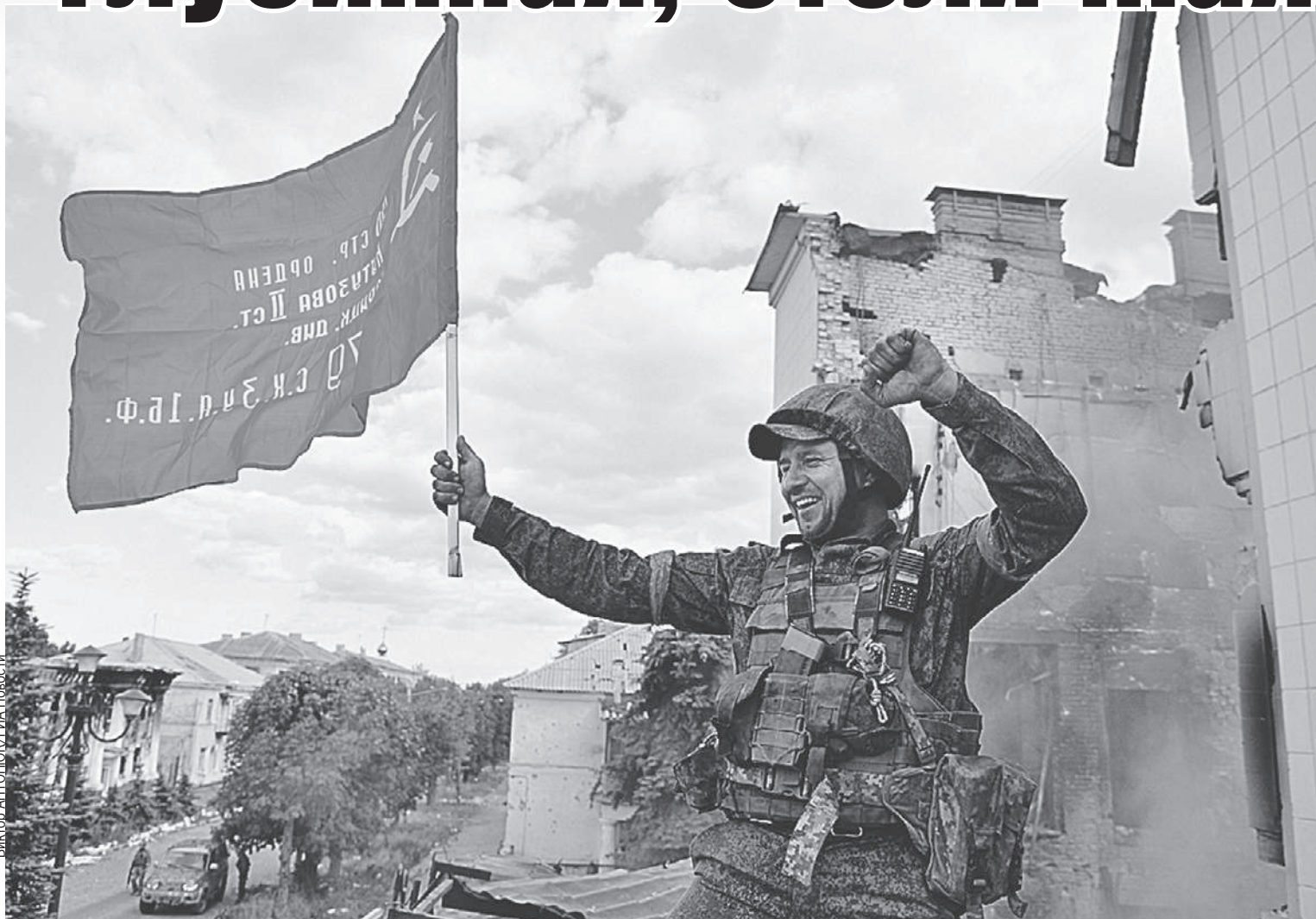
За то, чтобы страна сражалась до победы, выступают больше 70% россиян. Но ехать в зону СВО готовы лишь 15% пассионариев.

- Так называемая «воюющая Россия», или «победная», желающая сражаться до полной победы, - не самая большая часть нашего общества, 12 - 15 процентов.