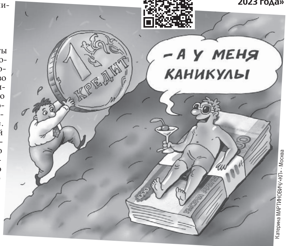
Катерина МАРТИНОВИЧУ «КП» - Москва

✓ Клиент может увеличить срок кредита и тем самым понизить ежемесячный платеж. ✓ Заемщик может снизить ставку, если обратится в другой банк, который дает более выгодные условия. И тот захочет переманить клиента к себе. В отличие от «каникул по закону», обязательств идти навстречу заемщику ни у одного из банков нет. Но это происходит все чаще, отмечают в ЦБ.