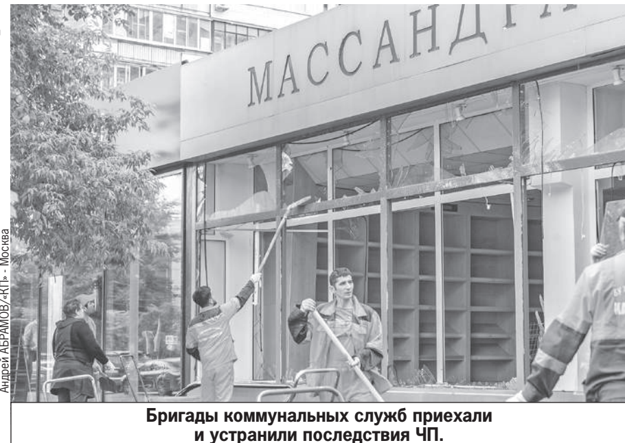
Бригады коммунальных служб приехали и устранили последствия ЧП.

Дом на Комсомольском проспекте находится в 300 метрах от главного здания Минобороны на Фрунзенской набережной. А подавленный сред-