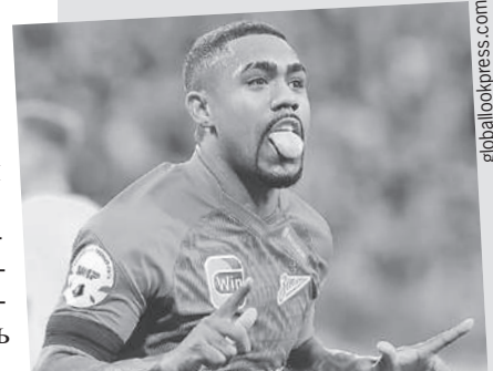
Малкому предложили трехлетний контракт с зарплатой 18 млн евро в год.

Кстати, эта сделка «Зенита» с саудитами войдет в топ-10 самых дорогих трансферов этого лета. Лидером списка является Деклан Райс , перешедший из «Вест Хэма Юнайтед» в «Арсенал» за 116 млн евро.