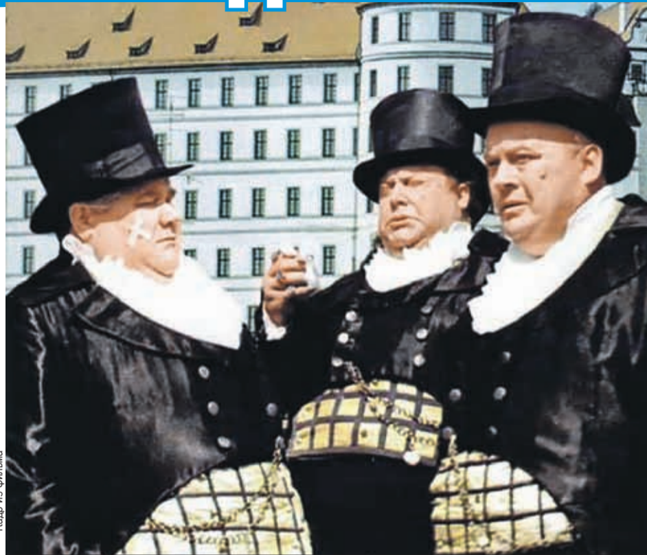
У героев фильма «Три толстяка» проблем с одеждой не было - как-никак олигархи. Простым людям сложнее.

Производители одежды признаются, что одежда больших размеров почти всегда продается хуже, чем обычная. Непроданные остатки от-