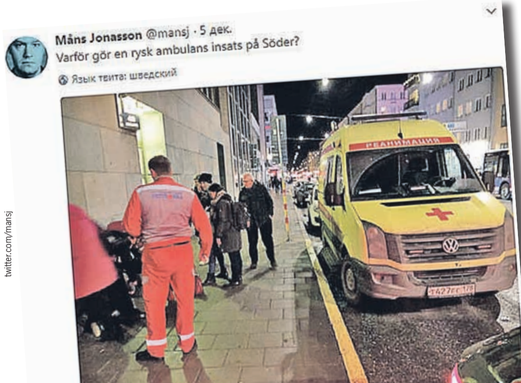
Måns Jonasson @mansj · 5 дек. Varför gör en rysk ambulans insats på Söder? Язык текста: шведский