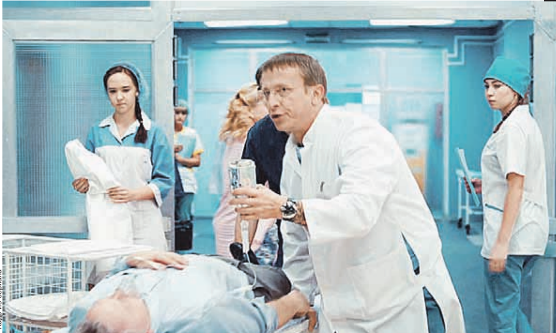
Зав. терапевтическим отделением в сериале «Интерны» Быков в исполнении Ивана Охлобыстина циничен, суров, но справедлив. Он может третировать подчиненных, но ради пациентов.

но и вежливо! Или мы постепенно приближаемся к «цивилизованному Западу», который так любим приводить в пример: «Уж там-то медицина, там к людям относятся по-человечески!» При этом мы не берем в расчет, что на Западе медицина - это просто услуга, как и любая другая, без всяких сантиментов. Нет медполиса? Платите кругленькую сумму или всего хорошего, лечитесь сами! В лучших европейских странах все по расписанию. Автобусы ходят минута в минуту, доктора работают минута в минуту. Положен прием 5 минут - значит, 5 минут. Пришла я тут в одну платную российскую клинику. На ее сайте было написано - европейское качество, лучшие специалисты. Врач уделил мне чуть больше положенного времени, так в кабинет вошла администратор: «Доктор, вы должны закончить,