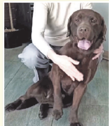
Скрин с видео питомника К-9