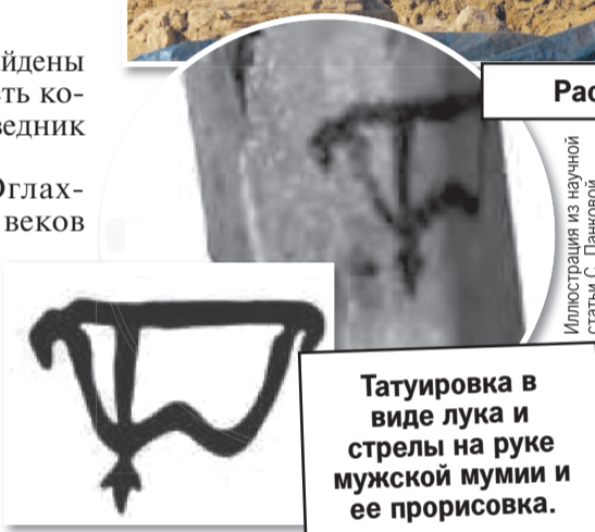
Татуировка в виде лука и стрелы на руке мужской мумии и ее прорисовка.

Иллюстрация из научной статьи С. Панковой