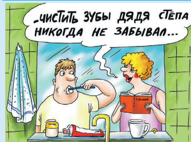
Катерина МАРТИНОВИЧ/«КП» - Москва

Исполнилось 110 лет со дня рождения прекрасного детского поэта и автора гимнов сначала СССР, а потом и России, и мы спросили: