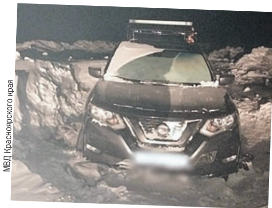
МВД Красноярского края