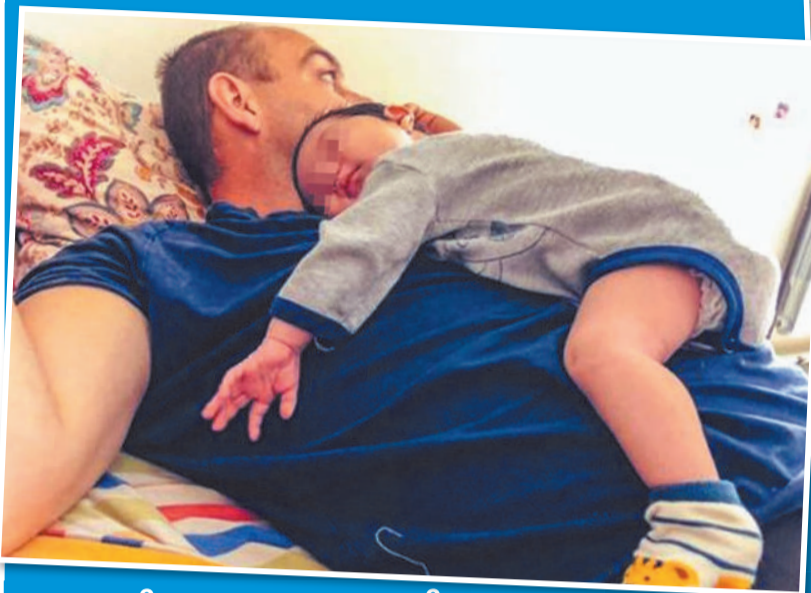
За несколько месяцев Зао полюбила вся семья.