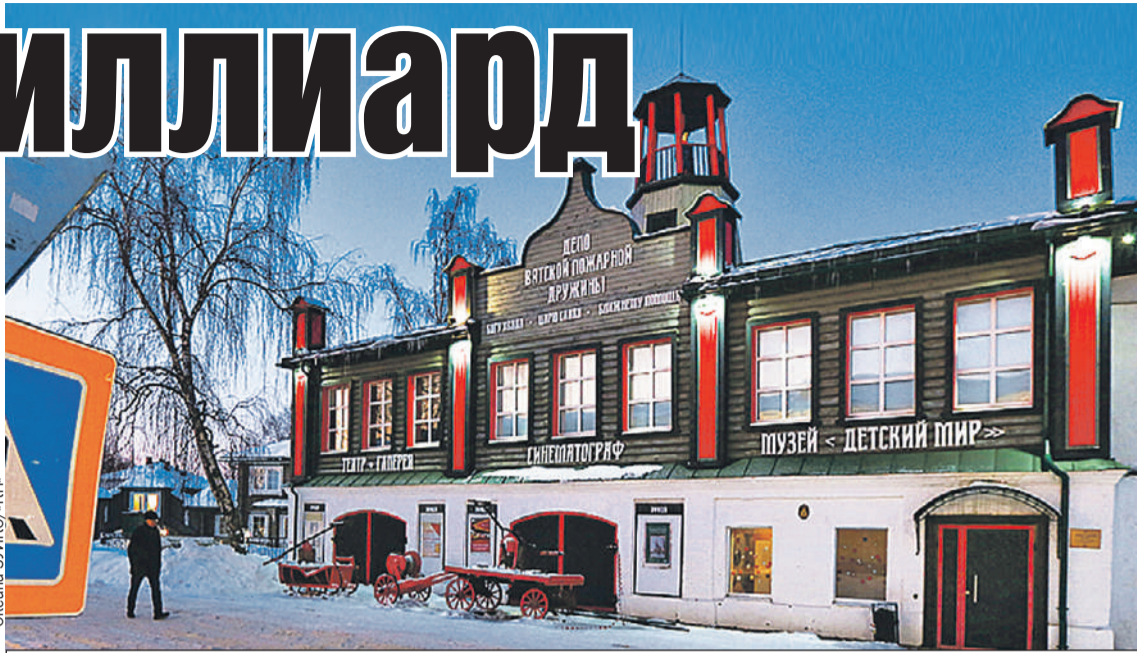
Вятское - изящный уголок старинной России с туристическим уклоном. Вот, например, фасад бывшего здания пожарной части. Сейчас здесь музей и киноконцертный зал.