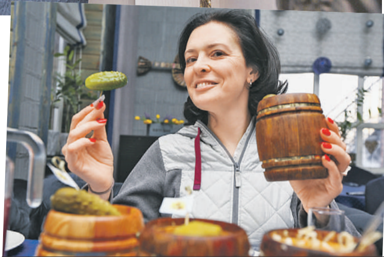
Оксана ЗУЙКО/«КП» - Москва

- В первую же крещенскую ночь окунуться в купели приехали тысяча человек со всей округи. А еще через год - 5 тысяч, - рассказывает Олег.