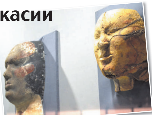
Национальный музей Республики Хакасия