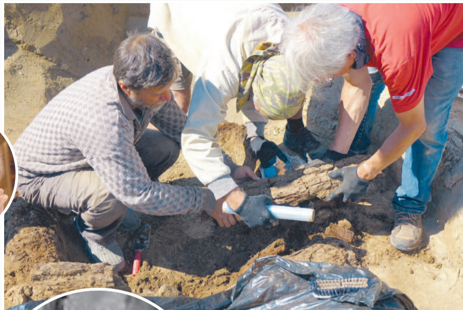
Раскопки на Оглахтах продолжаются.