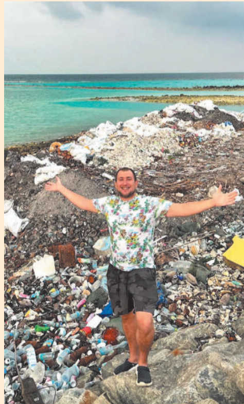
Новосибирский блогер показал настоящие Мальдивы - оказалось, остров тонет в мусоре.

Такую сторону Мальдив мало кто показывает. Обычно интернет пестрит фотографиями невероятной красоты природы и океана бирюзового цвета. Но, похоже, с экологией в этом райском уголке проблемы.