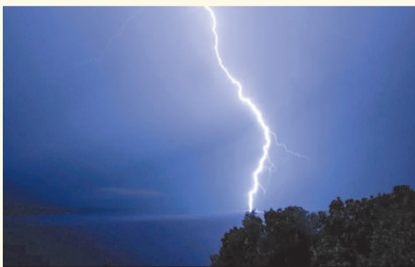
Система грозопеленгации ускорит поиск лесных пожаров в Иркутской области.

В Иркутской области система грозопеленгации ускорит поиск лесных пожаров. Обнаруживать лесные пожары на ранней стадии, тем самым не допуская увеличения площади горящей тайги, этой весной в Приангарье будут при помощи грозопеленгаторов. Систему грозопеленгации для нашего региона разработали ученые Института солнечной-земной физики Сибирского отделения Российской академии наук и сотрудники Ир-