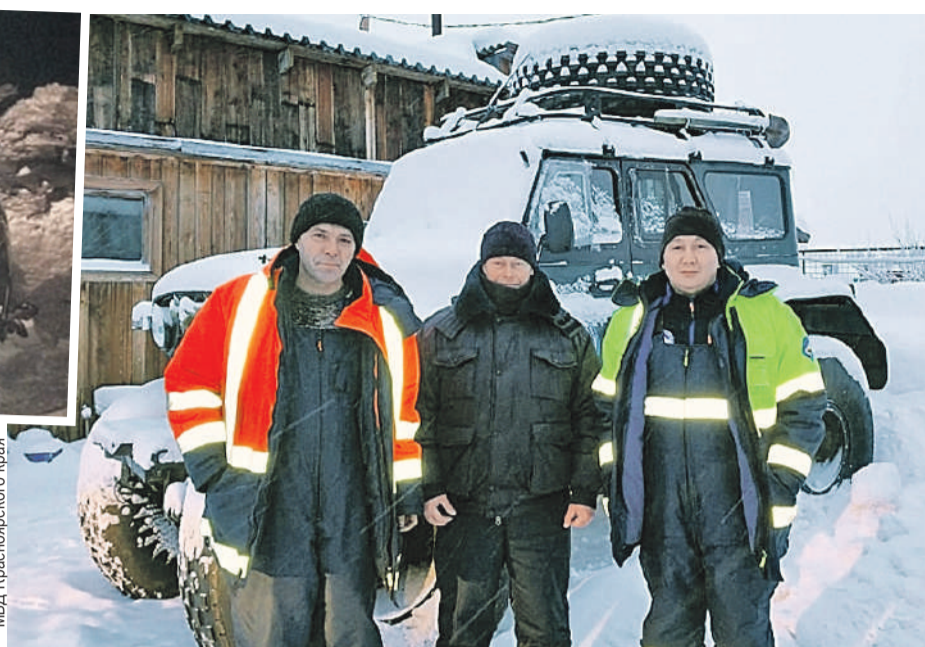
МВД Красноярского края