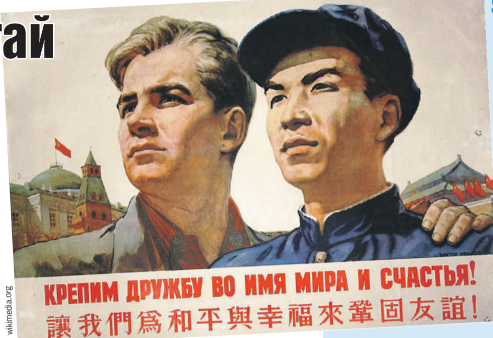
Плакат 50-х годов прошлого века становится актуальным и в наши дни.

Тон нынешнему визиту зададут статьи Путина и Си, которые опубликованы в «Российской газете» и «Жэньминь жибао». В них оценивается уровень отношений наших стран, ставятся задачи на ближайшую перспективу. Все три дня пребывания китайского гостя в Москве будут посвящены переговорам на различных уровнях. Начнутся они с личной беседы глав государств, которая, как ожидается, займет продолжительное время. Как сообщил помощник Президента РФ по международным вопросам Юрий Ушаков, серьезное внимание в ходе контактов планируется уделить вопросам энергетики и военно-технического сотрудничества. Состо-