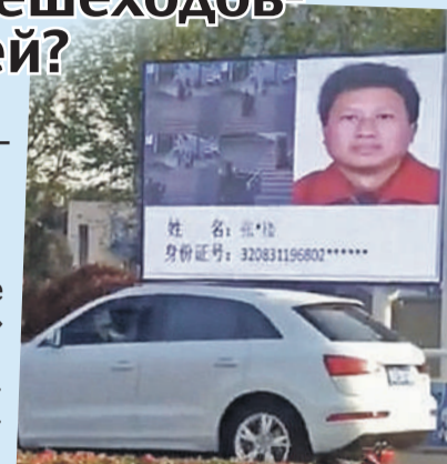
Перед автоматическими камерами наблюдения все равны. Нарушил - добро пожаловать на доску позора.

Да и «автонаказание за переход на красный свет» не новость: еще в 2017 году об этом китайском почине писали западные