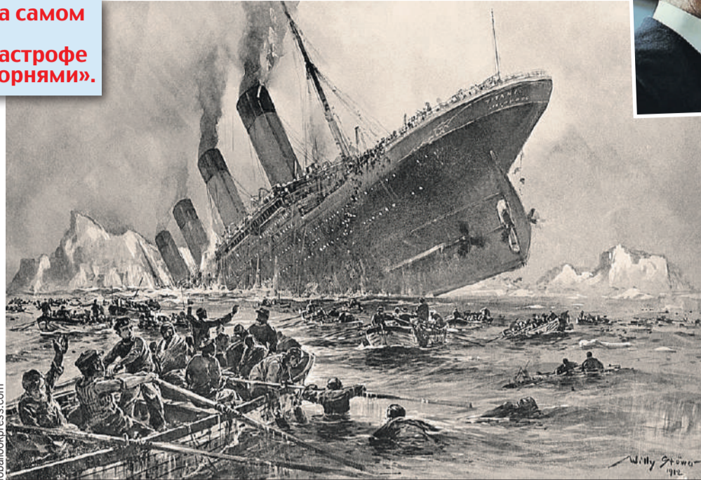
Лайнер затонул более ста лет назад, и это тоже умудрились повесить на русских.

- Я начал искать первоисточник. Оказалось, некий польский сайт 26 февраля написал, будто британский ученый нашел архивные до-