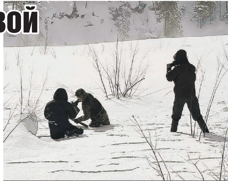
Обломок оказался крупным, пришлось пилить, чтобы вывезти вертолетом.

- В ходе облета территории на участке «Заимка Лыковых» был обнаружен фрагмент ракеты-носителя, - пояснил «КП» - Красноярск директор заповедника «Хакасский». - Отметим, обломок довольно старый, отделившийся в результате