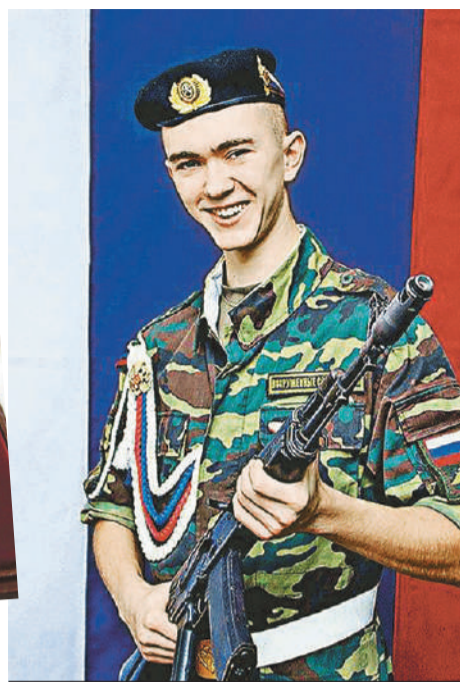
В честь храброго сибиряка в Иркутске планируют назвать улицу.

- Зимой 2022 года он предупредил, чтобы я не волновалась. Мол, едет на учения и связи может не быть до двух недель. Позже стало известно о начале спец-