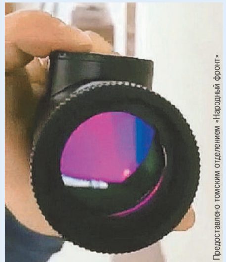
С помощью этого устройства нашим ребятам удалось отследить и ликвидировать вражеских снайперов.

Боец сказал: «Подожди!» - и куда-то убежал. Вскоре вернулся, в руках - приличный кусок сала.