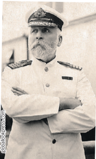
Капитан Эдвард Джон Смит, вероятно, сильно удивился бы открытию «британского ученого».

кументы, в которых говорится, что дед капитана Смита эмигрировал из Российской империи в 1812 году в Великобританию. Начнем с того, что это не британский ученый, а американский, - рассказал «КП» писатель-историк, исследователь «Титаника» Евгений Несмеянов. - Даже если предположить, что у капитана Смита кто-то из родственников эмигрировал из Российской империи, то он явно не был русским. Эмигрировали в то время меньшинства. Смит был британским капитаном, он учился в Великобритании, получил британскую подготовку, капитанский диплом ему был выдан в Англии. И он действовал, сообразуясь с навигационными практиками, принятыми в Великобритании. Поэтому это полностью британская история. Русскими корнями тут даже и не пахнет.