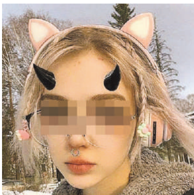
После рождения дочки Вика стала блогером. Только способ заработка сомнителен: продает свои обнаженные фото.

Но в конце концов отвело. Вику положили в больницу. Надолго. И врачи сделали все, чтобы избавить ее от зависимости. Правда, образцовой матерью она так и не стала. Выкладывает снимки дочки и