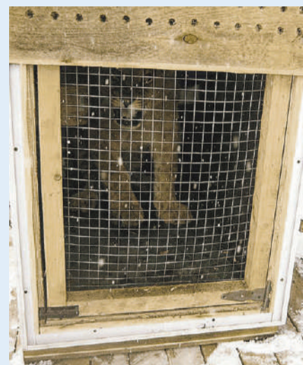
Маленький царь зверей отправился из Приморья в Сибирь.

- До отправки в Хабаровск африканский лев прошел необходимую иммунизацию, обработку и клинический осмотр, по результатам которого дано заключение, что животное здорово. Сейчас лев прибыл в Хабаровск для дальнейшей отправки самолетом в Новосибирск. Оттуда он будет доставлен в государственный Большереченский зоопарк