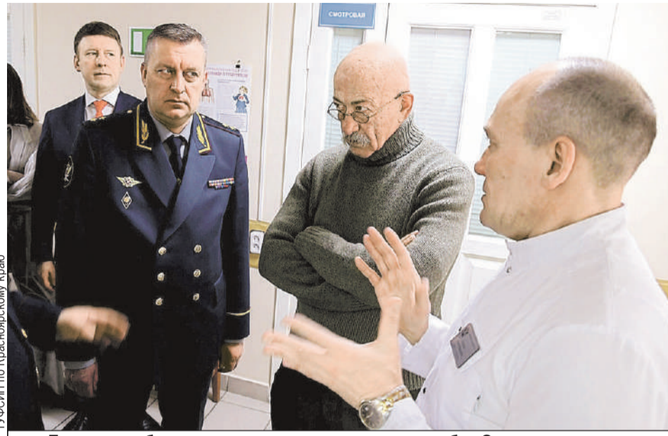
ГУФСИН по Красноярскому краю