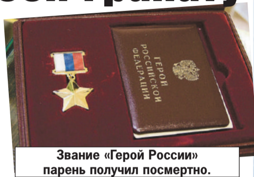
Звание «Герой России» парень получил посмертно.

- А еще он очень любил парады, посвященные Дню Победы, - про-