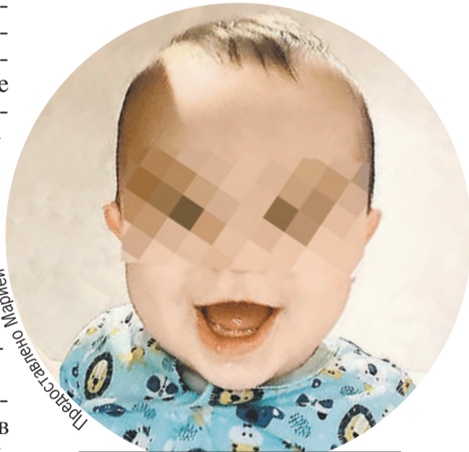
Мальчик сейчас под опекой в российской семье, но за него хочет бороться китайский папа.

- Я получила обещанные деньги, но потом начались проблемы. Мне надо было подписать согласие: это обычная процедура, когда сурмама соглашается вписать в свидетельство о рождении биологических родителей ребенка. И тут я узнала, что отец - гражданин Китая. Про маму речь вообще не шла: как я поняла, заказчик - отец-одиночка из Китая. А тут еще коронавирус, границы закрыты, он не смог приехать в Россию. Меня стали просить, чтобы в матери я записала себя, дабы ребенок не попал в детдом. Не подумала, чем это может аукнуться, и согласилась. Из роддома мальчика забрал директор «Дидилии».