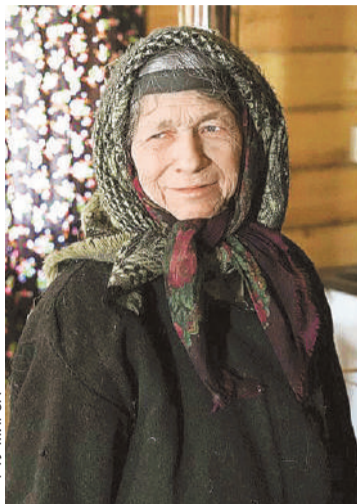
Отшельница не боится «гостей» с Байконура. Говорит: «На все воля Божия».

А что же произошло теперь? Ракета-носитель «Протон-М» была запущена с космодрома Байконур.