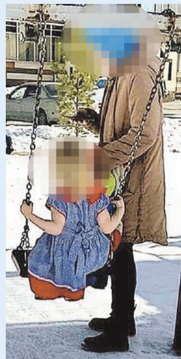
Девочка гуляла без куртки.

Семью после шумихи в интернете тут же навестили органы опеки. Выяснилось, что мама воспитывает двоих детей (они еще не ходят в школу) одна, стоит на учете