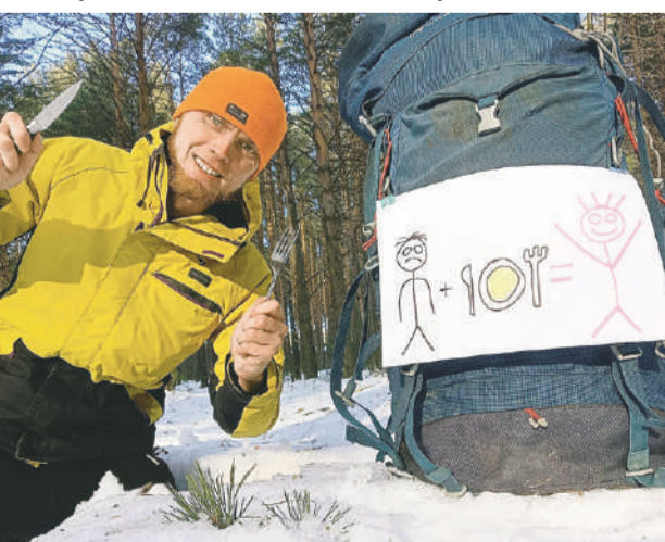
Путешественник готов за еду цитировать «Онегина».

Конечно, в дорогу он взял с собой не только томик Пушкина, но и необходимые вещи - телефон, внешний аккумулятор, коврик, спальник. Ночует у незнакомых людей, в крайнем случае - на вокзале. Кстати, в кармане у него есть банковская карта, но пользоваться ею не спешит - говорит, что обналичит ее только в самом конце путешествия.