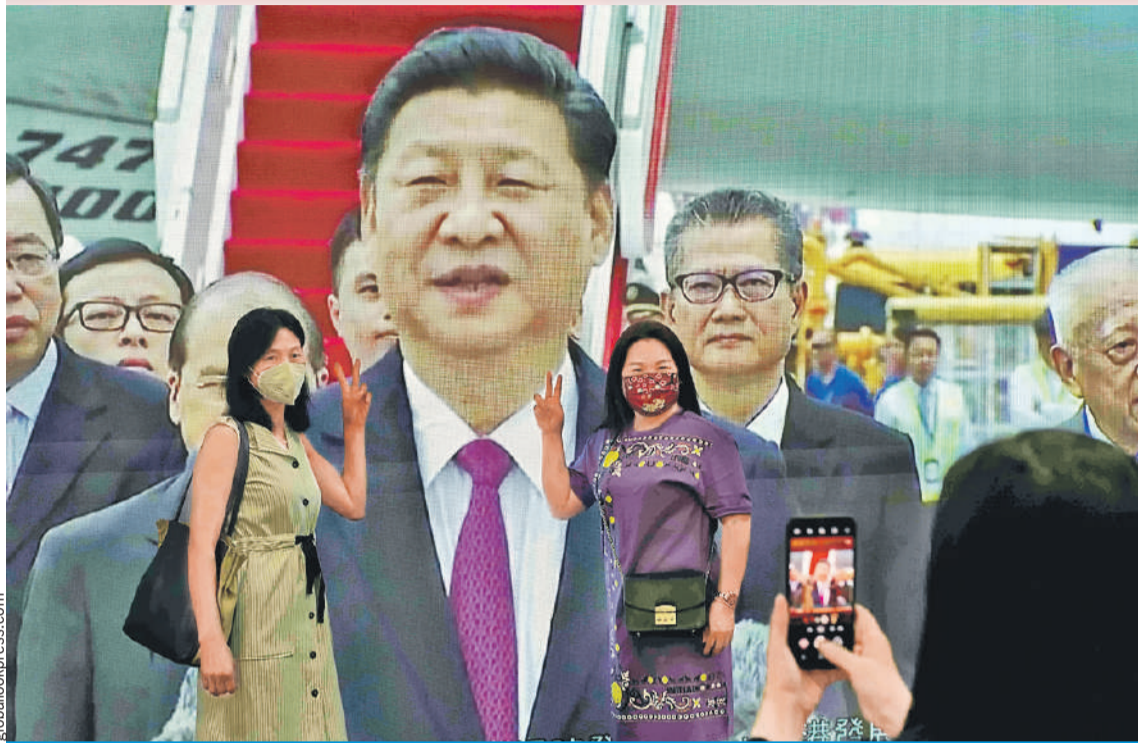
В последние тридцать лет Китай совершил впечатляющий экономический рывок, а за последние 10 лет, под руководством Си Цзиньпина, страна стала настоящей супердержавой.

когда сам был подростком, 20 лет назад, - рассказывает знакомый бизнесмен из Поднебесной. - Стал читать его биографию. И меня поразил один факт. В конце девяностых у экс-мэра Петербурга Анатолия Собчака (под его началом некогда работал Путин ) начались проблемы, он заболел. И Путин, рискуя карьерой, помог ему вылететь на лечение за границу. В нашей культуре такое ценится - верность слову, лояльность руководителю, даже если тот угодил в опалу.