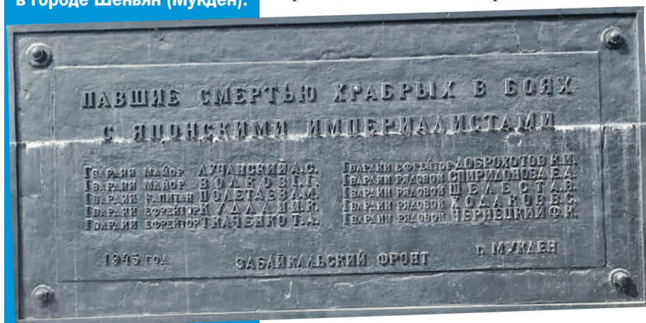
Эдвард ЧЕСНОКОВ/«КП» - Москва

Китай - одна из немногих стран экс-соцлагеря, где за нашими воинскими захоронениями до сих пор ухаживают. Это фото снято на мемориале в городе Шеньян (Мукден).