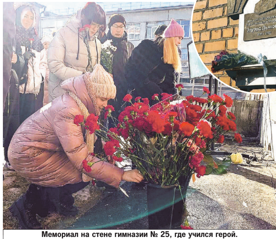
Мемориал на стене гимназии № 25, где учился герой.