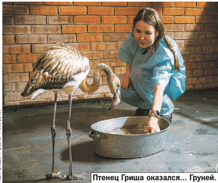
Парк флоры и фауны «Роев ручей»

зависит от питания. Из других новостей: Гриша оказался... Груней! А вот с полом Васи и Маруси их спасители угадали, и имена прижились. Но главное, стая приняла найденшей, и сейчас они почти неотличимы от других фламинго парка «Роев ручей».