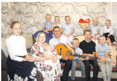
Газета «Ангарские огни»

РАДИО КОМСОМОЛЬСКАЯ ПРАВДА FM.KP.RU Иркутск 91,5 FM | Братск 99,5 FM