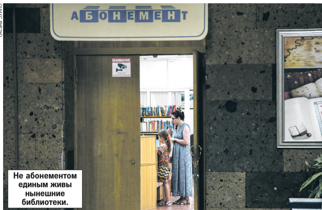
Не абонементом единым живы нынешние библиотеки.

Например, в числе модельных - детская библиотека № 10 в Ангарске. Помимо традиционных абонементов и читального зала в пространство включили зоны с игровым и развивающим оборудованием для детей. Концептуально это галактика в миниатюре, где есть «Цифровая лаборатория», «Планета чтения», «Планета творчества», «Планета малышей» и «Планета познания». В афише мероприятий - мастер-классы за символическую плату 50 - 100 рублей. Дети клеят, рисуют, погружаются в цветотерапию. И, конечно, после занятий не забывают взять домой интересную книгу.