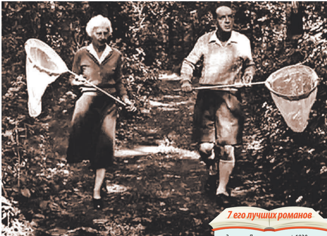
Бабочки были главной страстью писателя после литературы. Он и жену Веру приучил к сачку.