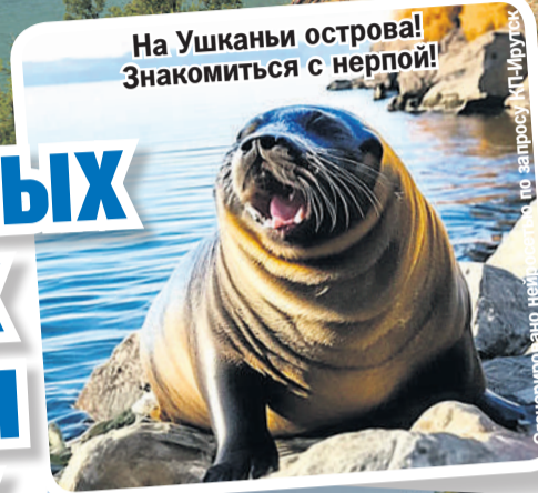
На Ушканьи острова! Знакомьтесь с нерпой!

Удобнее всего добраться по воде. Из Улан-Удэ нужно выехать в село Монахово, а оттуда в пункт назначения. С пересадками можно воспользоваться и общественным транспортом.