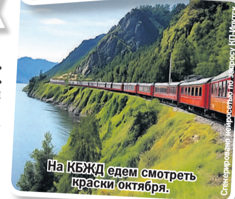
На КБЖД едем смотреть краски октября.