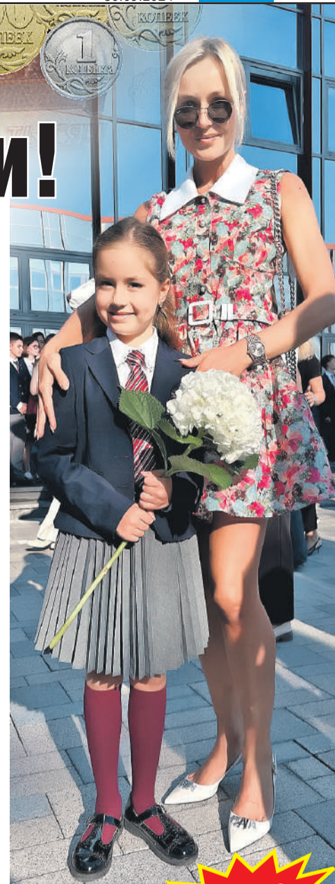
Личная страница Полины Гагариной в социальной сети

Певица Полина Гагарина отвела в первый класс дочь Миу Исхакову - в гимназию имени Евгения Примакова. Учебный год здесь 10 месяцев. Гимназия работает с 8 утра до 8 вечера. Дети учатся, гуляют, посещают занятия по допобразованию или группу продленного дня, где могут сделать уроки или получить консультации учителей, занимаются спортом (есть бассейны, корты, футбольные поля) или выбирают кружки и занятия по своим предпочтениям. Обучение идет на русском и английском языках. Для модных курсов по программированию и робототехнике - современное оборудование. Есть профильные классы, обещают создать условия для осознанного выбора ребенком индивидуальной направленности обучения.