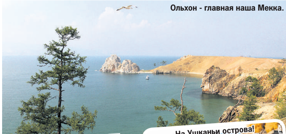
Ольхон - главная наша Мекка.

Второй по величине залив Байкала - Чивыркуйский. Он находится в Бурятии, на восточном побережье озера. Вода здесь прогревается до +24 градусов, но это не все. В бухте Змеиной на поверхность выходят минеральные термальные источники, которые содержат фтор и кремниевую кислоту. Это территория национального парка «Заповедное Под-