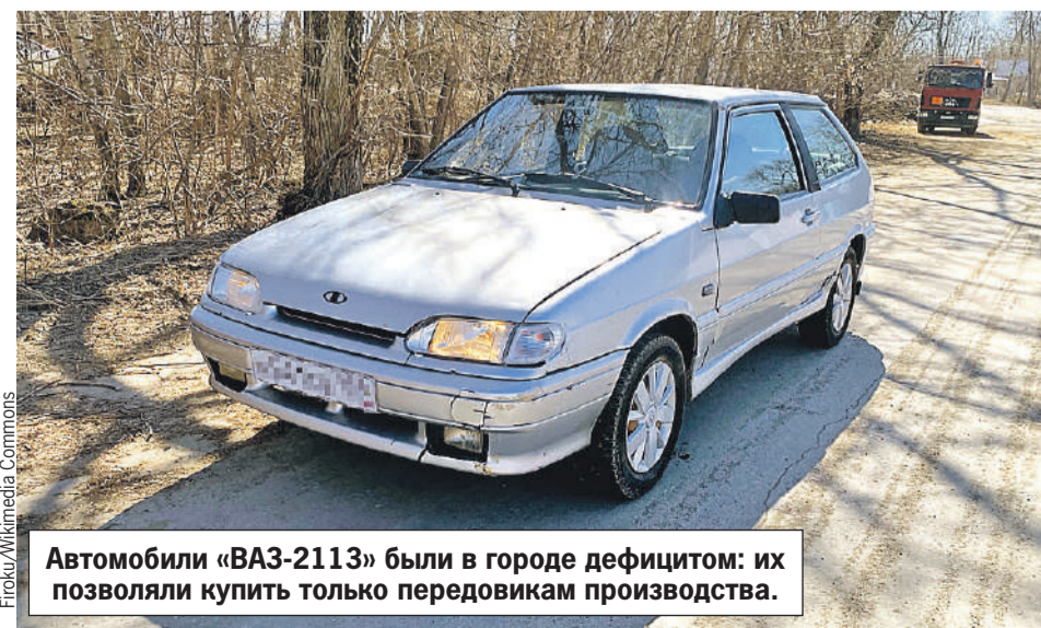
Автомобили «ВАЗ-2113» были в городе дефицитом: их позволяли купить только передовикам производства.

Майструк владел приемами самбо и метания ножа