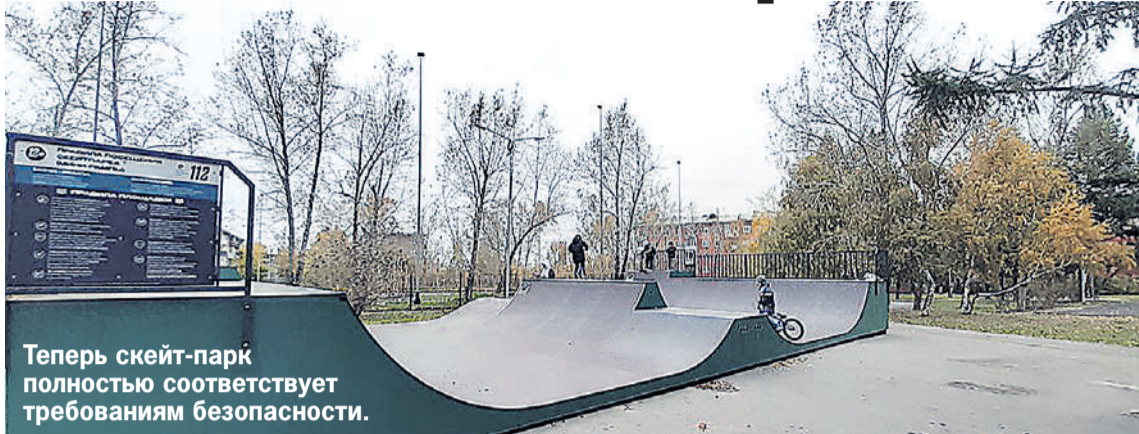
Теперь скейт-парк полностью соответствует требованиям безопасности.