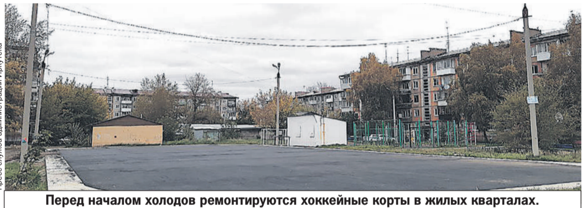
Перед началом холодов ремонтируются хоккейные корты в жилых кварталах.

Еще в этом году привели в порядок ограждения кортов на Байкальской, 312 и в микрорайоне Березовом, 105, обустроили резинопол и основание площадки в микрорайоне Юбилейном, 68 и на Кирпичной, 21/1.