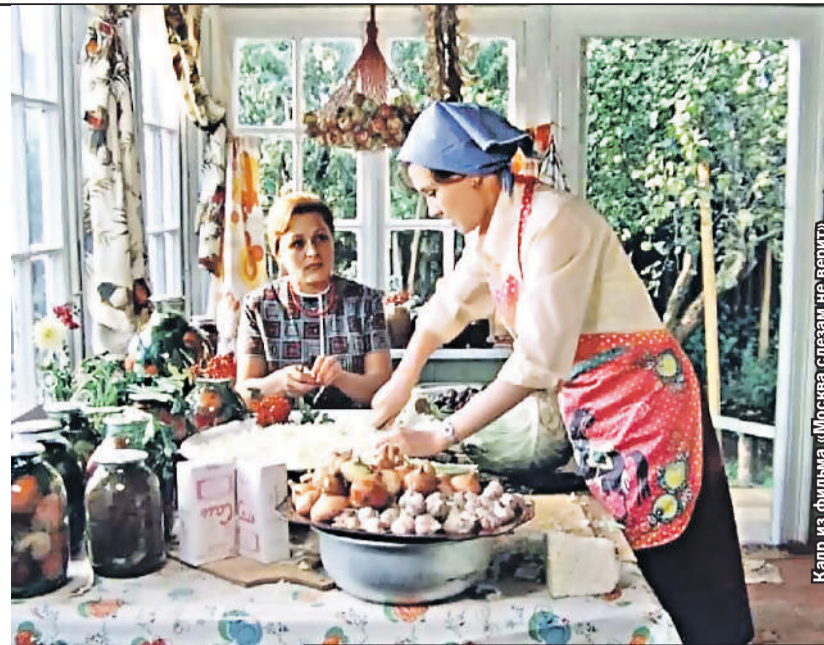
Кадр из фильма «Москва слезам не верит»

пуск три книги, сэкономила около 4500 рублей. Еще один бонус - сдал томик, шкафы в доме пустые, пыль не собирается. А еще в библиотеке по-прежнему можно знакомиться!