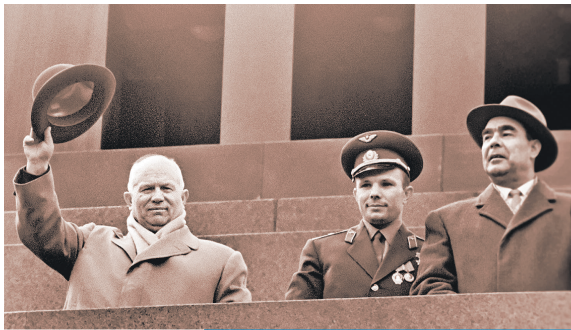
Первый секретарь ЦК КПСС Никита Хрущев, первый в мире космонавт Юрий Гагарин и глава Президиума Верховного Совета СССР Леонид Брежнев (слева направо) на трибуне Мавзолея. Именно за подготовку полета Гагарина в космос Леонид Ильич был награжден первой Звездой Героя Социалистического Труда.

- Его сменщиком в кресле лидера партии должен был стать глава украинской парторганизации Щербицкий . Но внезапная смерть Брежнева 10 ноября 1982 года эти планы поломала.