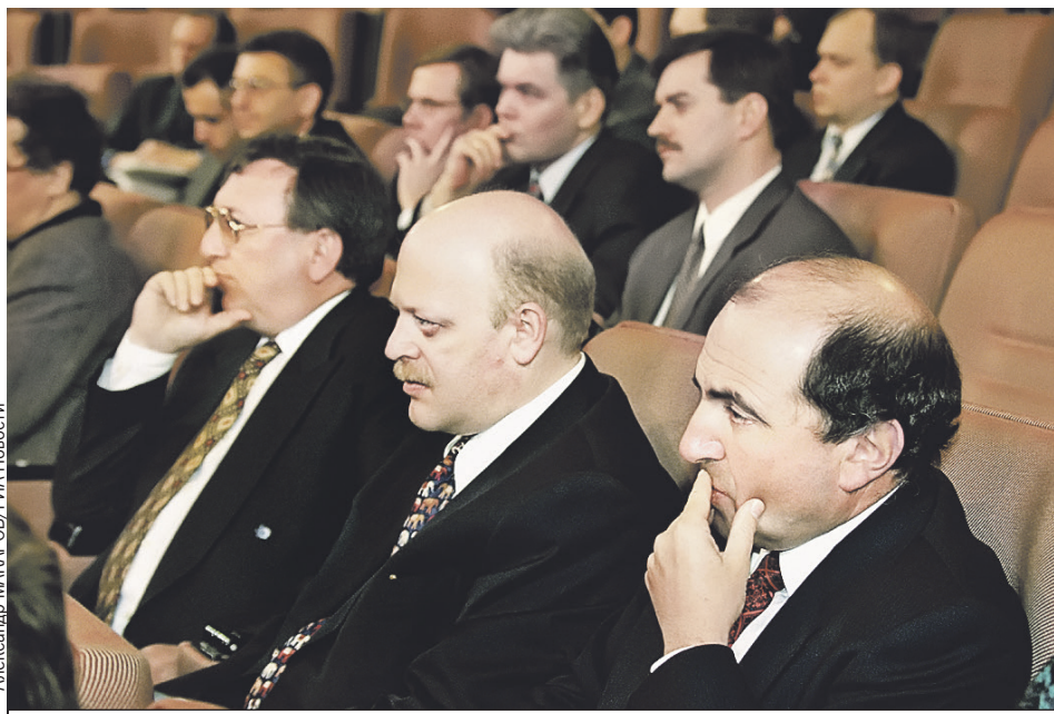
Владимир Гусинский, Александр Смоленский, Борис Березовский (слева направо): пожалуй, самые известные участники «семибанкирщины», которая в 90-е активно участвовала в политической жизни страны.