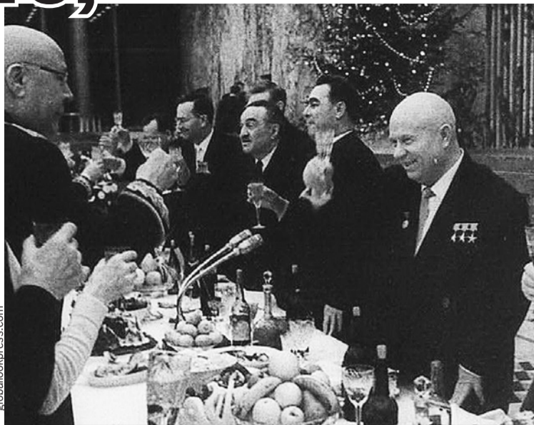
Маршал Советского Союза Семен Тимошенко (на фото - слева) поздравляет первого секретаря ЦК КПСС Никиту Хрущева с Новым годом. Справа от Никиты Сергеевича - его соратники Леонид Брежнев и Анастас Микоян. Москва, Кремль, декабрь 1963 г.

Постышев так и сделал: осудил «левый елочный загиб» и рекомендовал «положить ко-