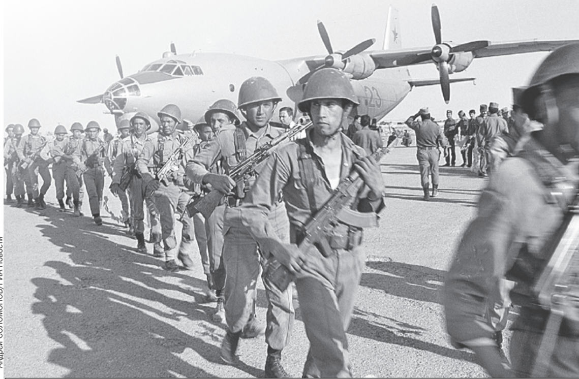
Советский спецназ высаживается в Афганистане. Весна 1988-го.

В самом СССР эта война поначалу держалась в секрете. Газеты и телевидение хранили молчание о ее размахе и потерях, сообщая лишь об исполнении «интернационального долга» в Демократической Республике Афга-