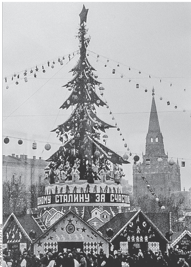
Москва, елка у Троицких ворот. В Кремле - товарищ Сталин, а на новогодней елке среди украшений - здравица в честь великого вождя. 1937 год.

Оказывается, в то время государь заложил не один, а целых три Александровских сада - Верхний, Средний и Нижний - от Угловой Арсенальной до Водовзводной башни: для «красоты и прогулок и праздных забав». Сегодня сад перестали делить на части: теперь он просто один Александровский. Но 200 лет назад народ охотнее всего шел именно к верхней большой рождественской и новогодней елке - у декоративного грота «Руины».