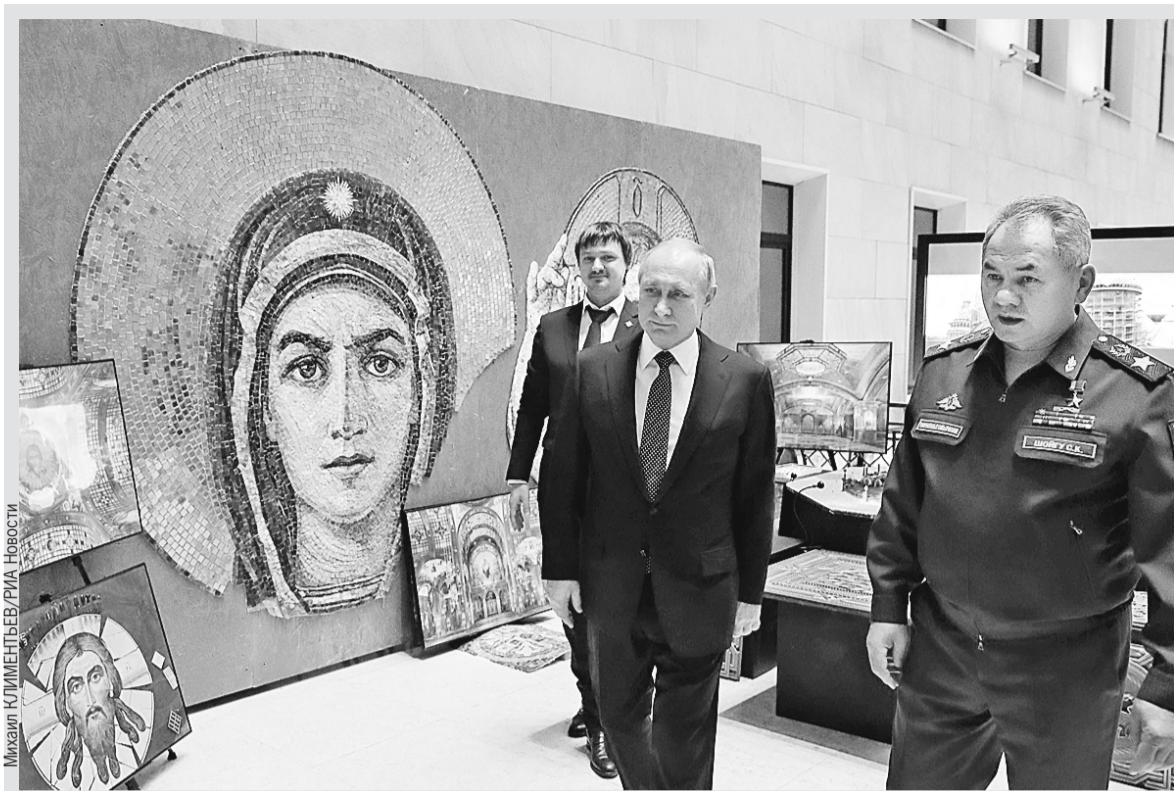
Владимир Путин приехал во вторник на ежегодную коллегию Минобороны. А перед этим Сергей Шойгу провел президента по выставке, на которой были не только новые вооружения, но и образцы внутреннего убранства Главного храма Вооруженных сил, который строится в Подмоскowie к 75-летию Победы.

- Я пью даже не чай, а заваренные, облитые кипятком травы с Алтая.