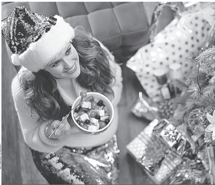
Даже полезной закуске должно быть в меру.

цепт. Картофеля кладите самый минимум, как будто это дорогой деликатес. Во-вторых, вместо покупного майонеза возьмите более легкую заправку (например, греческий йогурт или сметану) или сделайте домашний майонез. Так вы будете знать, что использовали самые свежие и натуральные компо-