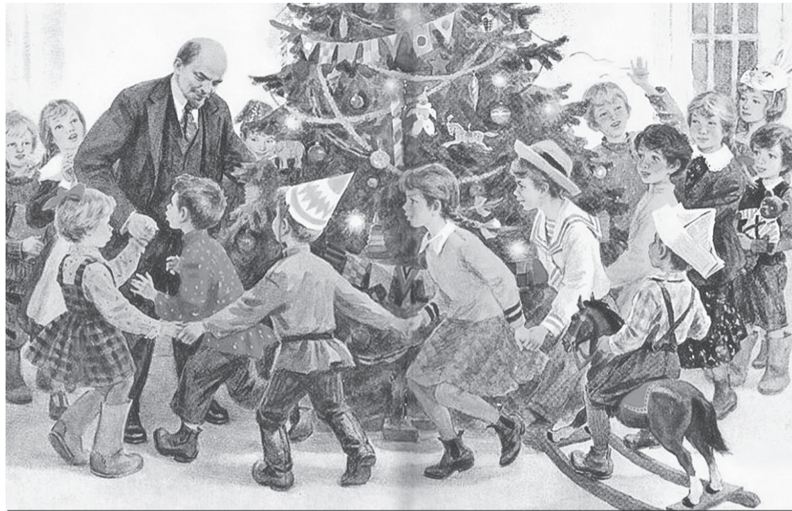
Детский новогодний хоровод с дедушкой Лениным. Поздравительная открытка. 1950-е годы.

ной хороминой на Красной площади, в Тайницком саду у зданий Старых и Новых приказов и у Лобного места, перед Спасскими воротами.