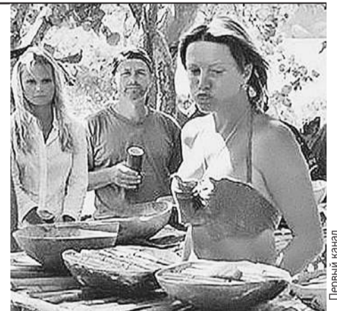
...и 18 лет назад (на заднем плане можно разглядеть Дану Борисову и Игоря Ливанова).

- Чем питаются участники «Последнего героя»?