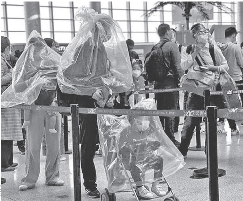
Для защиты от вируса все средства хороши: поверх медицинских масок осторожные граждане надевают полиэтиленовые мешки.