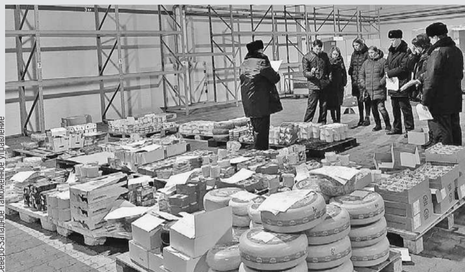
Северо-Западное таможенное управление

- На все эти продукты нет сертификатов, неизвестно, из чего они изготовлены. Важность данной работы продиктована объективными причинами: несмотря на действие в России продуктового эмбарго, недобросовестные предприниматели, применяя незаконные схемы, продолжают ввозить в страну санкционные товары, используют различные способы их легализации на рынке нашей страны, - сообщили в пресс-службе Северо-Западного таможенного управления.