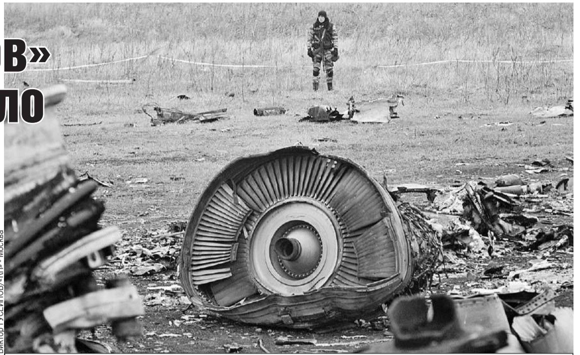
Части ракеты от зенитно-ракетного комплекса «Бук» были вывезены в Нидерланды вместе с обломками малайзийского «Боинга».

Ван дер Верфф утверждает, что вместе с этими сведениями к нему в руки попали еще три файла. Один - это стенограмма беседы немецкого журналиста Билли Сикса с полицией Австралии. Сикс рассказывает о местных жителях, которые в момент катастрофы видели в небе два украинских истребителя. Сикс подтвердил ван дер Верффу, что такой разговор действительно был. Еще один документ фиксирует разговор голландской полиции с нена-