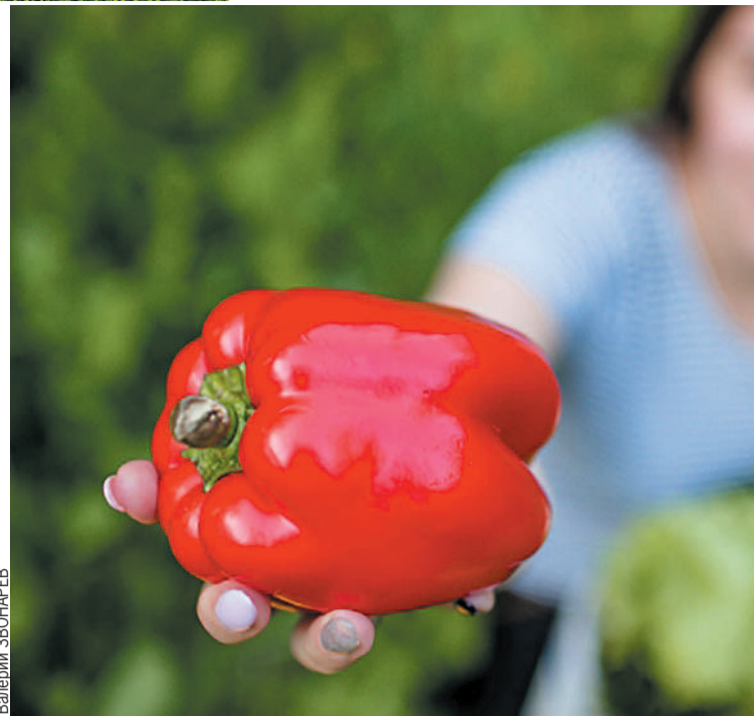
Перцы: во-первых, вкусно, и во-вторых, полезно.

Ранний ( 95-112 дней ) толстостенный гибрид. Высота растения в открытом грунте 50-60 см. Растет интенсивно, плодоносит непрерывно. Плоды красивой сердцевидной формы, толстостенные (до 10 мм) , сочные, с нежным, приятным ароматом и великолепным вкусом. Рекомендуется как для потребления в свежем виде, так и для фаршировки и приготовления лечо (особенно с соком томата F1 Натус ). Средняя масса плода 100-130 г . Окраска плода в биологической спелости - красная. F1 Леро адаптирован к неблагоприятным погодным условиям, приспособлен для выращивания в северных регионах, устойчив к вершинной гнили.