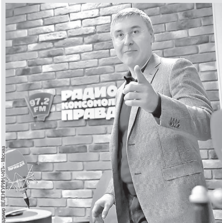
Валерий Фальков приехал в студию Радио «КП» в свой выходной день, без свиты помощников и секретарей.

А второй проект больше исследовательский. Мы сделали ставку на биологическую безопасность растений, животных и человека и открыли институт экологической и сельскохозяйственной биологии. Ему поставлены масштабные