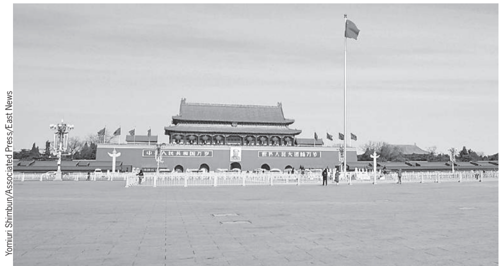
Центральная площадь Пекина - Тяньаньмэнь - одно из самых популярных мест в столице Китая. Количество туристов там всегда зашкаливало (на фото слева - октябрь 2017 года). Но из-за эпидемии коронавируса, охватившей КНР, улицы и площади Пекина пустеют (фото справа - февраль 2020 года).