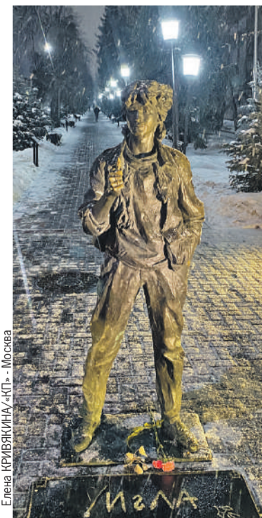
Памятник Виктору Цою в центре Алма-Аты - место притяжения романтиков всех национальностей.

Ну а что касается того парня в обменнике... Как мне признались местные, у многих казахов есть затаенная обида на русских, хотя сразу ее заметить трудно. Было время, когда казахи активно ездили на заработки в Россию, да и сейчас ездят. И, надо признать, не всегда приезжие из Азии встречают у нас теплый прием. Не случайно, когда в Казахстан устремились релоканты из России, казахи язвили в интернете: «Раньше мы у вас были гастарбайтерами, а теперь вы у нас!»