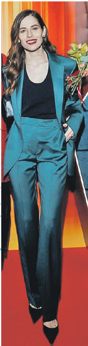
Личная страница в социальной сети Юлии Снигирь

Для презентации сериала «Престиж», где Юлия сыграла главную роль, она выбрала элегантный брючный костюм холодного изумрудного оттенка. Цвет комплекта идеально гармонировал с серо-зелеными глазами и каштановыми волосами актрисы. Образ Снигирь дополнила изящными лодочками и черным топом. Из аксессуаров только бриллиантовые серьги. Легкий макияж с акцентом на губы винного оттенка делает образ безупречным.