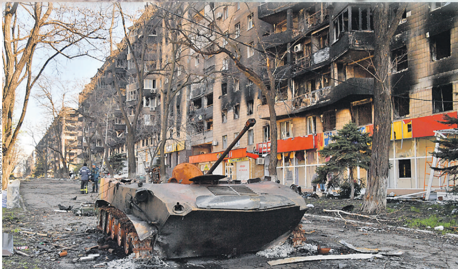
Владимир ВЕЛЕНУРИН/«КР» - Москва

- Мы вас ждали с 2014 года. Мы никогда не теряли веры, что Россия вернется, - устало сказал мне бородатый мужчина, наворачивая ложкой горячую кашу из полевой