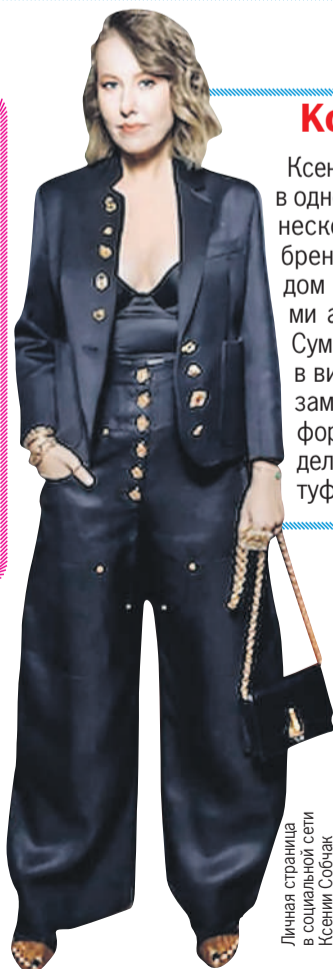
Личная страница в социальной сети Ксении Собчак

Ксения собрала «тотал-лук» (образ в одной гамме. - Ред.) стоимостью несколько миллионов рублей от бренда Schiaparelli. Итальянский дом моды славится оригинальными аксессуарами и фурнитурой. Сумку Собчак украшает застежка в виде носа, а на жакете можно заметить интересные пуговицы в форме ракушек, замков и т. д. Отдельного внимания заслуживают туфли с имитацией пальцев.