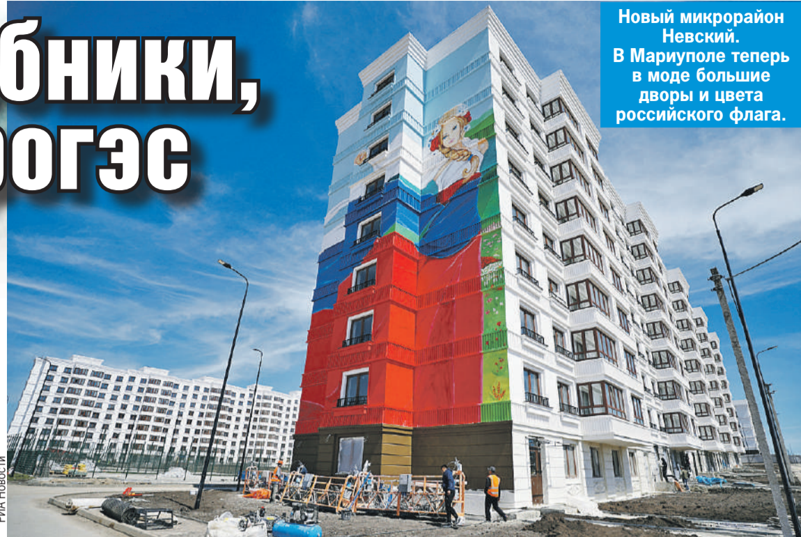
Новый микрорайон Невский. В Мариуполе теперь в моде большие дворы и цвета российского флага.

ешь! Россия город преобразила. Вот там был брошенный долгострой, а сейчас стройка опять пошла. У нас все медикаменты в больнице бесплатно, вот, правда, лифты пока не работают, теперь по российским стандартам они должны пройти проверку. Не все сразу, понимаем, - говорит он.