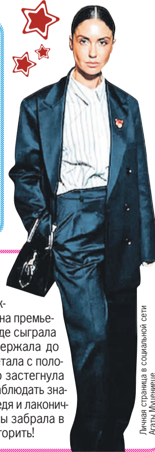
Личная страница в социальной сети Агаты Муцениеце

В костюме как бы с мужского плеча Агата пришла на премьеру фильма «Я - медведь», где сыграла главную роль. Идею выдержала до конца. Синий костюм сочетала с полосатой рубашкой, которую застегнула на все пуговицы. Можно наблюдать значок с изображением медведя и лаконичную темную сумку. Волосы забрала в тугий хвост. Хочется повторить!