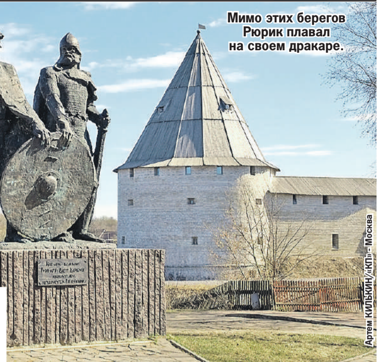
Мимо этих берегов Рюрик плавал на своем драккаре.