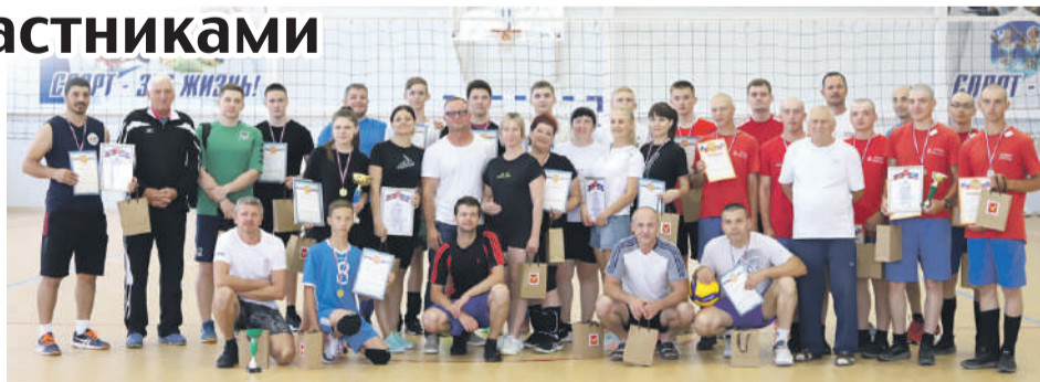
Показатели вовлечения в регулярные занятия спортом местных жителей будут расти.

Отдельно глава Тимашевска сообщил о работе с обращениями граждан. В прошлом году в городской администрации зафиксировали 699 вопросов, что на 102 больше, чем годом ранее. 209 человек пришли на личный прием к мэру.