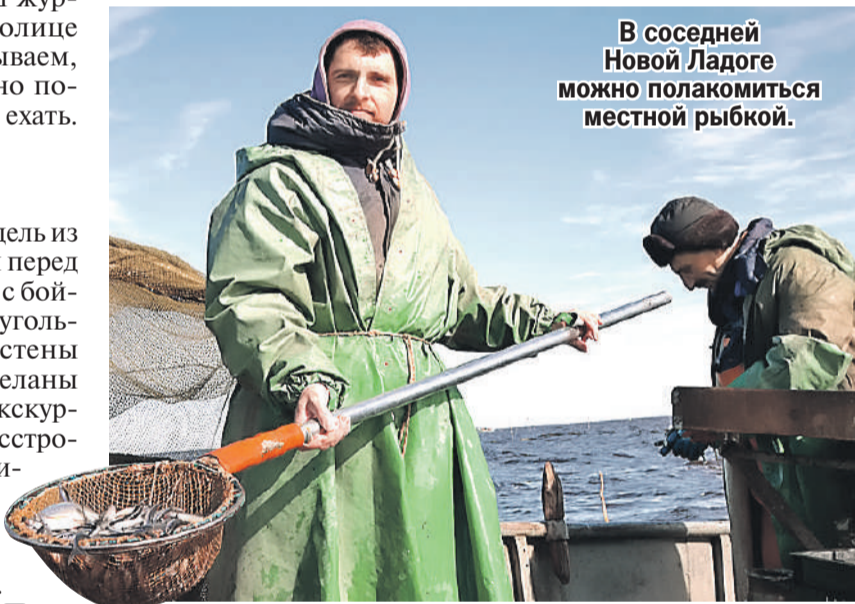
Ирина БЫСТРОВА/«КП» - Санкт-Петербург

В соседней Новой Ладоге можно полакомиться местной рыбкой.