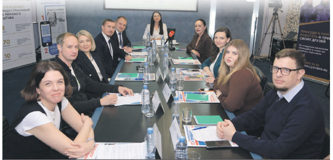
Участники заседания Дискуссионного клуба обсудили вопросы профессионального образования и трудоустройства.

О ситуации с образованием, целевой подготовке и трудоустройстве выпускников вузов в ключевых отраслях экономики Краснодарского края поговорили на заседании дискуссионного клуба «Высшее образование и крупный бизнес в Краснодарском крае: взаимодействие, вызовы и точки роста». В мероприятии приняли участие представители министерства труда и социального развития края; центра занятости населения; высших учебных заведений; компании «ОТЭКО», оператора морских терминалов в порту Тамань, и СМИ региона.