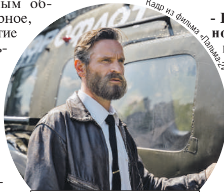
Кадр из фильма «Пальма-2»

Вообще на съемочной площадке главный - режиссер, но тут приходилось прежде всего считаться с косячатым актером.