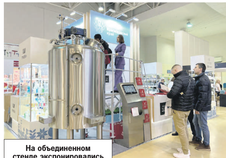
Министерство промышленной политики Краснодарского края

- Продемонстрировали возможности компании «Райс АшТи» и «Научно-производственного предприятия ГИДРОТЕХНОЛОГИЯ» из Северского района, машиностроительной компании «Эйрена» из Тимашевска, производителя «Меридиан» из Кавказского района. Также представили потенциал предприятий «Медлекспром» из Краснодара и «ЭкоЛюкс» из Армавира. Мы организуем коллективную экспозицию на этой выставке пятый год подряд. Ежегодно площадка