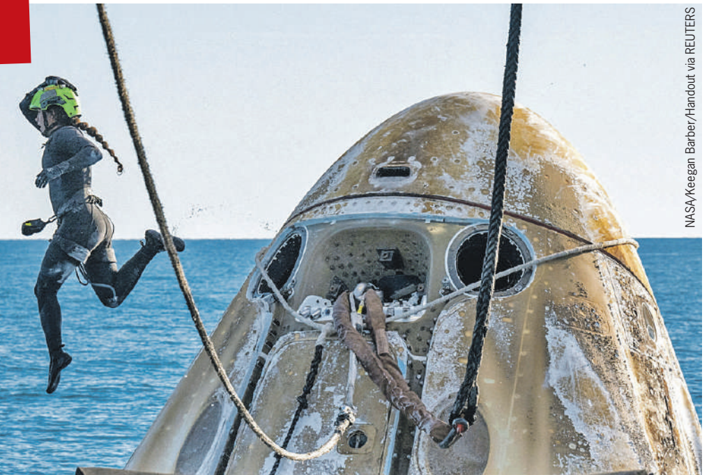
- Мы прожаримся в плазме и искупаемся в океане! - сказала перед возвращением Суни Уильямс (но в воду прыгает не она, встречающий персонал).