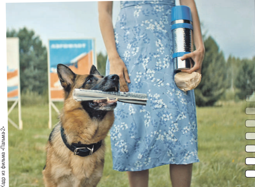
Кадр из фильма «Пальма-2»

Все о самых новых сериалах читайте на нашем сайте