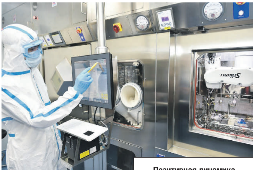
Министерство промышленной политики Краснодарского края

- Наибольший рост отмечаем в выпуске вагонов, фармацевтических препаратов и медицинских изделий, одежды, продукции металлургических предприятий. Также производители увеличили объем отгрузки промышленной продукции. За январь он составил порядка 43 миллиардов рублей с ростом на 16,8 процента к аналогичному уровню прошлого года, - конкретизировали в краевом минпроме.