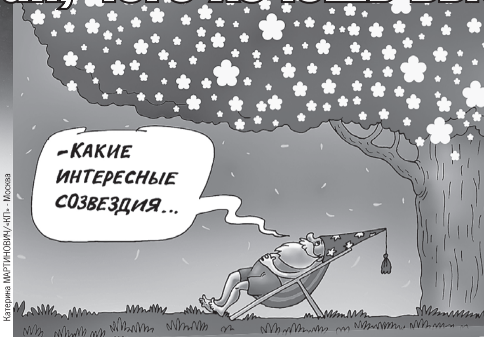
Катерина МАРТИНОВИЧ/«КП» - Москва