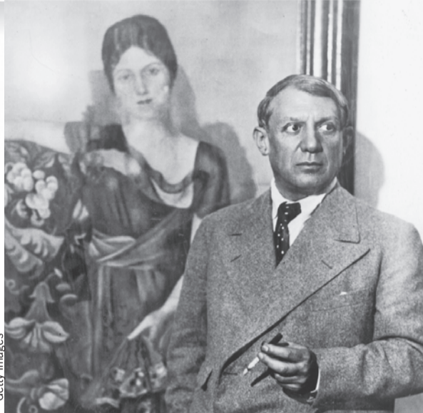
Пабло Пикассо и «Портрет Ольги в кресле».

шает уйти от Пабло, но тот, не желая по закону отдавать половину своего имущества жене, отказывает ей. «Каждый раз, когда я меняю женщину, я должен сжечь ту, что была последней. Таким образом от них избавляюсь. Это,