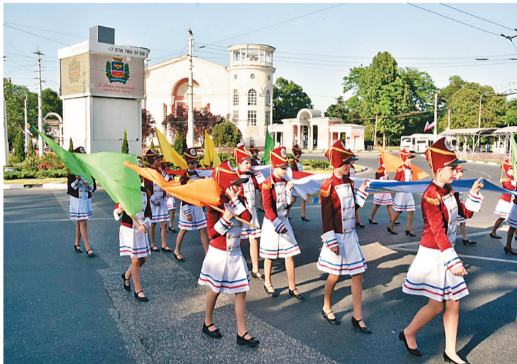
Традиционно основные праздничные мероприятия прошли в центре.

В колонне прошли представители руководства республики и Симферополя, высших