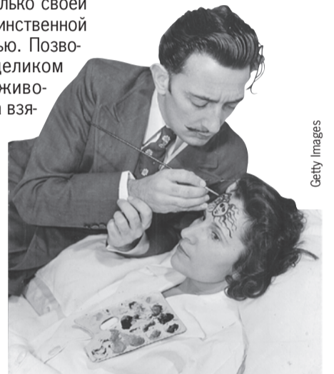
Дали рисует на лице Галы изображение горгоны Медузы, которая могла взглядом превратить в камень.

Гала не была образцом нравственности. Ее многочисленные романы молодости продолжались всю жизнь, несмотря на брак с Дали. Чего стоит ее интрижка с американским певцом Джеффом Фенхольтом , который был моложе ее на 57 лет.