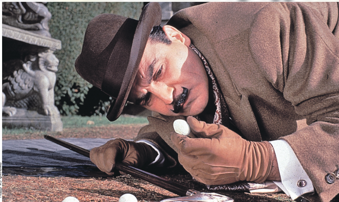
Пуаро знал точно: неизменный арсенал хорошего сыщика - логика и умение анализировать. А в наши дни детективу не обойтись еще и без смартфона.