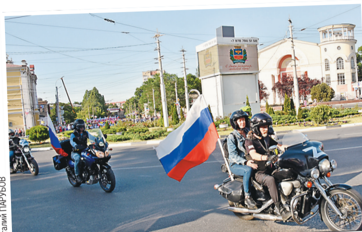
Нотку мобильности придали байкеры из мотоклуба «Ночные волки».

Особую нотку мобильности мероприятию придали байкеры из Севастополя,