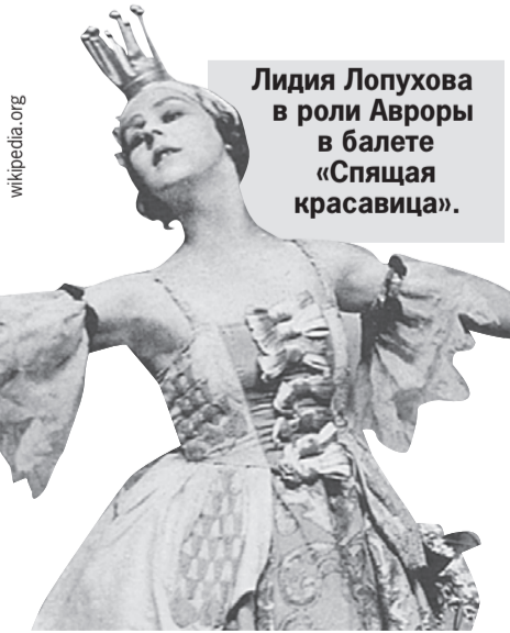
Лидия Лопухова в роли Авроры в балете «Спящая красавица».

Для Кейнса Лидия стала главным советчиком, секретарем, а со временем и сиделкой. Вместе они провели 21 год. После смерти любимого Лопухова прожила еще 30 лет, но в это время избегала общества и после себя ни оставила ни дневников, ни мемуаров.