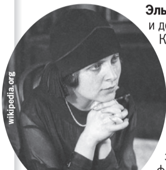
Эльза Триоле часто чувствовала себя в тени своей сестры Лили Брик.

Эльза Триоле родилась в Москве и долгое время носила имя Элла Каган. Еще совсем юной она познакомилась с Владимиром Маяковским , который сперва увлекся ею, но потом переключился на ее родную старшую сестру Лилию Брик .