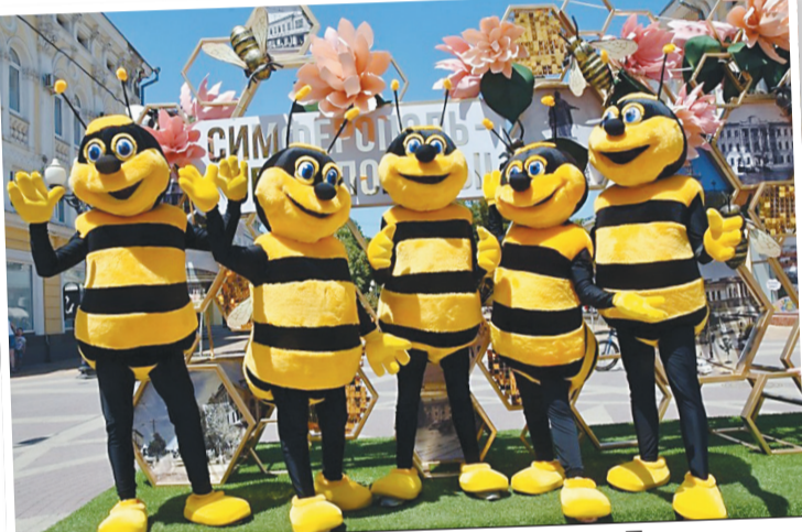
Пчелок можно было встретить на улице Пушкина.

Пчела - это символ Симферополя, которым украшен герб столицы Республики Крым. А название Симферополь с древнегреческого переводится как «город пользы», «город-собиратель».