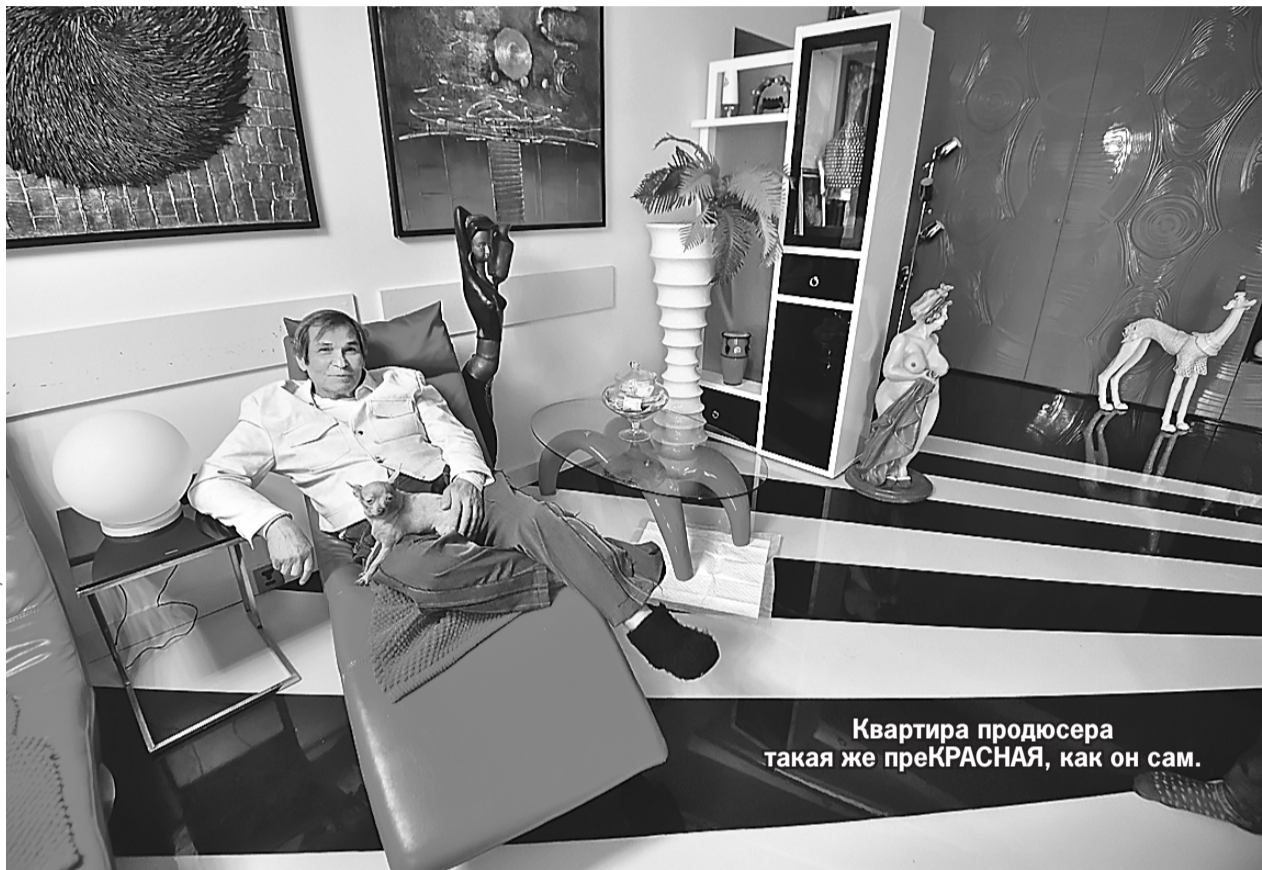
Квартира продюсера такая же прекрасная, как он сам.