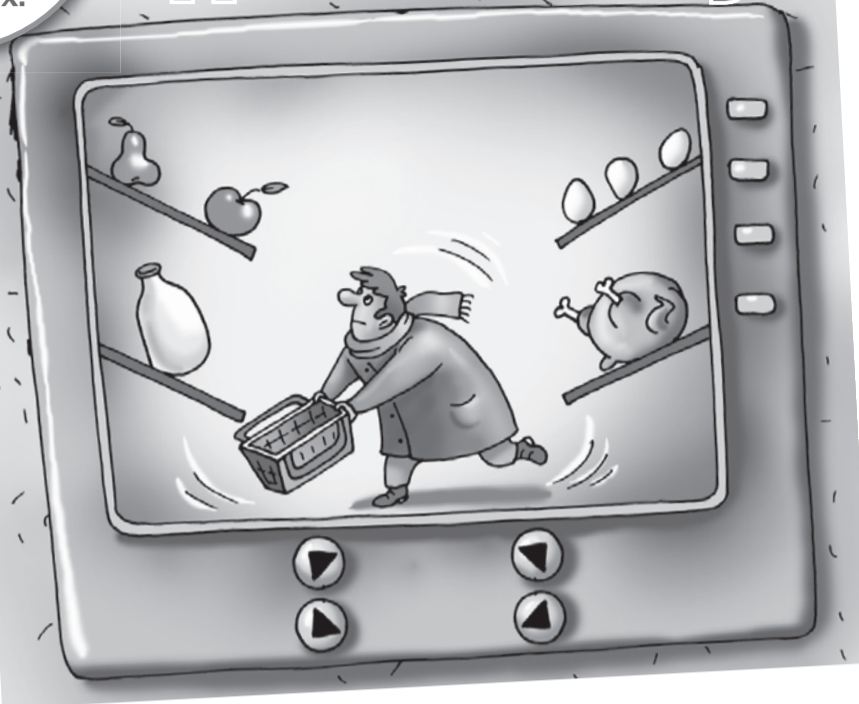
Катерина МАТИНЮВИЧ/«КП» - Москва