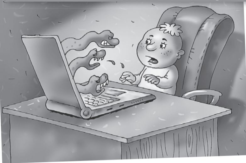
Катерина МАРТИНОВИЧ/«КП» - Москва