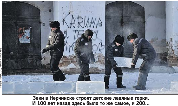
Зеки в Нерчинске строят детские ледяные горки. И 100 лет назад здесь было то же самое, и 200...

в кругосветку, принципиально не пользуясь автотранспортом. Шли на слонах, верблюдах, велосипедах. Попали сюда, как назло, зимой. У Могочи минус 40, велосипеды рассыпались, неделю сидели в палатке. Я эвакуировал их на автобусе, что, по их сценарию, было запрещено. Девы взяли клятву - никому не рассказывать... - Может, и вам на такси? - хитро подмигивает. - Никому не скажу... Минус 35. В первые 15 минут - легкий танец «Медляк». Потом начинается дискотека. Рок. Металл. Брейк-данс.