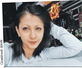
Сестра говорит, что братишка хочет забыть случившееся.

- Мы почувствовали гордость за брата, что так поступил и не растерялся. Ребенок просто. Никто не знает, как себя поведет в таком случае. Фе-