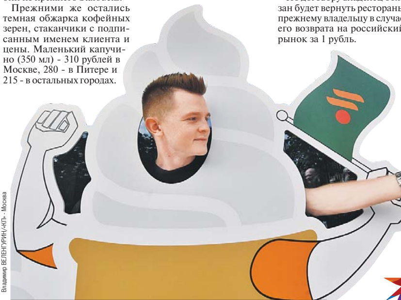
Владимир ВЕЛЕНУРИН/АФП - Москва

Особые условия: По договору владелец обязан будет вернуть рестораны прежнему владельцу в случае его возврата на российский рынок за 1 рубль.