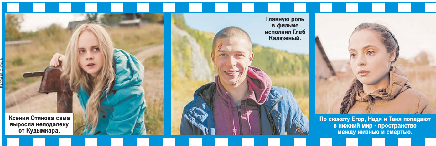
Кадр из фильма