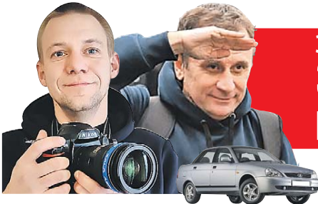
Владимир ВОРСЕБИН (текст)

Читайте на сайте KP.RU все путевые заметки нашей экспедиции (там же - видео, которое мы снимали в пути).