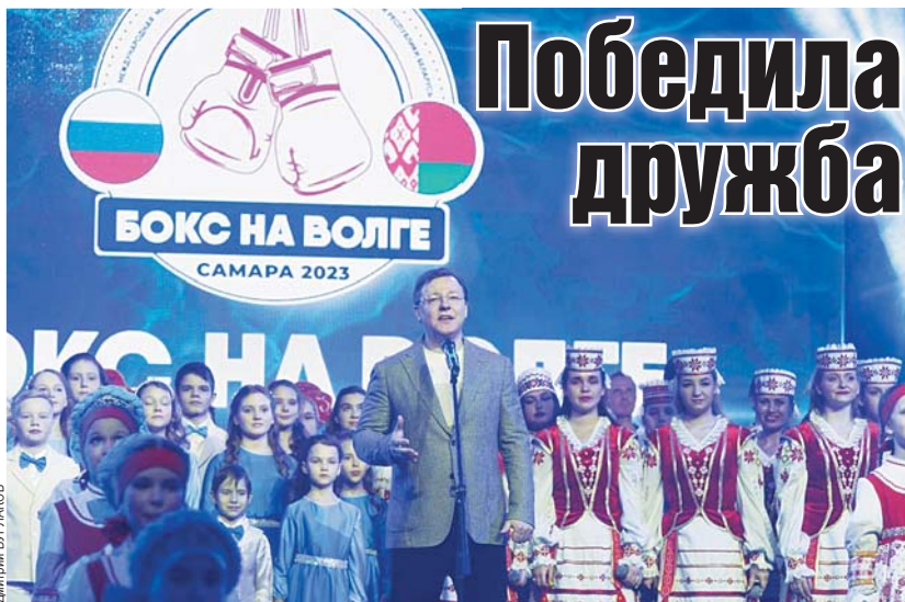
Губернатор Дмитрий Азаров уверен, что турнир «Бокс на Волге» станет традиционным.

Слова губернатора подтверждают фактические данные. По сведениям от регионального министерства спорта, в Самарской области сейчас занимается боксом бо-