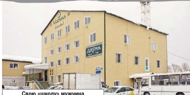
Свою «школу» мужчина организовал в подвале мечети.

Кстати, в самой мечети якобы даже и не знали о происходящем. Как рассказал в беседе с журналистами Председатель