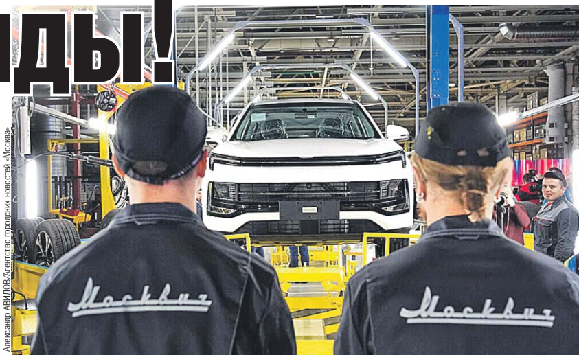
А некоторые зарубежные концерны просто подарили России свои заводы. Так сделала Renault-Nissan: компания передала свой столичный завод местным властям, и теперь на нем выпускают «Москвич».

Сети дали новое имя - это финский бренд Teboil. Все АЗС работают в прежнем режиме. Рабочие места сохранены.