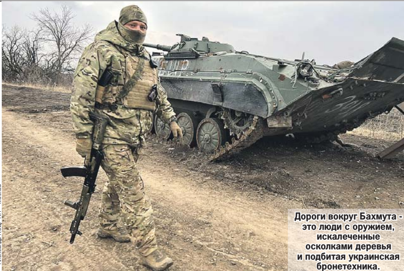
Дороги вокруг Бахмута - это люди с оружием, искаленные осколками деревьев и подбитая украинская бронетехника.