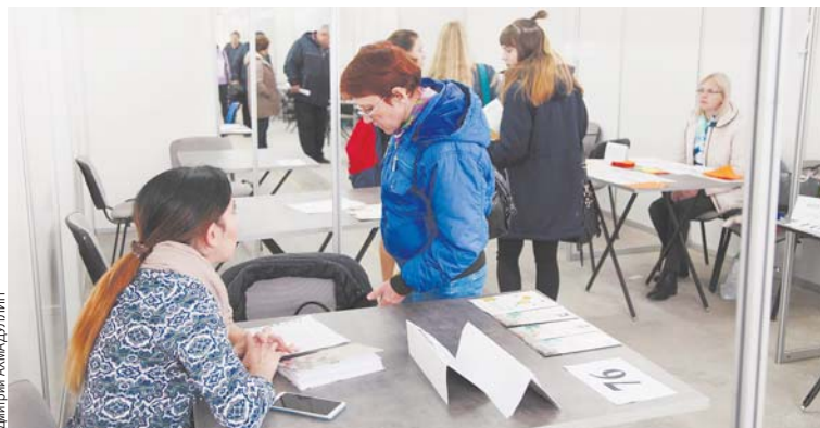
Поиск работы в среднем занимает от 3 до 6 месяцев.