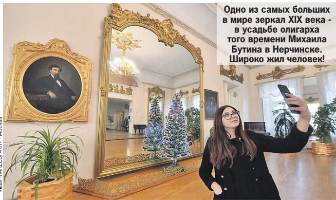
Одно из самых больших в мире зеркал XIX века - в усадьбе олигарха того времени Михаила Бутина в Нерчинске. Широко жил человек!

Продолжение читайте в следующих номерах «КР» и на нашем сайте KP.RU.