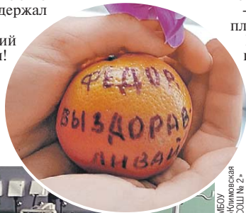
МБОУ «Чирковский СОШ № 2»