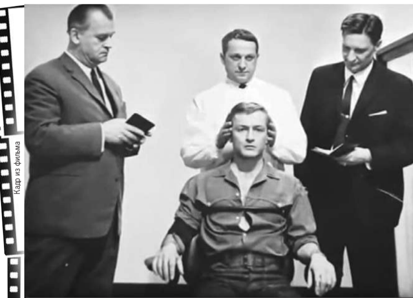
Кадр из знаменитого фильма «Ошибка резидента», где советскому разведчику (его сыграл Михаил Ножкин) на Западе устраивают психологическую проверку.

Хангошвили. Во время интервью Такеру Карлсону Владимир Путин говорил о Красикове как о человеке, который «ликвидировал бандита из патриотических соображений».