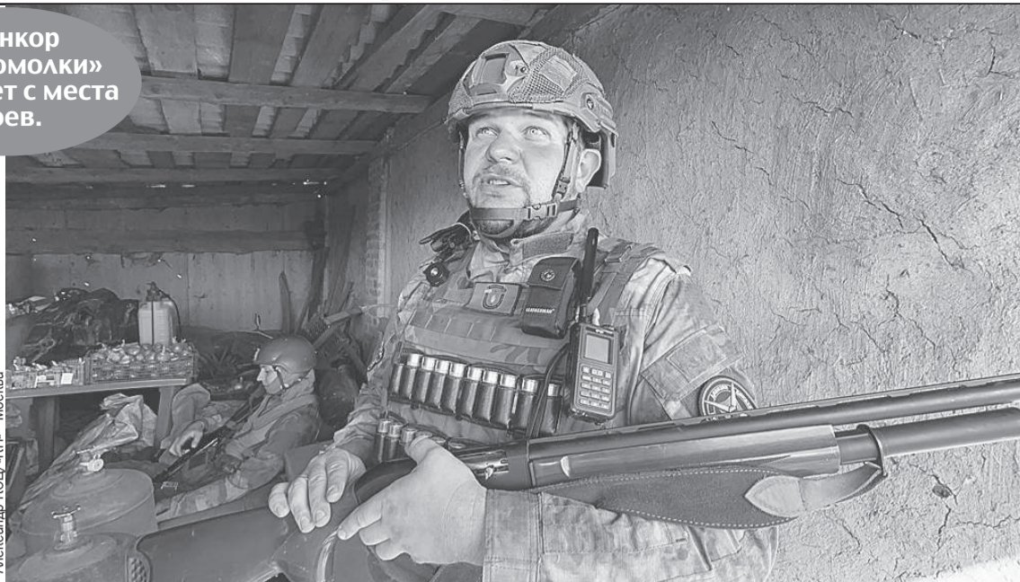
Вообще-то боец с позывным «Связист» отвечает в «Пятнашке» за связь. Но его огромное ружье - это еще и гроза всех вражеских дронов.

- Свою линию мы сейчас стабилизировали, наши парни никуда не сдвинутся, - уверяет «Близнец». - Вы же