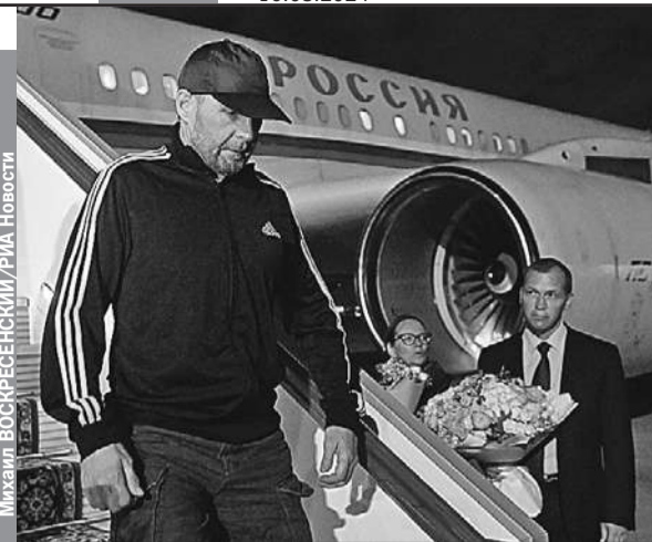
Вадима Красикова, вызволенного из ФРГ, называют ключевой фигурой обмена.

А еще известно, что Красиков молчал. Он не признал вину, не сотрудничал с немецким следствием, не просил о помиловании или снисхождении. А ведь его наверняка «кололи». Даже ломали, добиваясь признания в связях с российскими спецслуж-