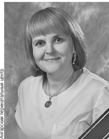
Ангарский перинатальный центр

- А знаете, как она работает? - кипятится Иушин. - Как правило, пользуются ею выходцы из Средней Азии. Они получают гражданство, адаптируют свой медицинский диплом. И вот только такую сотрудницу возьмешь в штат, она - раз - и ушла в декрет. Потом во второй. И, не выходя толком на работу, отработала этот миллион.