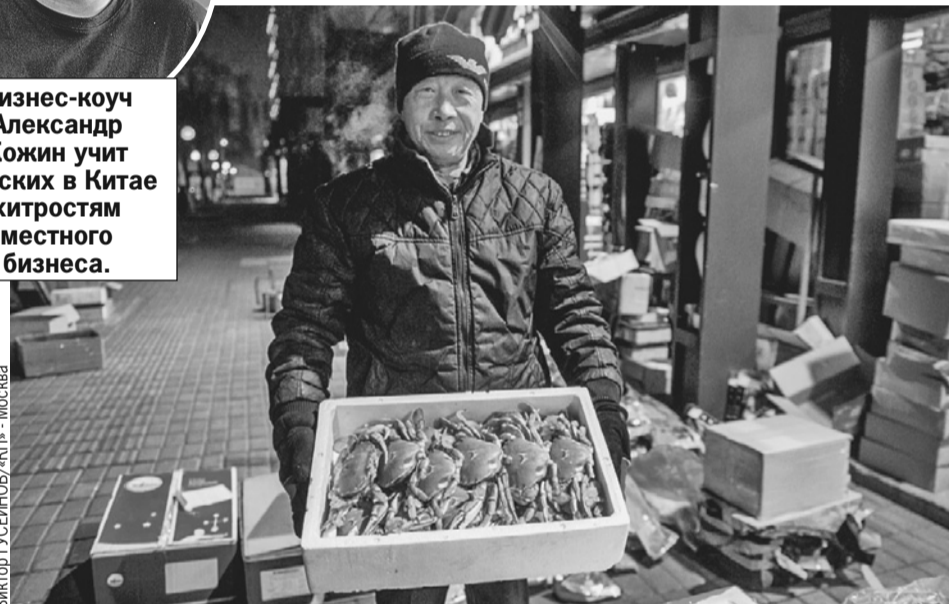
Русская улица в Хэйхэ. Когда-то здесь торговали товарами из России только русские бизнесмены. Теперь товары те же, но торговцы - китайцы.

- Специалисты, маркетинг, бизнес-план, - пытаюсь угадать.