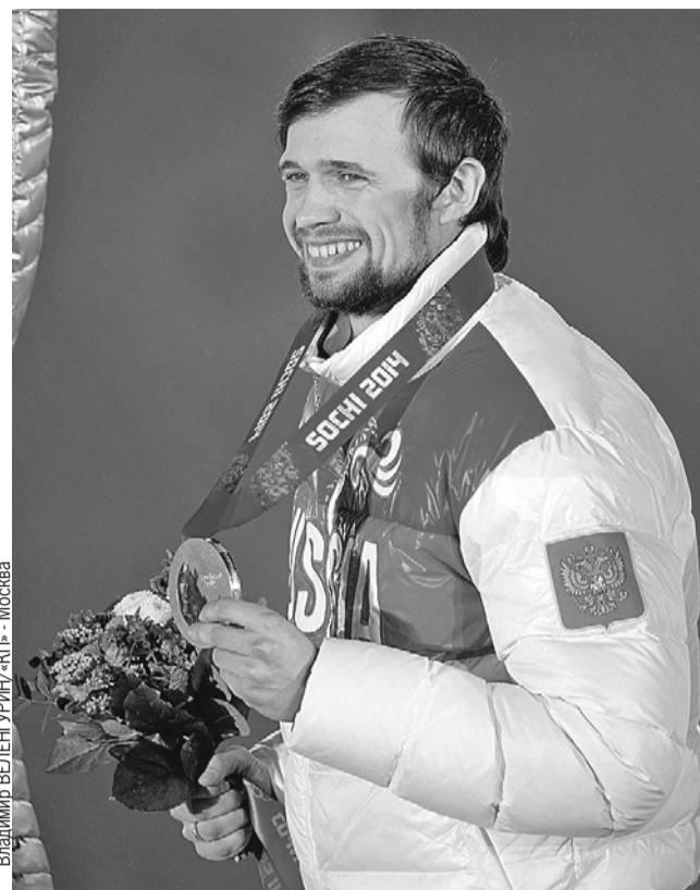
Скелетонист Александр Третьяков теперь сможет гордиться своей наградой, как и раньше.

В МОК крайне скупо пока комментируют решение Спортивного арбитражного суда. Там заявляют, что рассмотрят все документы, и не исключают, что пойдут обжаловать вердикт в Федеральный суд Швейцарии. Теперь мяч в их воротах, теперь это уже они должны идти отыгрываться.