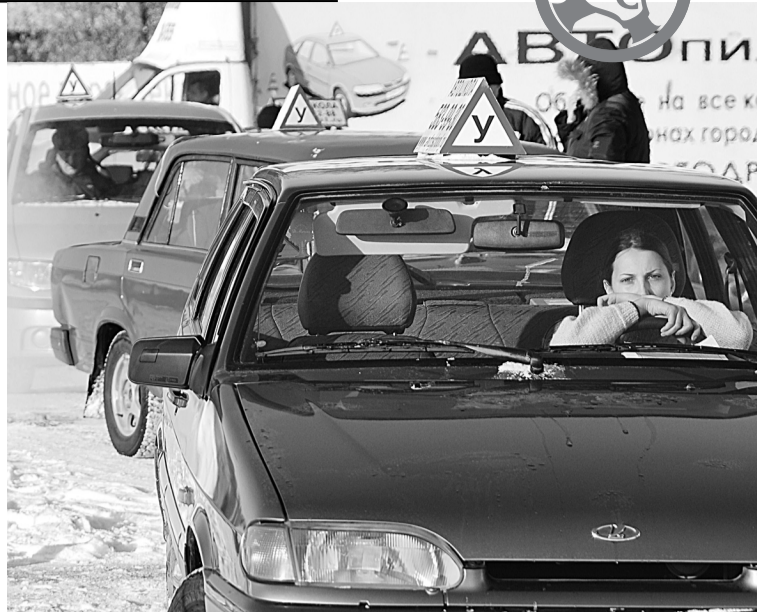
Требования к кандидатам в водители с каждым годом ужесточаются.

- У меня в автошколе стаж у инструкторов не менее 7 лет, а также все категории открыты. Они учатся на специальных курсах, получают именную корочку гособразца с серийным номером, как в институте. Купить эту корочку практически нереально. Раз в квартал я своих инструкторов тестирую: они сдают ПДД, как обыч-