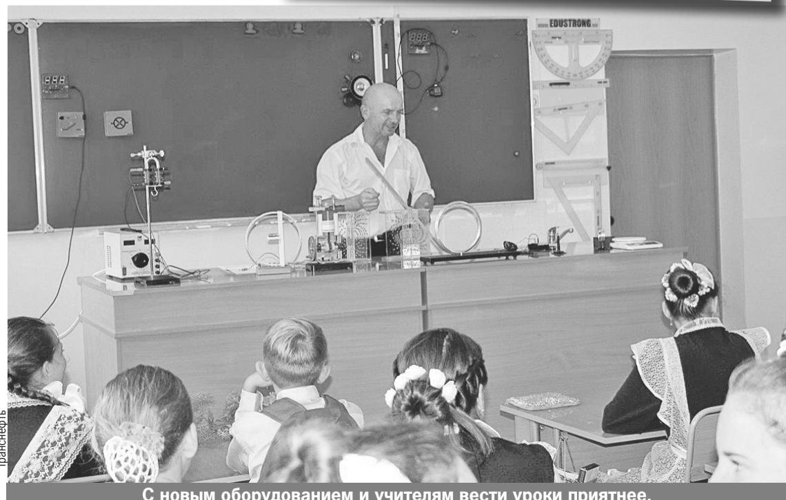
С новым оборудованием и учителям вести уроки приятнее.

Корпоративной программой помощь «Транснефти» школам не ограничивается. Так, за два года в башкирском селе Нагаево на средства АО «Транснефть - Урал» с нуля возвели современную школу на 1250 детей. В четырехэтажном здании есть все, чтобы учеба была в радость: лаборатории и мастерские, актовый и спортивные залы, кабинет робототехники. До этого местная школа ютилась в старом маленьком здании, учиться приходилось в две смены.