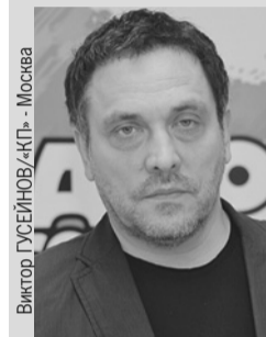
Виктор ГУСЕЙНОВ «КП» - Москва