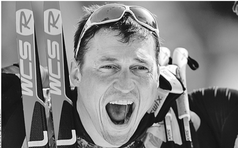
Лыжник Александр Легков, которому вернули «золото» Сочи, назвал этот день своим вторым днем рождения.

Наказание в отношении еще 11 атлетов CAS оставил в силе. В частности, в отношении бобслеистов, завоевавших 2 «золота» Сочи-2014. Дела еще трех биатлонисток, среди которых и Ольга Зайцева , будут рассмотрены позже.