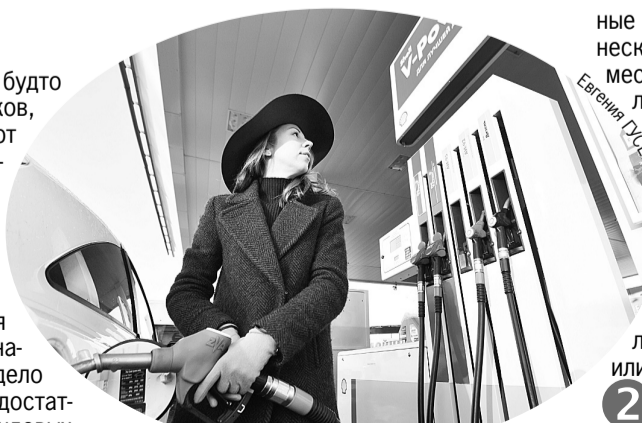
Заливайте бензин в бак понемногу. На 10 литрах мутить вряд ли станут.

ные начальники. С одной большой АЗС в несколько колонок только на недоливе за месяц можно до миллиона рублей сделать, и ведь это прямоком в карман, без всяких отчетов и налогов! Но нам что их грязные миллионы, как не стать жертвой таких жуликов - вот вопрос. А способы есть.