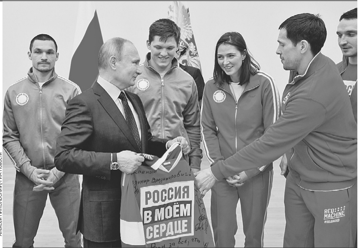
Капитан российской сборной по хоккею Павел Дацюк (справа) вручил Владимиру Путину свитер с автографами всех наших хоккеистов, которые едут на Олимпиаду в Южную Корею.

- В отношении многих наших атлетов был заявлено, что они не допущены «по совокупности обстоятельств,