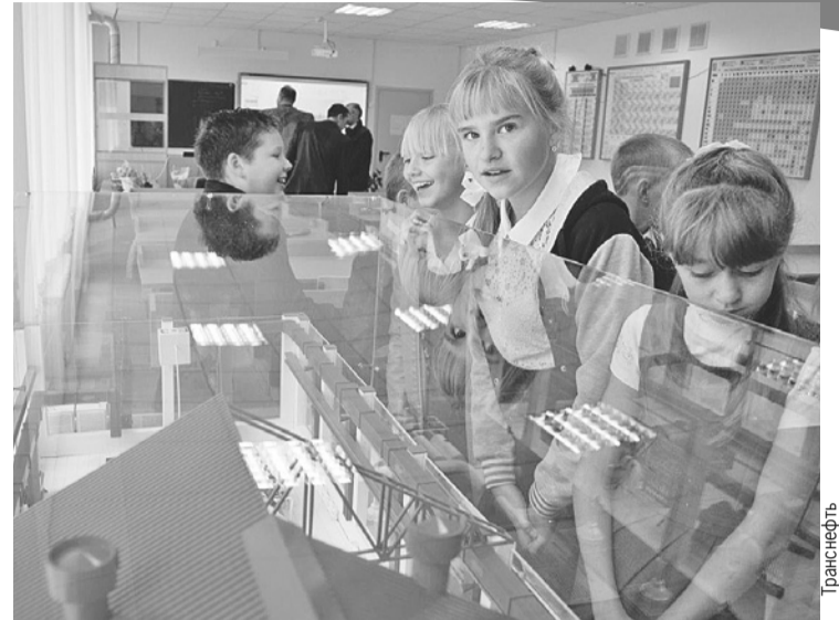
Теперь химия для ребят из скучных параграфов учебника превратилась в живую науку, которую можно увидеть своими глазами.