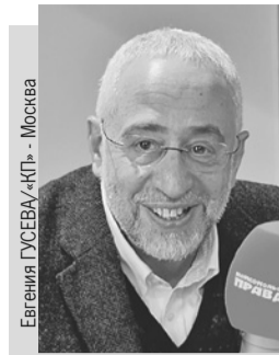
Евгения ГУСЕВА «КП» - Москва

- Прекратите немедленно! Я прошу прощения за действия тех, кто в этой студии должен был сражаться словами.