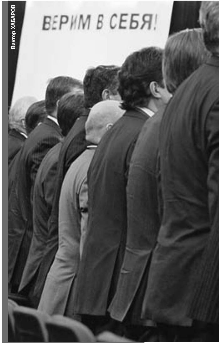
Чиновники верят в то, что их стройные тылы даже в случае отставки государство прикроет льготами и бонусами...

ше 6 лет - уже 75%. Таким образом, каждый из премьеров-отставников претендует на прибавку от 326 до 444 тысячи рублей.