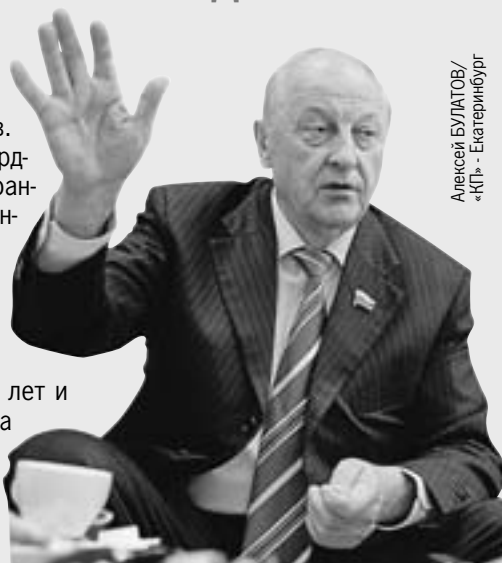
Александр БУЛАТОВ/«КП» - Екатеринбург