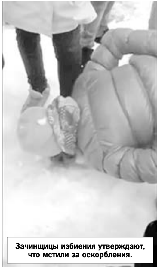
Зачинщицы избиения утверждают, что мстили за оскорбления.

юношей. Однако некоторые из них только наблюдали, не вмешиваясь в конфликт. Пока к ответственности предполагается привлечь четырех участников и их родителей.