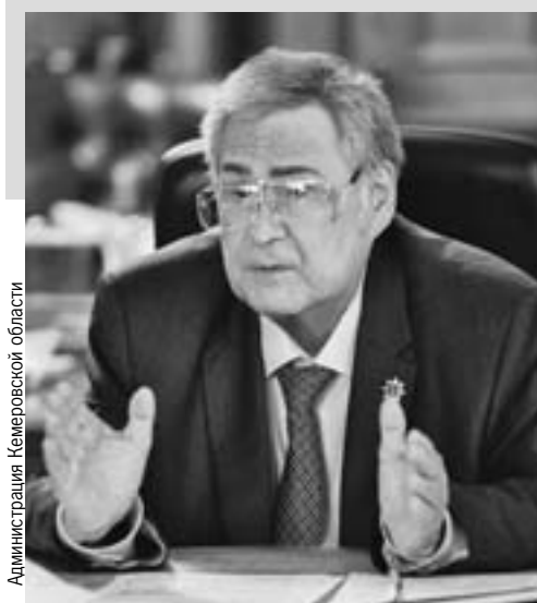
Администрация Кемеровской области