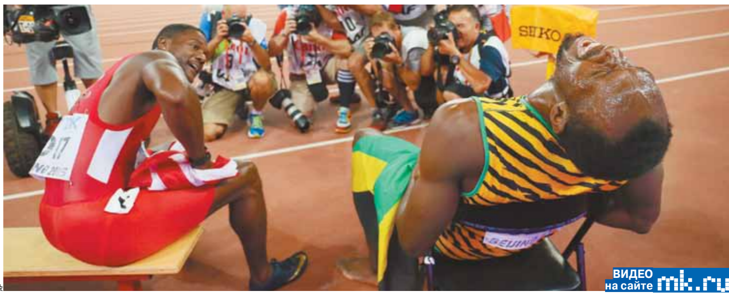
ВИДЕО на сайте mk.ru