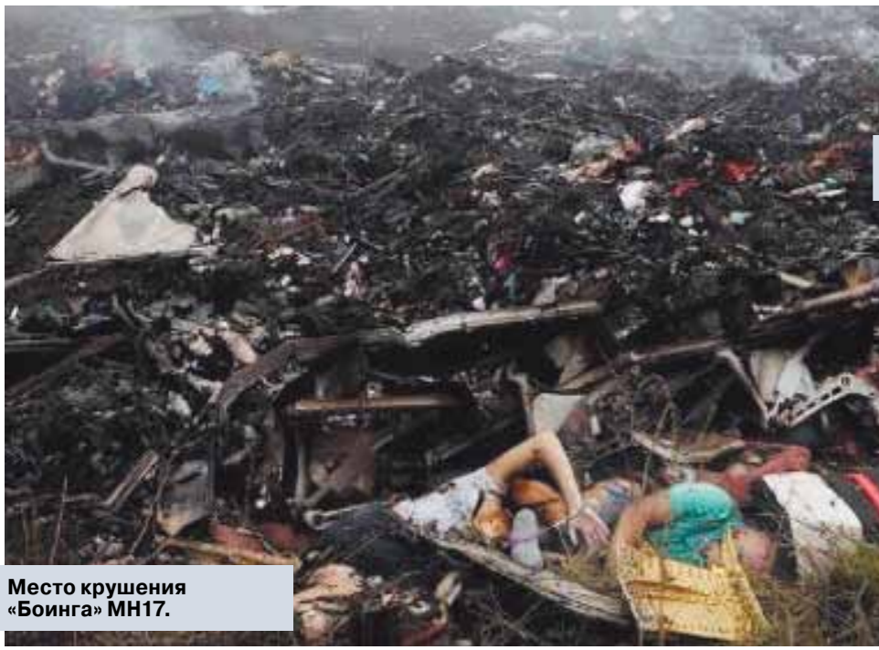
Место крушения «Боинга» MH17.

В рассказе украинского летчика о падении «Боинга» — масса нестыковок