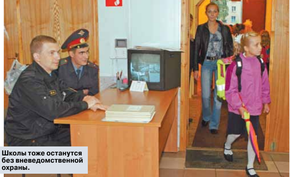
Школы тоже останутся без вневедомственной охраны.

сокращать, кроме вневедомственной охраны, просто некого) снимает своих сотрудников с постов в музеях, школах, лагерях, на стратегически важных предприятиях и так далее. Бюджет, предположим, на этом этапе сэкономлен. Но все эти конторы нуждаются в охране. И большинство из них финансируется из федерального бюджета. А значит, именно из бюджетных средств то же Минобрнауки будет платить своей охранной структуре. (Вот и бывшие сотрудники вневедомственной охраны туда смогут устроиться работать.) Отличная попытка сэкономить, отдавая деньги не правой рукой, а левой. Но будем считать, что это не шулерство, а недомыслие.