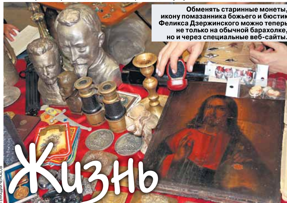
Обменять старинные монеты, икону помазанника божьего и бустик Феликса Дзержинского можно теперь не только на обычной барахолке, но и через специальные веб-сайты.

Затянувшийся экономический кризис, заканчивающийся, похоже, только в умах высокопоставленных чиновников, вносит свои жесткие коррективы в потребительское поведение обычных граждан. Тех самых, кто на собственном опыте столкнулся с сокращением доходов, задержками зарплат, потерей работы... Волей-неволей, для того чтобы выжить, они вынуждены были вернуться чуть ли не в первобытно-общинный строй, отринув лицемерные купюры. В социальных сетях набирает обороты мода на обмен товарами и даже услугами — без всяких денег.