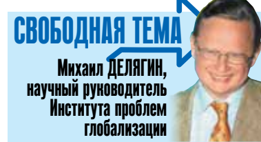
СВОБОДНАЯ ТЕМА Михаил ДЕЛЯГИН, научный руководитель Института проблем глобализации