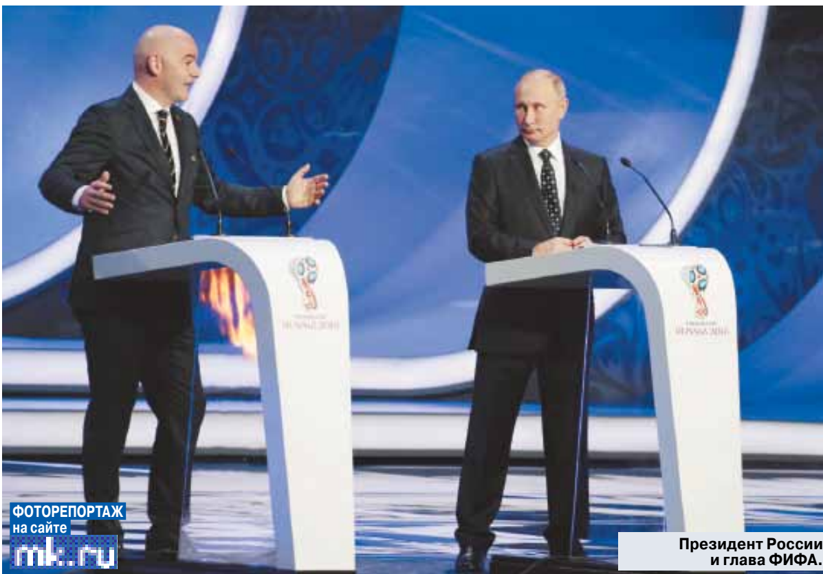
ФОТОРЕПОРТАЖ на сайте mk.ru