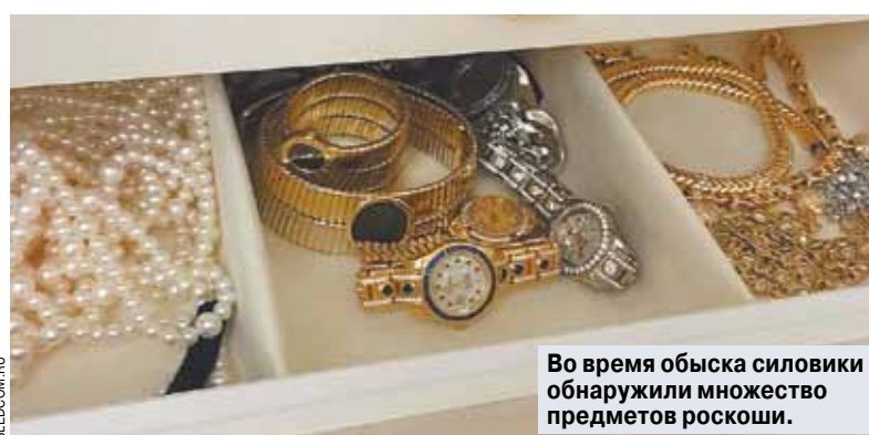
Во время обыска силиковки обнаружили множество предметов роскоши.