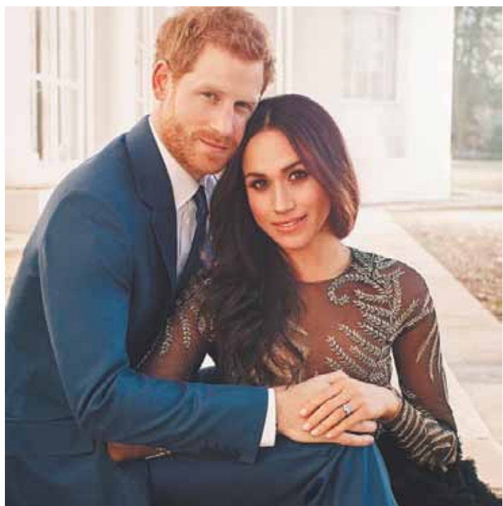
В субботу внук британской королевы Гарри ведет под венец свою избранницу Меган Маркл