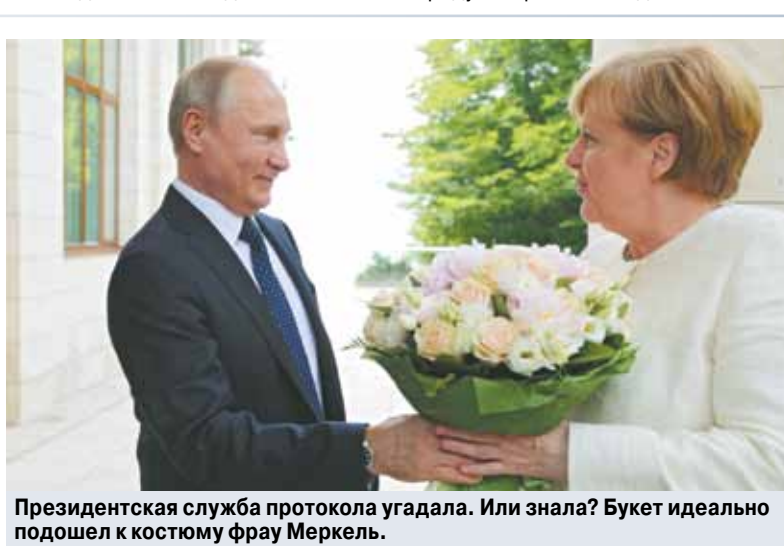
Президентская служба протокола угадала. Или знала? Букет идеально подошел к костюму фрау Меркель.

Поскольку немецкий из трех политиков знали только двое, дальнейший разговор продолжился на русском, который канцлер Германии помнит еще со школы. — Правительство работает? — поинтересовалась Меркель. — Вот только что премьер сформировал, — похвалил Медведева Владимир Путин, который встречал гостью с букетом красных роз, идеально подходящих под цвет ее блейзера. — Деспосоное, — заверил Медведев. — Можем работать, ждем ваших контактов. — Ну счастливого пути! — пожелала Меркель, углубляясь внутрь резиденции, с интересами которой она уже успела ознакомиться в прошлом году. Традиционного рукопожатия и приветствия для прессы на этот раз не было. Но по благодущию выуду фрау канцлера можно было сделать вывод, что в отношении двух стран уже нет тех противоречий, которые с 2014 года мешали их сотрудничеству. Напротив, после победы Трампа