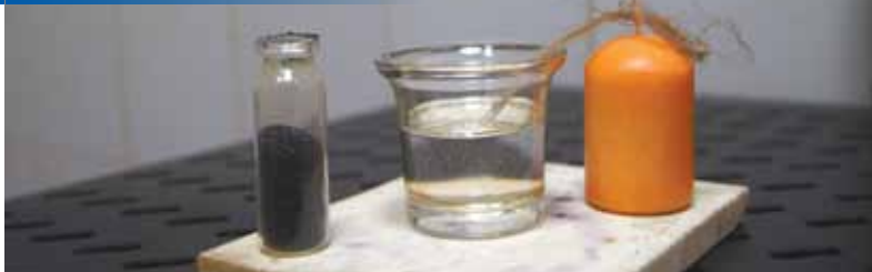
Чтобы получить огонь, мы смешали раствор глицерина и порошок перманганата калия, проще говоря — марганцовку.

Понятно, что никакую стеклянную посуду в кувуклию пронести не будут, да и вряд ли члены духовенства втхую