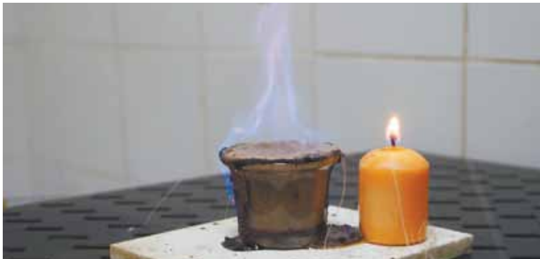
Через несколько минут после смешивания смесь забулжила, а потом резко вспыхнула синим пламенем.