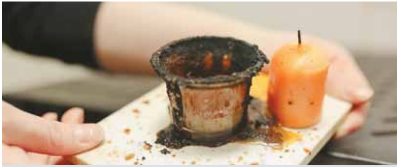
Тушить огонь нужно не водой: лучше ограничить доступ кислорода, накрыть чем-нибудь стакан, или использовать огнетушитель.

химитаться в уголке. Но существует похожий метод, где вместо глицерина берут концентрированную серную кислоту. Из компонентов, взятых в определенном соотношении, делают кашку. Ее небольшое количество — буквально спичечная головка или меньше — наносит на фитиль свечи, который через какое-то время загорается. Для верности на фитиль можно прикрепить крошечный кусочек бумаги. Увы, у нас при опыте с глицерином нужен был довольно большой объем марганцовки, который нанести на свечку незаметно точно не получится.