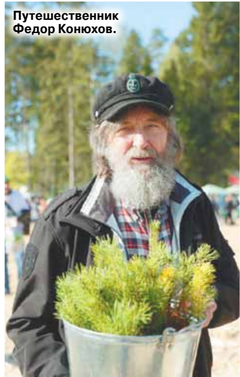
Путешественник Федор Конохов.

Более 700 тысяч молодых деревьев высадили в Подмосковье в субботу на экологической акции