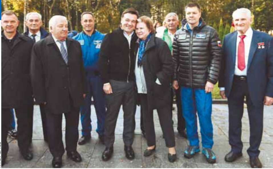
Андрей Воробьев с космонавтами в Звездном городке.

области — это леса. Жители наших городов от мала до велика выходят и сажают деревья. Очень приятно, что такая традиция приживается. Раньше мы сажали преимущественно леса, потому что были вынуждены бороться с жуком-короедом.