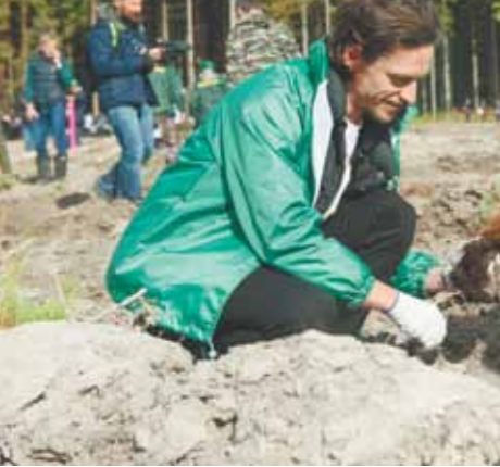
Артист балета Сергей Полунин сажает сеянцы сосны.

Так получилось, что в этот же день легендарный Звездный городок отмечал свой день рождения. Поздравить его жителей с праздником приехал Андрей Воробьев.