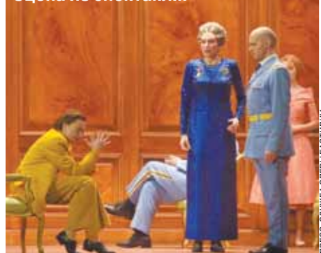
Сцена из спектакля.