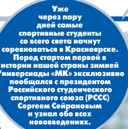
Уже через пару дней самые спортивные студенты со всего света начнут соревноваться в Красноярске.