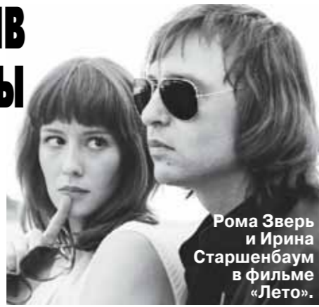
Рома Зверев и Ирина Старшенбаум в фильме «Лето».