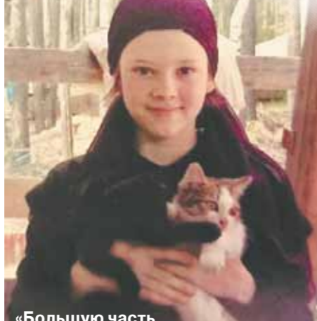
«Большую часть времени мы работали».