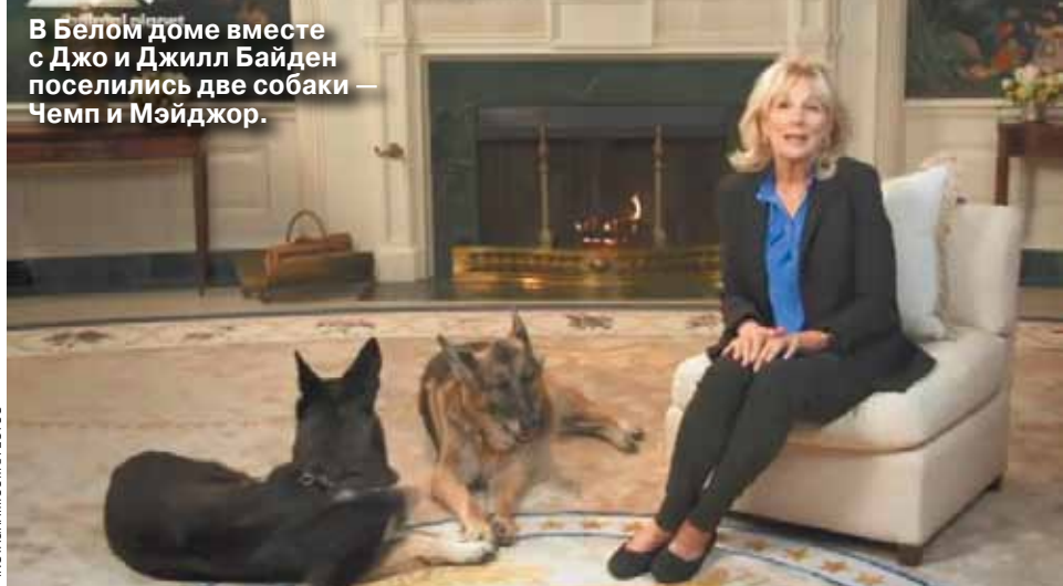
В Белом доме вместе с Джо и Джилл Байден поселились две собаки — Чемп и Мейджор.

Лав стори 46-го американского президента и его супруги широко известна. Пара познакомилась после того, как сенатор Байден одолев — в результате ДНП погубил его жена Нейли и я догадавая дочь Наоми, а молодой политик остался с чудом выжившими в катастрофе двумя детьми — сыновьями Бо и Хантером.