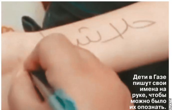
Дети в Газе пишут свои имена на руке, чтобы можно было их опознать.