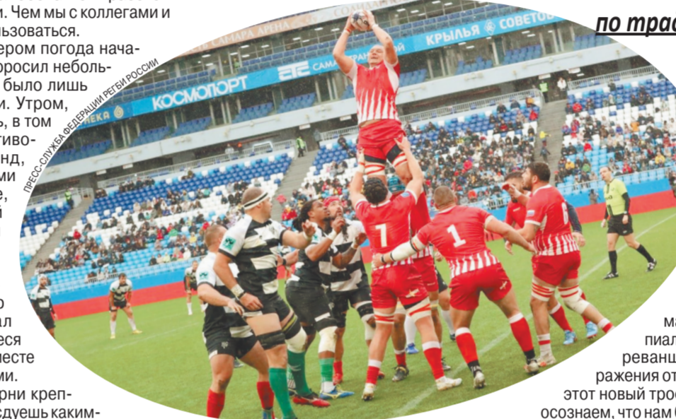
В Самаре прошел первый в истории матч по традиционному регби.