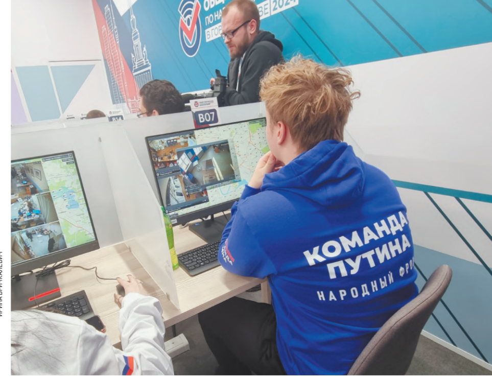
— это беспрецедентно много.

При этом самым популярным среди московских избирателей способом реализации избирательного права стало дистанционное электронное голосование.