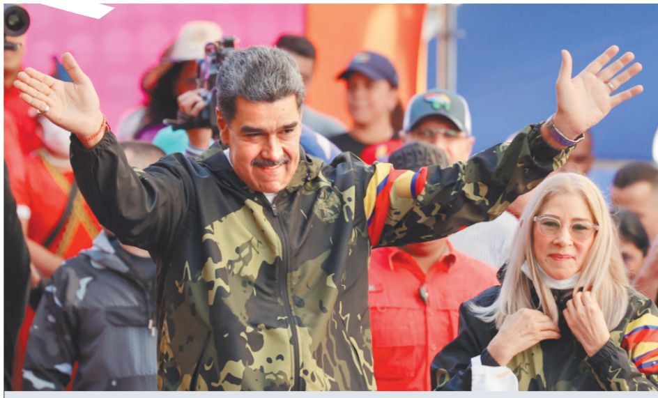
Первым среди мировых лидеров Владимира Путина с победой на выборах поздравил президент Венесуэлы Николас Мадуро.

Как бы то ни было, но западным лидерам стоит признать, что приходили голосовать (несмотря ни на что) граждане России и за рубежом. В том числе в самых антироссийских точках мира. Интересно, что и граждане других стран демонстрируют совершенно противоположную точку зрения по поводу