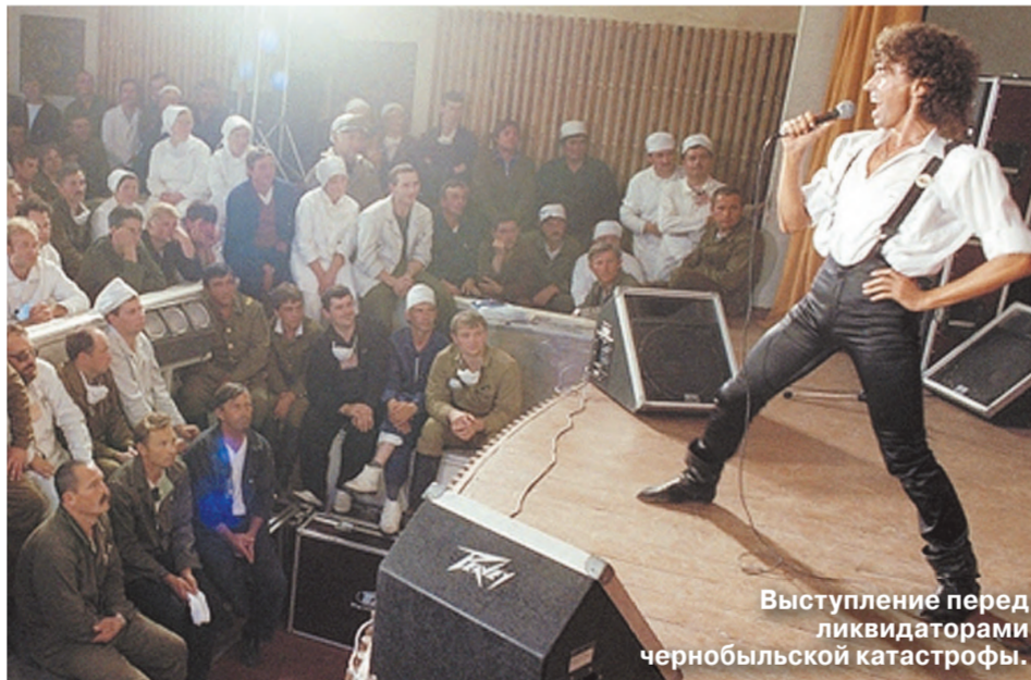
Выступление перед ликвидаторами чернобыльской катастрофы.

Но восхищаясь образами Вечного Казанова, мало что при этом зная, что самого Валеру раздражает, когда его имен в плане одежды упорно связывают только с сумасшедшими сценическими костюмами. «Да, у меня есть шкаф под названием «Поп-звезда», а есть шкаф «Классика», — говорил он мне, — и там у меня висят смокинги, костюмы, галстуки. Я, вопреки стереотипам, приемлю и костюмы, и галстуки — просто все должно быть умно и к месту. Я очень люблю, когда оно все в жилу. Например, когда ты стоишь у роляра в выемке и поешь с Раймондом Паулсом, то не в плашках же стоять! И не в шортах! Это требует академического костюма — и они у меня есть, и я вполне соображаю, когда их надо использовать». Хотя любимый шкаф Леонтьева, по его собственным словам, — «Раздолбай», ближайший литературный аналог — кэжуал (англ. — casual).