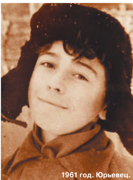
1961 год, Юрвец.