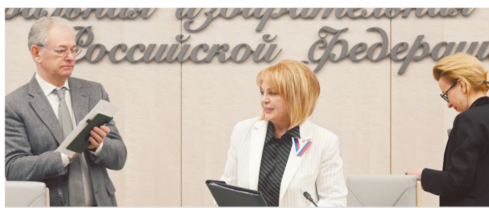
Председатель ЦИК Элла Памфилова вместе со своим заместителем Николаем Булаевым и секретарем ЦИК Натальей Бударинной объявляют предварительные итоги голосования.

Но вот что любопытно. Незадолго до дней голосования появилась информация о грядущей